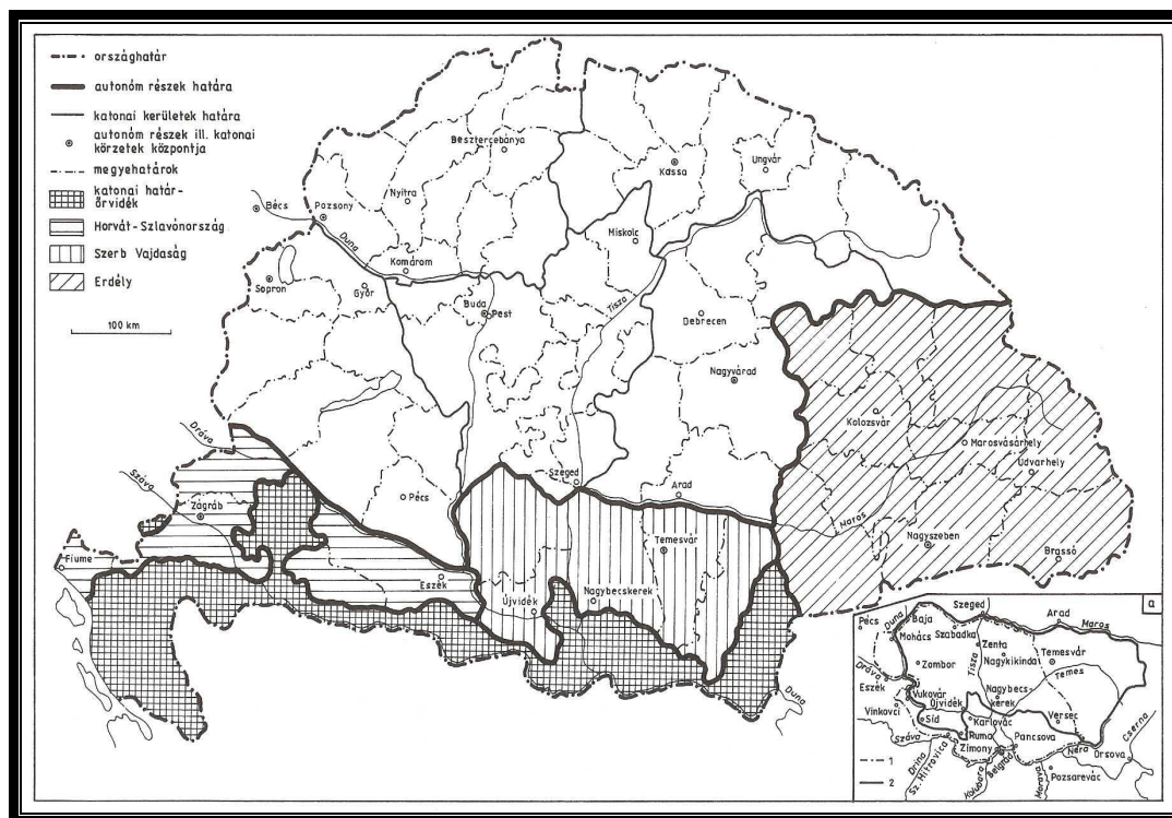
2. ábra: A Szerb Vajdaság és Temesi Bánság 1849-1860