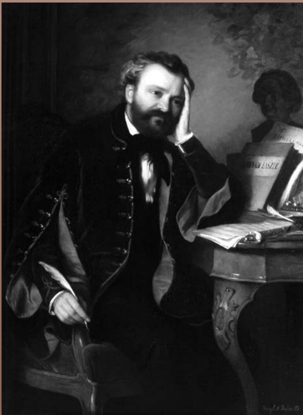
Györgyi Giergl Alajos: Erkel Ferenc (1850-es évek)