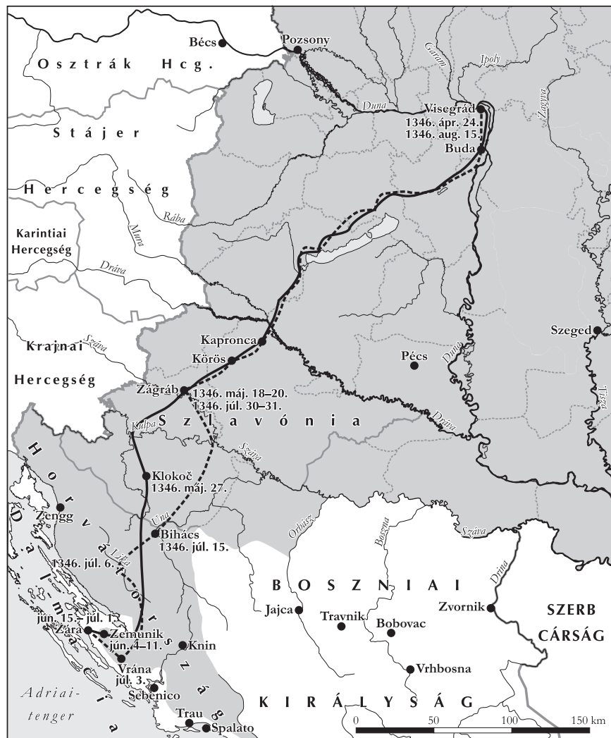
I. Lajos király 1346. évi dalmáciai hadjárata