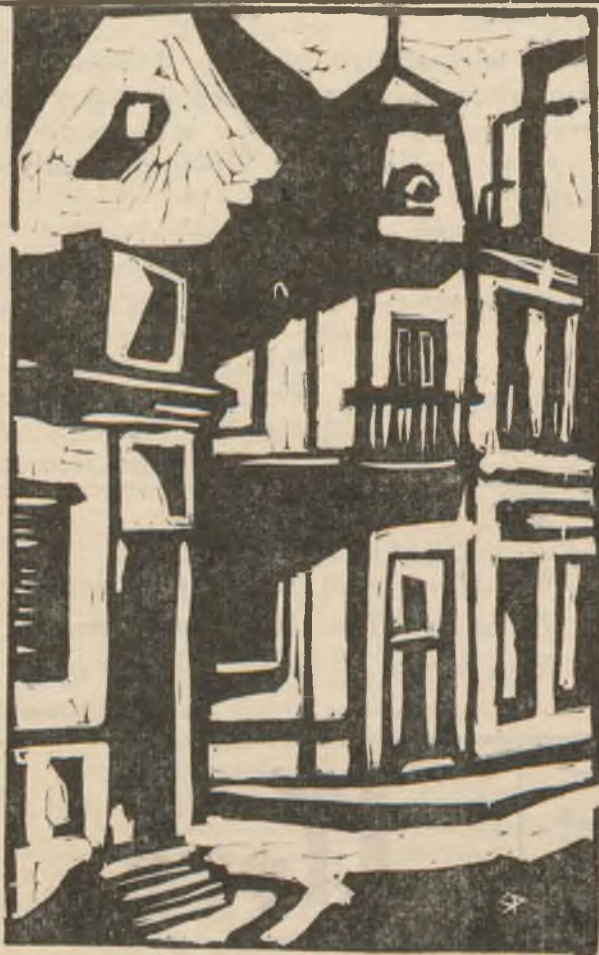
Sugár Péter (linó)

Én belőlem nem harc vágya szól. Magyarország jövődje nem hódítások útján fekszik. Nekem a szabadság békéje kell, nem keresem a véres dicsőséget. Én nem izenek hadat senkinek. De ha valaki a magyar koronához hozzányúl, ha önnállásunkat, szabadságunkat, nemzeti becsületünket megtámadja, ha kihívó daccal kesztyűt vet lábainkhoz; azt mondom: vedd fel nemzetem, s dobd a kihívónak arcához, ha mindjárt az óvilág mesés óriása volna is, ki Ossát Pelionra halmoz ellened. Kossuth 1848. júl. 3-i beszédéből.