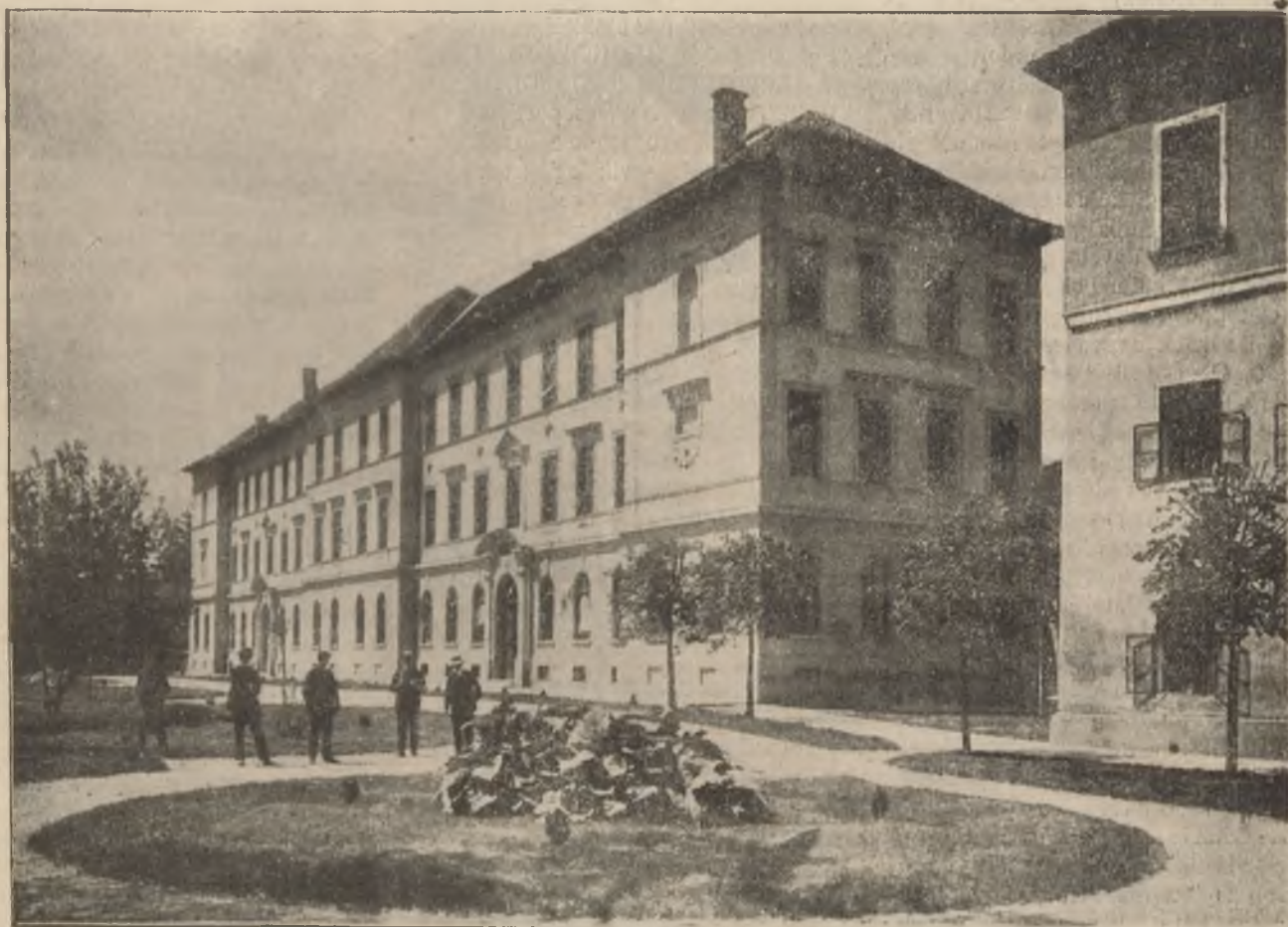
Késmárk. Az ev. liceum új épülete.