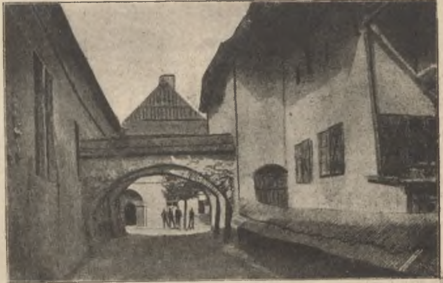
Késmárk. Stenczelköz, háttérben a Palesó-ház.