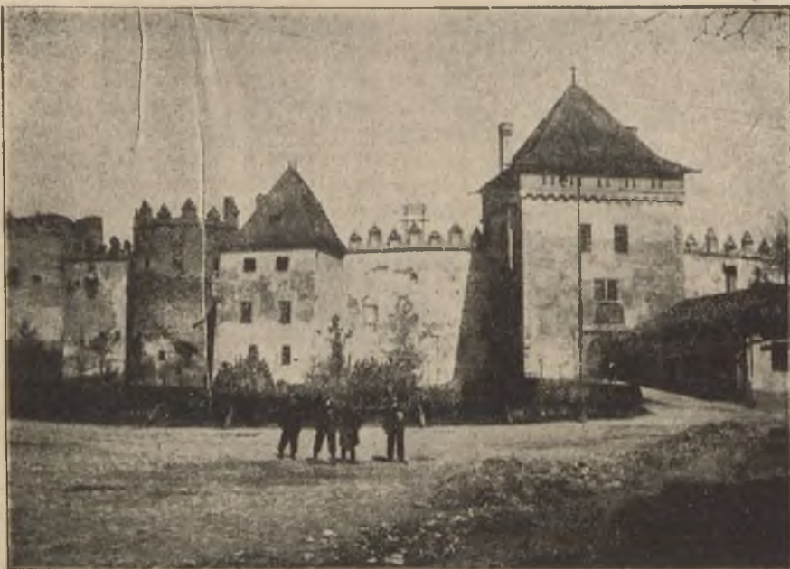
Késmárk. Thököly vár. A Vár-utca felőli főbejárata.