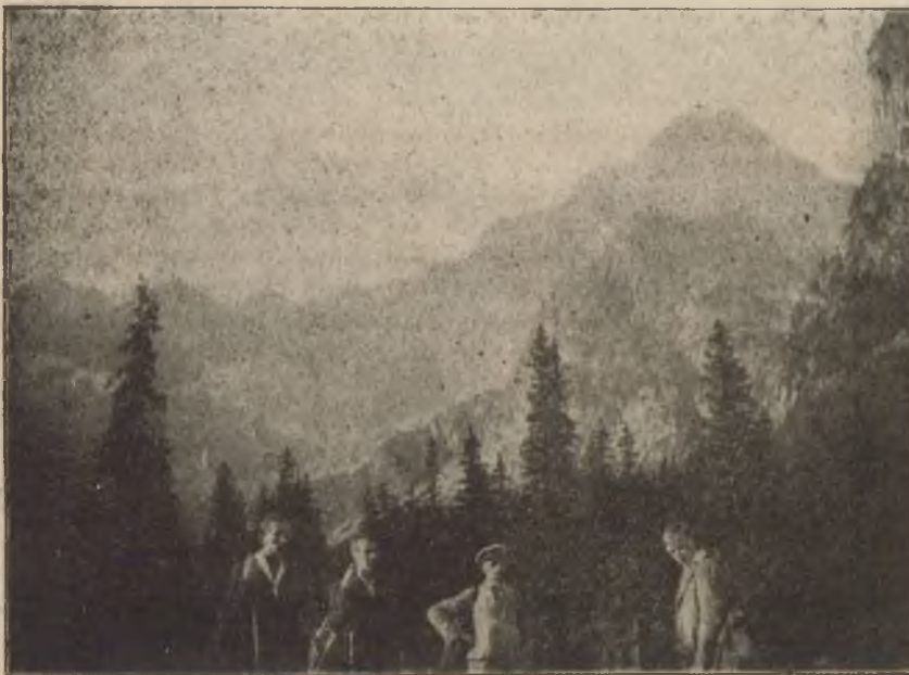
Turistáskodó késmárki diákok a Magas Tátrában.