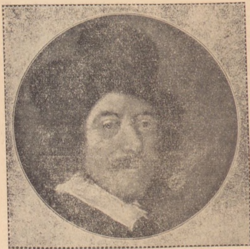
Franz Hals önaréképe. Festette 48 éves korában. Eredetije olajfestmény. Rathaus-múzeum, Harlem.

Sötétszürke, lompos fellegek lógtak Harlem álmos jegenyefái felett. Esőcseppek fénylő gyöngysorai szegélyezték az utakra hajló