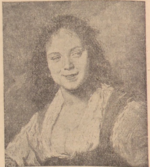
A cigányleány, 1629. Az eredeti Louvrebán, Paris.