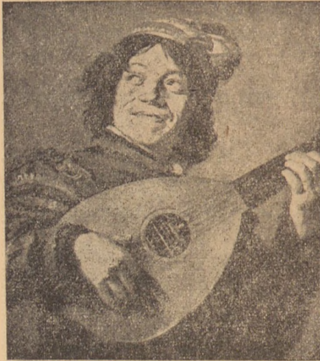
A komédiás, festette Hals 1633-ban. Az eredeti Rijks-múzeumban, Amsterdam.

egyik asztalnál szidták a spanyolokat, meg a katolikusokat. A diákok a feltalálásokat meg a felfedezéseket számolgatták. Nagyon dicsérték az élvezetes dohánypalántákat, meg a pompás burgonyát. A fiatalok asztalánál Frans volt a senior, „a harlemi mulatozó”. Mindenki őt nézte. Egy háromliteres ónkupa volt előtte, megragadta az italt, magasra emelve éltette Hollandiát, másodszer a művészetet, harmadszor a szép asszonyokat. A zenészek és a dudások azon pillanatban rázendítették a „Muskétások dalát”. Énekelni kezdett az egész terem, fiatalok, öregek, csaposlegények, szolgálóleányok egyaránt.