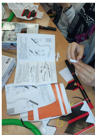
Esetleg műszaki szakember?