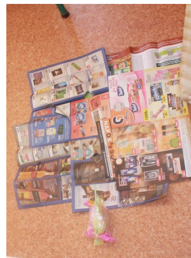
Működik a gravitáció?