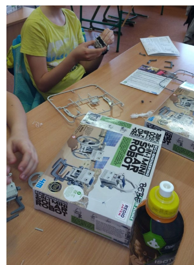
Tudom-e értelmezni a leírást?