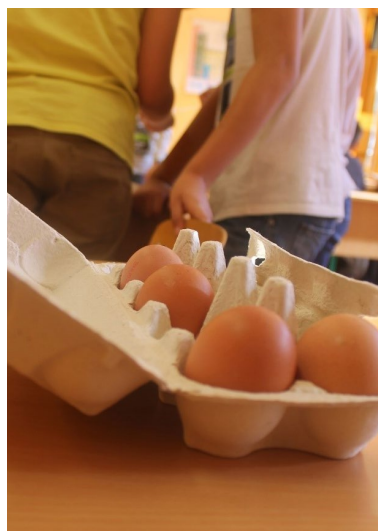
A tojás és a gravitáció