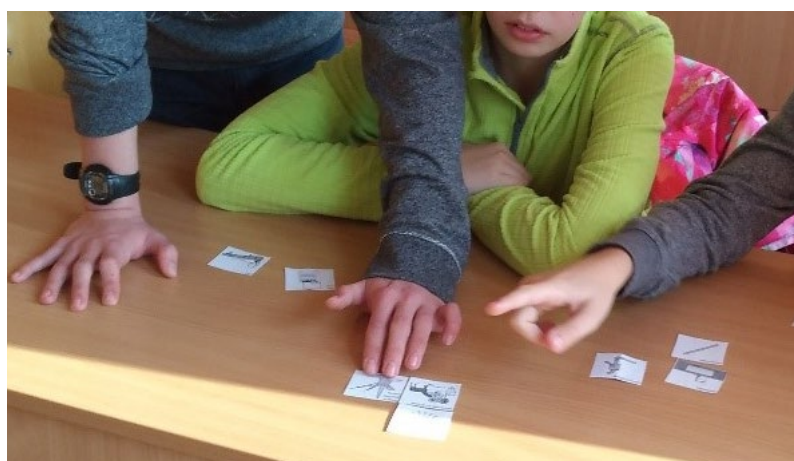
Mi leszek, ha nagy leszek?