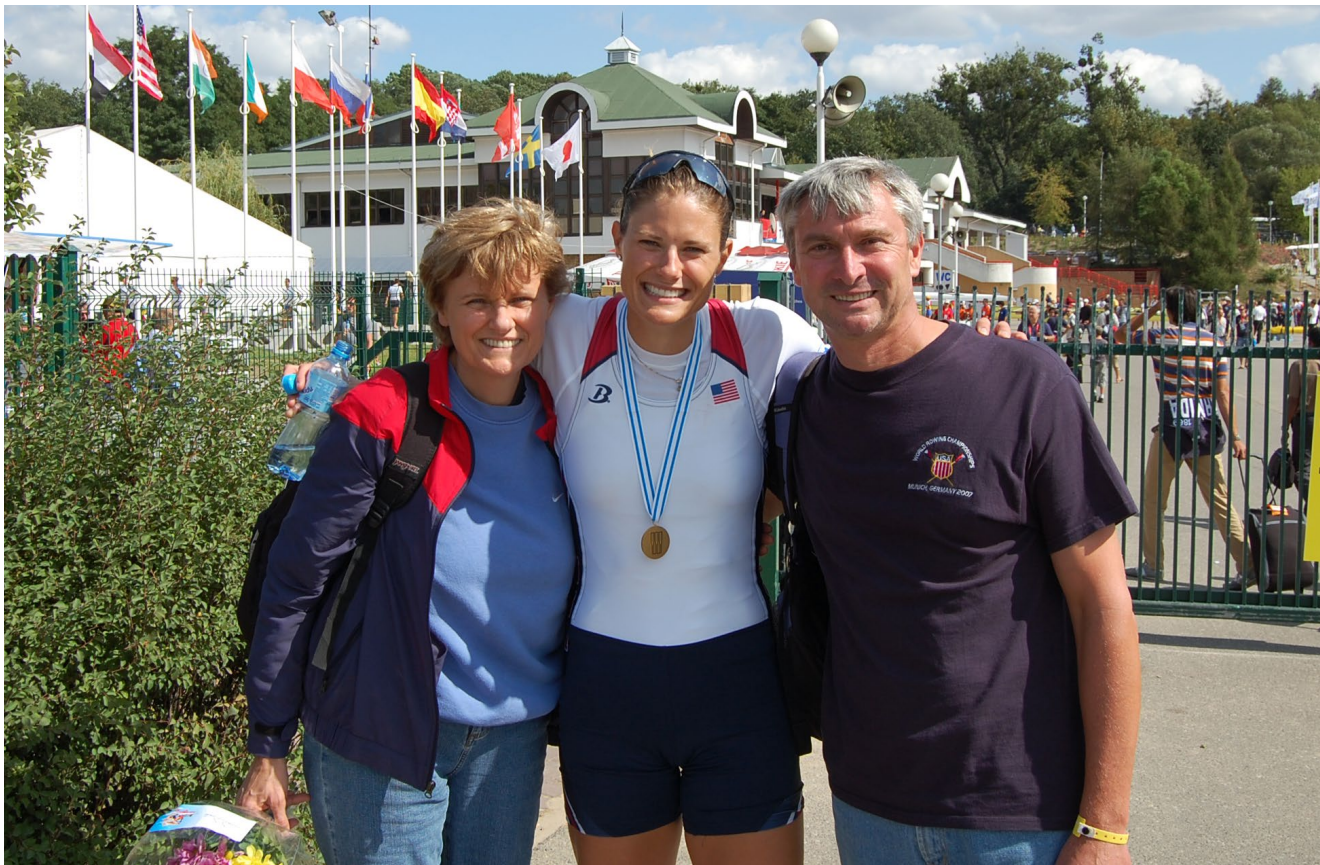
Karikó Katalin családjával Poznańban (2009)