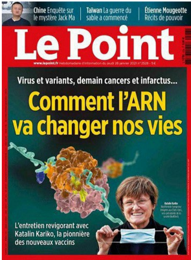
Karikó Katalin a Le Point című francia magazin címlapján

Megemlítek egy érdekes tesztet a Lyme-kórral kapcsolatban, ami állatkísérletek során már ígéretes eredményeket mutatott. A kullancs nyálában lévő 19 különböző fehérjét kódoló mRNS-sel immunizálták az állatokat, s mielőtt a kullancs megcsípte az így immunizált állatot, a szervezet azonnali immunreakciója megakadályozta a kullancs által terjesztett kórokozók – például a Lyme-kórt okozó baktérium – terjedését a szervezetben. Ezen kívül többféle ellenanyagot kódoló mRNS-t is elkezdtek kifejleszteni a kutatók, amelyek a rákos sejtek felszínén megjelenő tumorspecifikus fehérjékre hatnak.