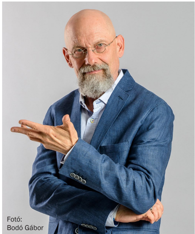
Fotó: Bodó Gábor

A TETT-mesepályázat ( www.tettmesepalyazat.hu ) alapmotivációja tehát az volt, hogy felismertük, nem elég csupán az egyetemek felé „nyúlni”, hanem be kell vonzanunk az általános- és középiskolásokat is. A Richter tehát úgy érzi, hogy feladata segíteni a természettudományos képzést, hiszen a cég mint az ország legnagyobb gyógyszeripari vállalata, jelentős kultúraformáló erővel is rendelkezik. Ezért felmerült az az ötlet, hogy vegyük figyelembe, milyen újszerű oktatásmódszertani megközelítéssel tudnánk hozzájárulni ahhoz, hogy a gyerekeket közelebb vigyük a természettudományokhoz. A TETT-ben rejlik ilyen irányú potenciál a hazai