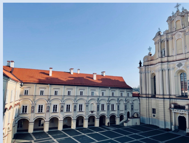
A Vilnusi Egyetem a Szovjetunió területén alapított első jezsuita akadémia jogutódja (1570)

Reméljük, hogy a konferencián bemutatott izgalmas kezdeményezések és adaptációra váró ötletek a résztvevő magyar pedagógusok és a Történelmi Társulat révén minél több osztályterembe eljuthatnak.