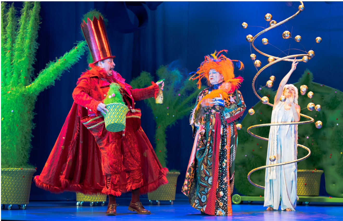
A Tündérszép Ilona és Árgyelus királyfi című előadás a Vaskakas Bábszínházban

az akkor benyújtott pályázatötletünk, és megkaptuk a lehetőséget, hogy megszervezzük a Győrköcfesztivált.