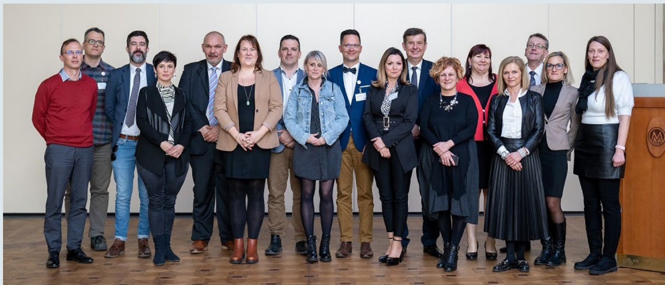
Az Oktatási Hivatal munkatársai

magas szintjén a szerzők és a szaklektorok kéréseinek figyelembevételével történt meg a fejlesztés. Igyekeztek a legköltséghatékonyabb nyomdatechnikai megoldásokat megtalálni a minőségi kivitelezéshez, a taneszközöket több kötetre bontva, dobozos formában, gyűrkapcsos lehetőséggel látták el. Az oldalak sorrendje felcserélhető, így a tanuló csak azokat a lapokat kapja meg, amelyek az ő adott szintjének megfelelőek. Ezen felül a differenciálás érdekében kihajtható oldalak, illetve thermofólia segítik a használatot.