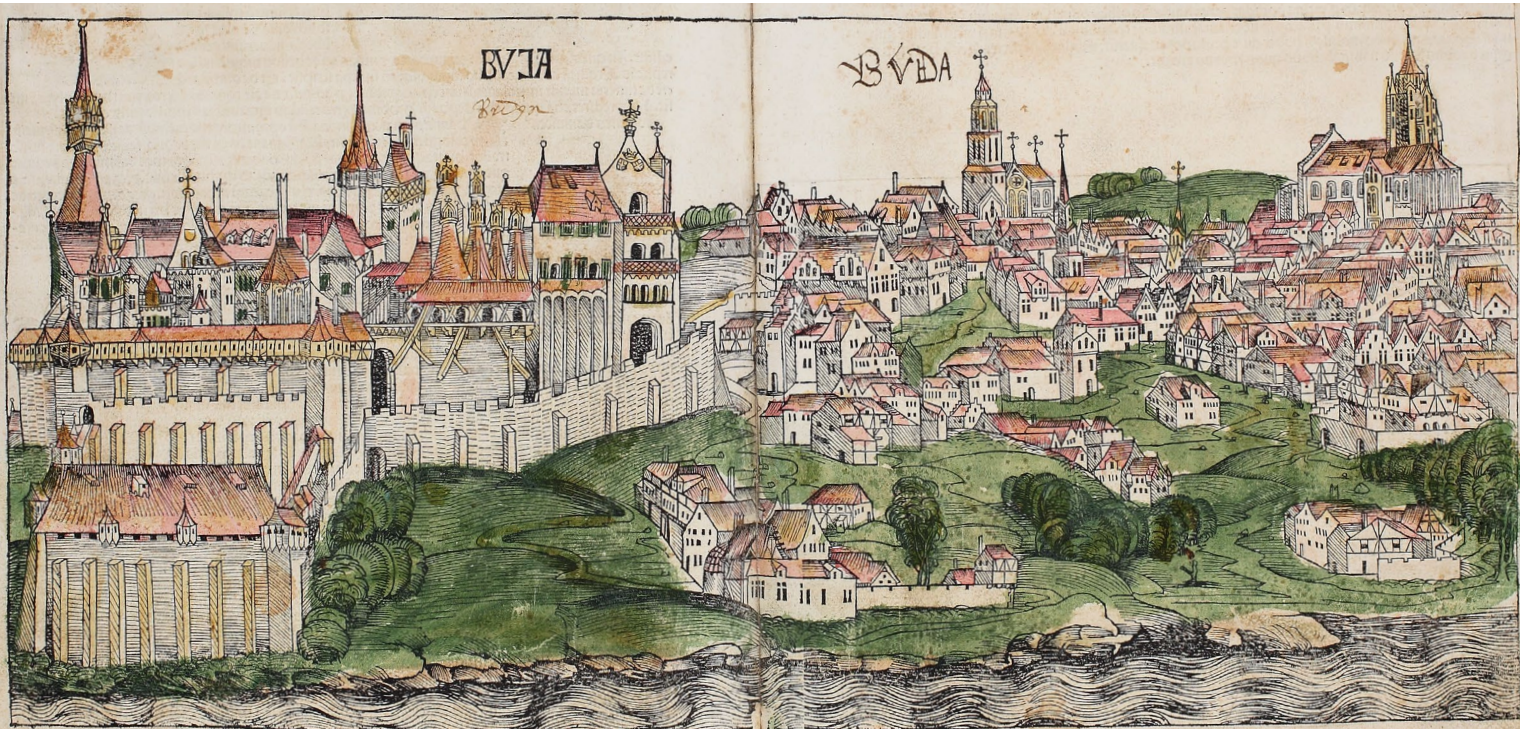
Buda ábrázolása a Schedel-krónikában

Hess nyomdai kiadványaiból nem sokat ismerünk. A leghíresebb és legterjedelmesebb a Budai Krónika , amelyet korábbi kéziratok alapján készített el a mester, és a magyarok történetét meséli el. A könyv nagyon jól reprezentálja, hogy valóban a nyomtatás korai időszakáról beszélünk, ugyanis nem tartalmaz borítót, a csatolt képen jól lehet látni a kiadás helyét, készítőjét. Megfigyelhető az is, hogy milyen betűtípust használt; a betűtípus Rómára utal, a klasszikus reneszánsz antik jegyeit mutatja. A nyomáshoz egyszínű tintát használt, majd a nyomás után – ahogyan az a csatolt ábrán is látható – piros színnel húzta ki a címeket és a kezdőbetűket. Ez a fajta kihúzás is jól mutatja, hogy valóban egy korai fázisról lehet beszélni. A Budai Krónika mellett említeni lehet még egy kisebb munkát, amely két alkotást foglal magába. Az egyik A költők olvasásáról ( Basilius Magnus: De Legendis Poetis ) szóló munka, a második része Szókratész védőbeszédét ( Xenophon: Apologia Socratis ) foglalja össze. A két munka terjedelmében sokkal kisebb, mint a Budai Krónika . Amíg első munkája összesen 70 levélből, azaz 133 nyomtatott oldalból, addig Hess második munkája minösszesen csak 20 levélből áll. A második munkája utánnomás, tehát már egy meglévő munkának a lemásolása volt, ami napjainkkal ellentétben nem von maga után semmilyen szerzői vagy jogi kérdést. A két munkának közös a nyelve, ugyanis mind a kettő latin nyelven íródott.