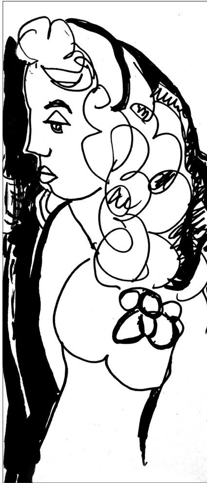
Leányarckép félalakban, 1976 körül. Tus, filc, papír. 223 x 97 mm. J.n.

Májusban így tör a láz Marie-ra tervei csúcsán, az izgalmak verőfényében akár utolsó fellángolása is lehetne hatvanhét évesen sem egészen a 40 fok verejtéke arcát pirosítja csak hideg ujjai maradnak sebzett, elhaló cinegék.