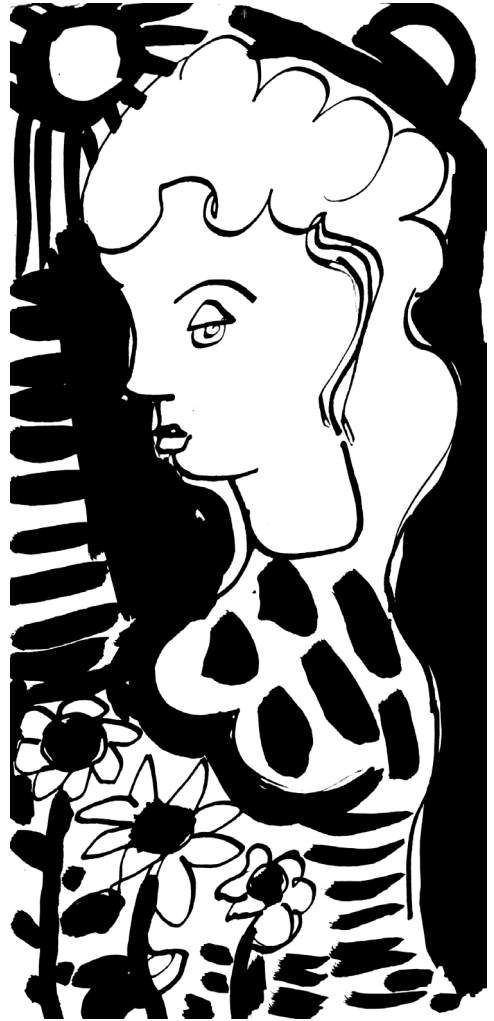
Lány és virágok, 1973 körül. Tus, papír. 200 x 90 mm. J.n.

Melírozott gesztenyefa állsz előttem Ébredő reggelem beissza álmom, Melissza! Fellángol az őszi hiányom Karcsú derekad hajol utamra Múlt patinás zöldje Épen ébreszti reményem A göndör lázas ága Ifít az odúja fúvó lángja!