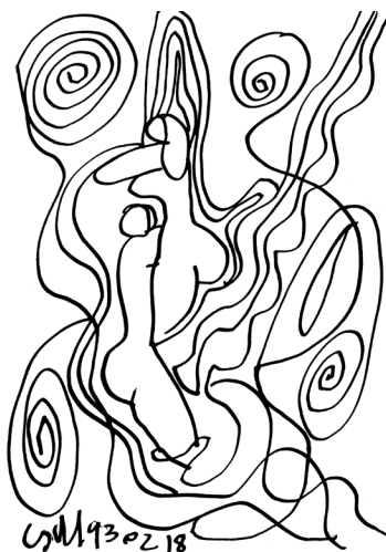
Szerelmespár csigahálóban, 1993. Tus, papírkarton. 230 x 160 mm. J.b.l.

Holdnak integettem, felém világoljon: két nagy kosár dolog vár még engem otthon.