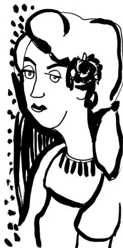
Merengő (nőalak), 1976 körül. Tus, papír. 283 x 135 mm. J.n.

Aztán elcítáltak a pékség alkoholista rendészéhez, aki megfenyegetett, hogy soha nem leszek az üzemben vezető beosztásban. De bántam is én már akkor, hogy miként bíraskodnak felettem, hiszen egyszer s mindenkorra eldöntöttem, hogy forradalmárság ide vagy oda, megyek egyetemistának.