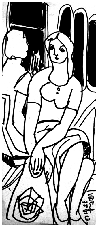
Villamoson, 1975. Filc, papír. 223 x 95 mm. J.j.l.

( Móricz Zsigmond Megyei és Városi Könyvtár – Nyíregyháza, 2015 )