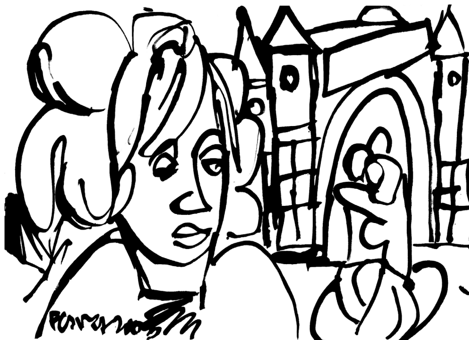
Emlékezés, 2003. Diópác, papír. 297 x 419 mm. J.b.l.

Találkozunk...? Ahogy ismerősöktől, volt diákoktól, tanároktól hallom, az érettségi találkozókban csalódnak kissé. Mert a várt összejövetelek formálisra sikerednek manapság. (Főleg, ha ehhez ügyetlen szervezés is párosul.) Ezzel az egykoron szép formával nem tudunk mit kezdeni. Noha vannak évtizedeken átívelő, barátságos, meghitt példák, programújtó társaságok, a régi sémákat másoljuk, nincs íze, hangulata a dolognak. Inkább étellel telibb, ha menet közben tartjuk egymással a kapcsolatot, így vagy úgy, többé-kevésbé rendszerességgel, de tudunk egymásról. Elég egy rövid üzenet, Hegymagasról vagy Velencéből, nagyzolás nélkül: Szevasz, te süket. Ha nem, hát majdnem idegenek találkoznak, az érettségi régen volt, a köztes időben sok minden és sok mindenki változott – mit kezdjünk egymással? Panaszkodunk, dicsekedünk, motyogunk. Az idő is eljárt a diákok feje fölött, az életutak más és más irányokat vettek, az eltérő egzisztenciák, pozíciók már kerülnek a haveri hátbavágást, még a régi csibészes mosoly is viszonzatlan. De az emlék bennünk él, a mi élettörténetünk része.