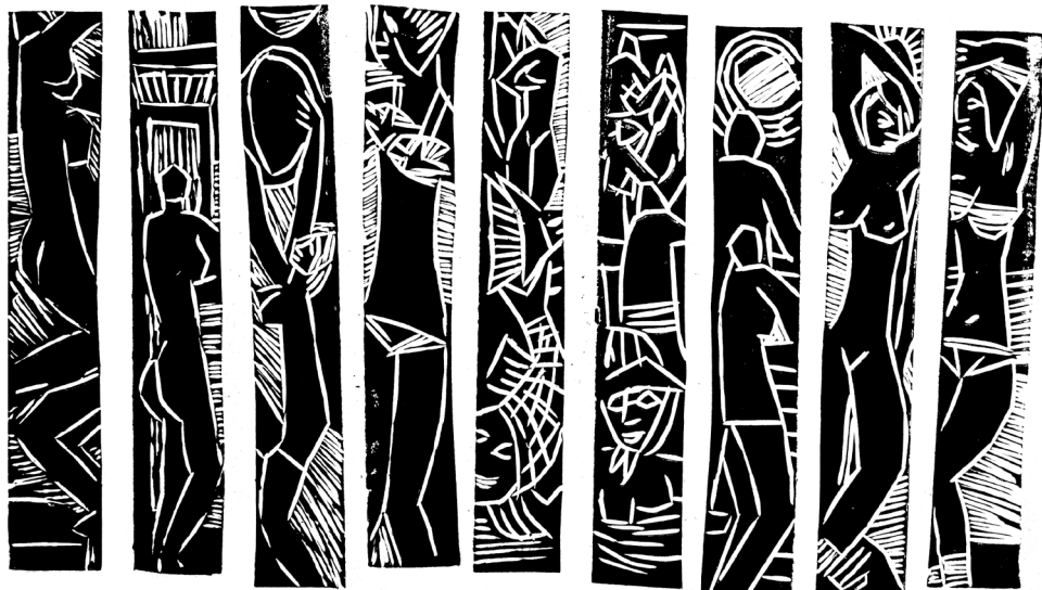
Emlékek tolulása, 1975 körül. Linómetszet, 257 x 450 mm. J.n.