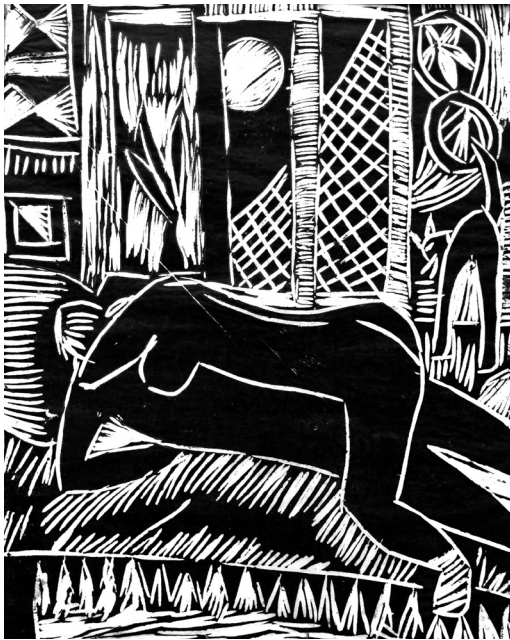
Szeretkezők, 1978 körül. Linómetszet, 390 x 315 mm. J.n.

nagy görbe orr, a grand szenyor, balek volt rég a szentem? – kioktatott – ne dőlj be sohse nőnek, ha szerencséd van, le se lőnek