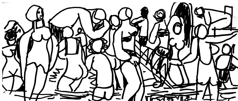
Strandi pillanatkép, 1975. Filc, papír. 96 x 226 mm. J.j.l.