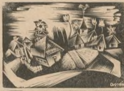
Bordás Ferenc metszete.

A Faluszemináriumnak ides-tova 10 éves multja van már. Ebbe a kis írásban az elmúlt egy év munkájáról adunk rövid jelentést.