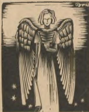
Bordás Ferenc metszete.