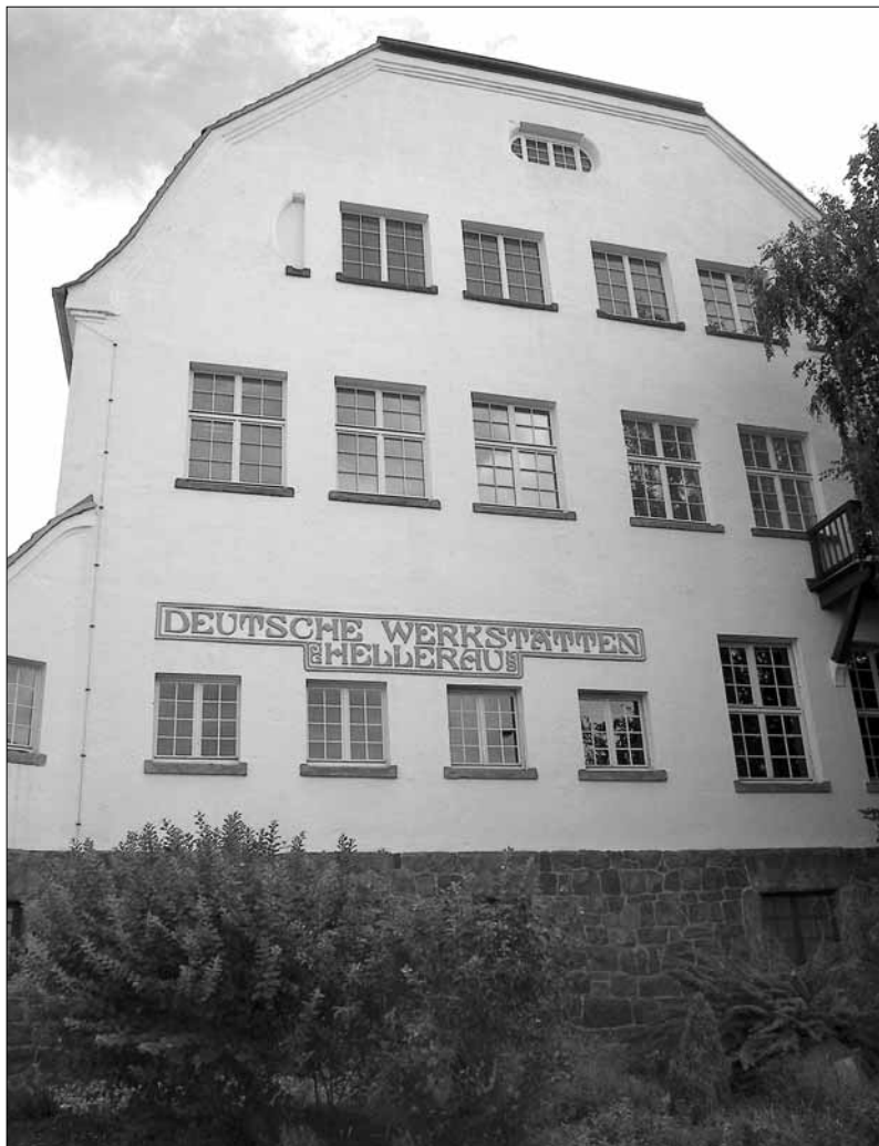
A Deutsche Werkstätten utcai homlokzata

gyárat helyezte Hellerauba, hanem a munkavállalók s más érdeklődők számára egyaránt nyitva álló kertvárost alapított, amelynek eszmei középpontja és legfontosabb közösségi funkciója az egész életvitelt befolyásolni, reformálni hivatott Festspielhaus, az ünnepi játékok háza lett. Pusztán saját anyagi érdekei szempontjából, amelynek lényege, hogy minél egészségesebb és motiváltabb munkavállalói legyenek, Schmidt meg is állhatott volna a gyári munkástelep akkor már Európa-szerte ismert modelljénél. Schmidt azonban jóval többre törekedett. Egyrészt tudatosan külön cégekbe szervezte az alapítandó kertváros telkeit felvásároló társaságot és a házakat később építő szövetkezetet, mindkettőt megnyitva nemcsak a Deutsche Werkstätten dolgozói, hanem minden más, a reforméletforma iránt nyitott, külső érdeklődő számára is. Másrészt a kertvárost eleve a legmagasabb művészi színvonalon akarta megvalósítani. A városépítési koncepciót – akárcsak a Deutsche Werkstätten eleven, szabad tömegformálású épületszoportját – Richard Riemerschmid tervezte, akit neves