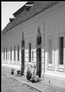
A hátsó borítón: Alsóbogát, Kiskastély