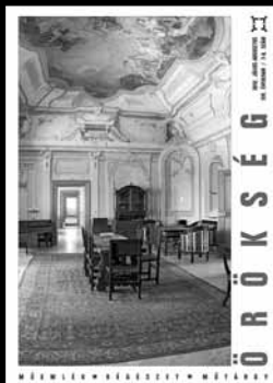
A címlapon: Alsóbogát, a Kiskastély díszterme