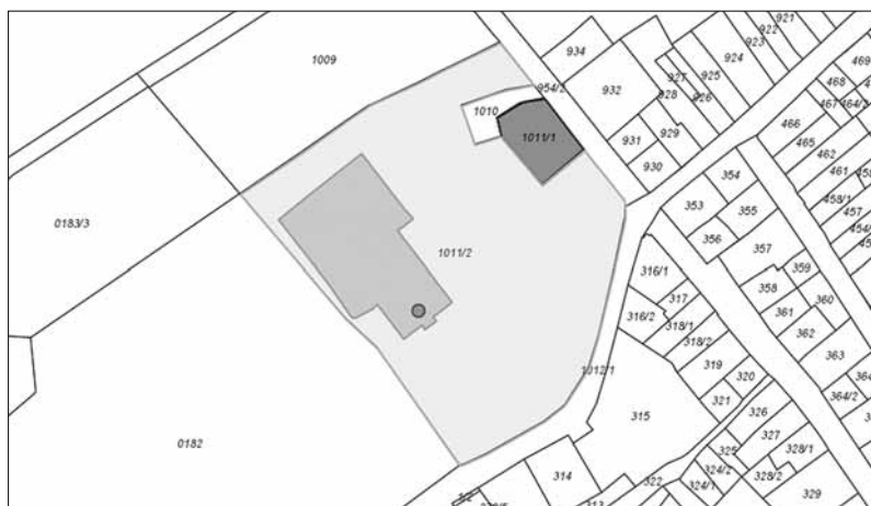
A lovasberényi kastély védéskori és mai földrészlete egy utódingatlannal

„műemlék: a földben vagy a föld felszínén lévő ... építmény, épületrész, rom, ...”.