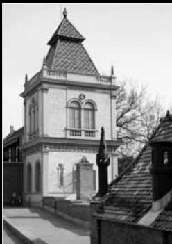
A hátsó borítón: A Zsolnay-ház sárga kerámialapos „mintatornya”