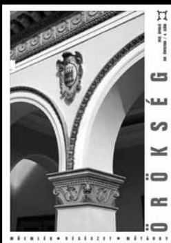
A címlapon: A pécsi Zsolnay-ház, a pártázat alatt és az oszlopíj között a Fünfkirchen-címerrel