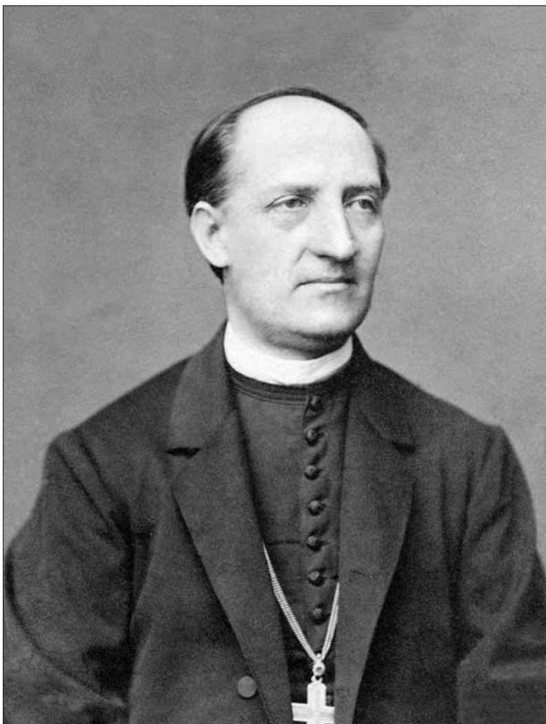
Ipolyi Arnold (1823–1886)

tanács között még évekig, lassú előrearszólással folytatódott, ezért Henszlmann 1865. augusztus 29-én a Magyar Orvosok és Természetvizsgálók pozsonyi gyűlésén keresztül folyamodványt nyújtott be az országgyűléshez. Néhány hónappal a kiegészítés előtt jutott csak nyugvópont-ra az ügy, mert az 1866. november 8-án kiadott legfelsőbb elhatározás az Archaeologiai Bizottságra ruházta a központi bizottmányi teendőket úgy, hogy szabályzatát a tervezett országos műemléki bizottmányával kiegészítik, konzervátorait a Magyar Kancellária nevezi ki, mindezt azzal a feltétellel, hogy a bécsi bizottmányt