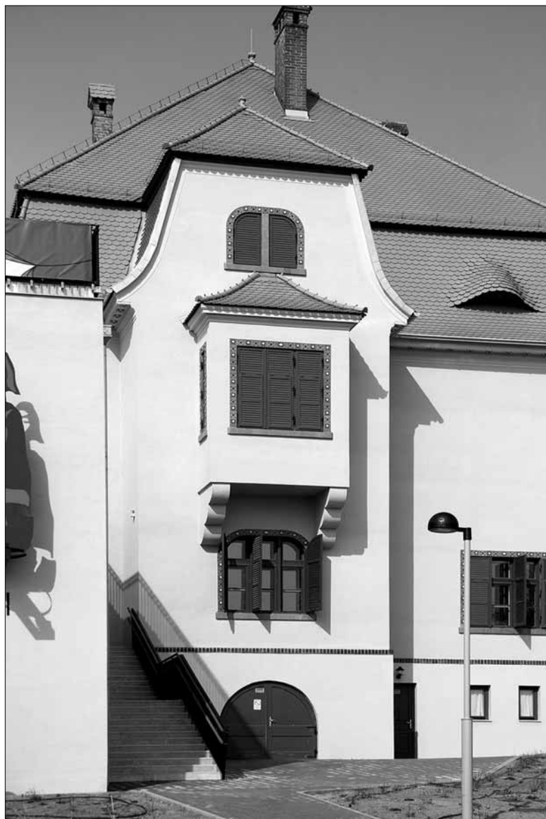
A Mattyasovszky-báz a Bóbita bajléka lett

Belépve a könyvtárba, különleges kép fogad: olvasóterem az egykorvolt égetőkemencék belsejében, a külső falakon kirajzolódnak a befalazott kemenceajtók. A funkcióváltás diadala – mondhatjuk elismerően, s kétségtelenül arról van szó, itt úgy őriztek meg és keltettek életre tereket, hogy közben valóban új érték született. S fölpillantva jól látható