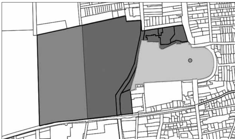
A keszthelyi kastély védéskori és mai földrészlete utódingatlanokkal

Megállapítható tehát, hogy a 13. sz. tvr. jogi műemlék fogalma és a műemlékké nyilvánítással védetté váló ingatlan korabeli fogalma igen széles értelmezési lehetőséget biztosít arra vonatkozóan, hogy a védetté nyilvánított, nevesített építményen túl valójában mi is vált védetté. E széles értelmezési lehetőségnek a műemlék fenti jogi meghatározásának nyelvtani értelmezése – olyan építmény (épület, épületrész, földmű) és tartozéka, amelyet... a művelődésügyi miniszter műemlékké nyilvánít – azonban némileg ellentmond, s a széles értelmezési lehetőséget a korabeli egyedi védetté nyilvánító jogi aktusok nevesítési gyakorlata – már amennyire ez rekonstruálható, a kis számban fenn-