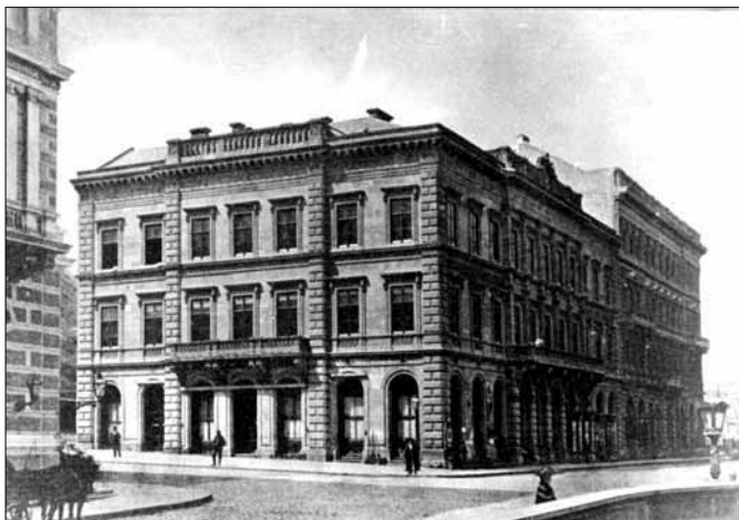
Budai Takarékpénztár, 1862. Clark Ádám tér – Fő utcai látvány

működött, a maradék telken kerthelyiséggel, a földszinten.) A rendkívül értékes telek „mellesleg” a fővárosi Világörökség budai oldali területének súlypontja, innen páratlan a körkilátás a Dunára, Pestre és Dél Budára, valamint a rálátás ide, a pesti