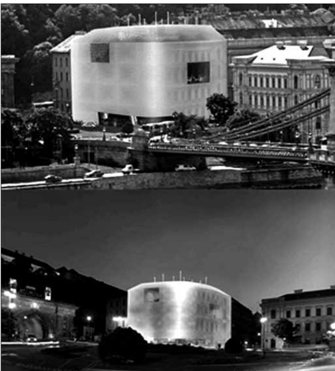
„Az arany szín nemes fénye egy óriási tartály semmilyen felületén ragyog...”

Az első kérdésre a válasz igenlő lett, a másodikra – szerintem – határozott a NEM.