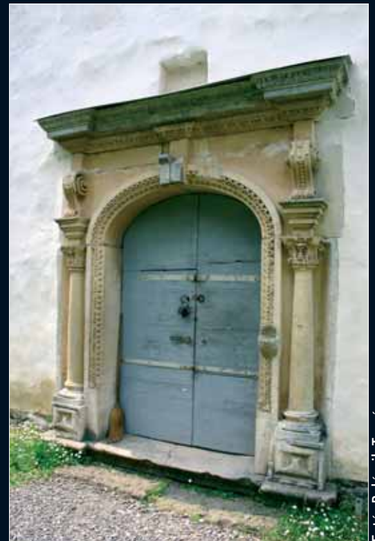
Mikháza, a ferences kolostortemplom bejárata