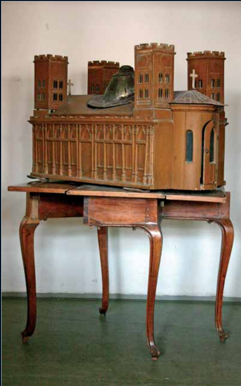
Pollack Mihály 1805-ben ilyennek képzelte el a pécsi székesegyházat