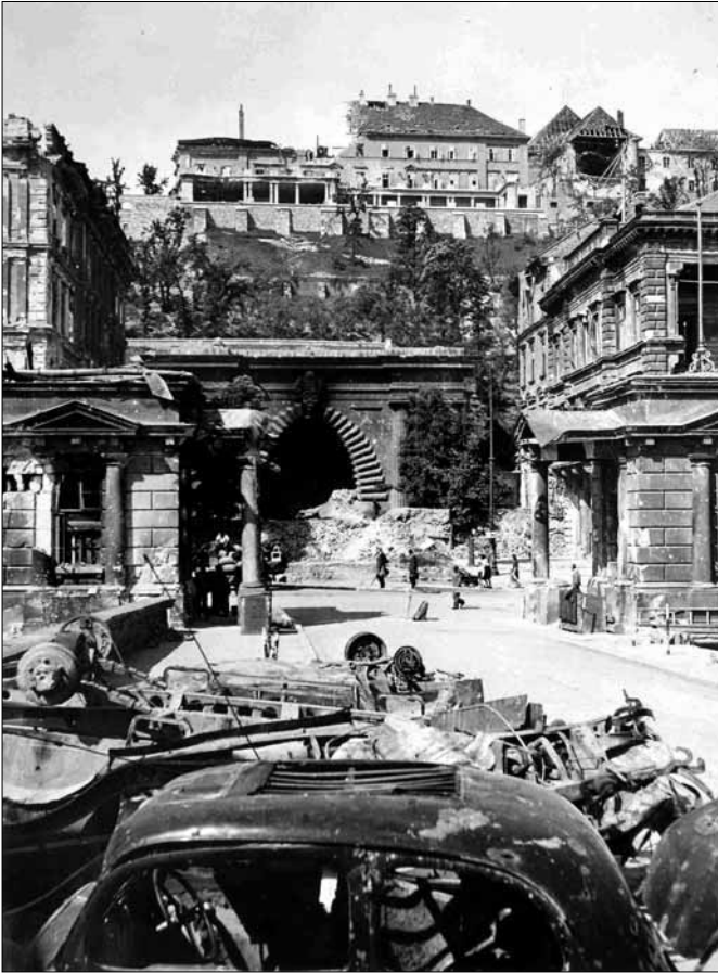
Clark Ádám tér, 1945.