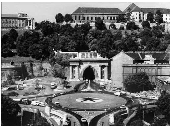
Clark Ádám tér a körforgalommal az épületbontás után, jobbra a Lánchíd presszó, és a Hunyadi János utcai lakóház tűzfalán az Ybl épülethez tartozott architektúra. 1950-es évek. Terv: Scheuer Róbert

lázán elhelyezett idegenforgalmi központ segítené a bámészkodó turistákat. Egyben természetes térelhátarolást és irányt jelezne a Lánchíd – Alagút tengely mentén.