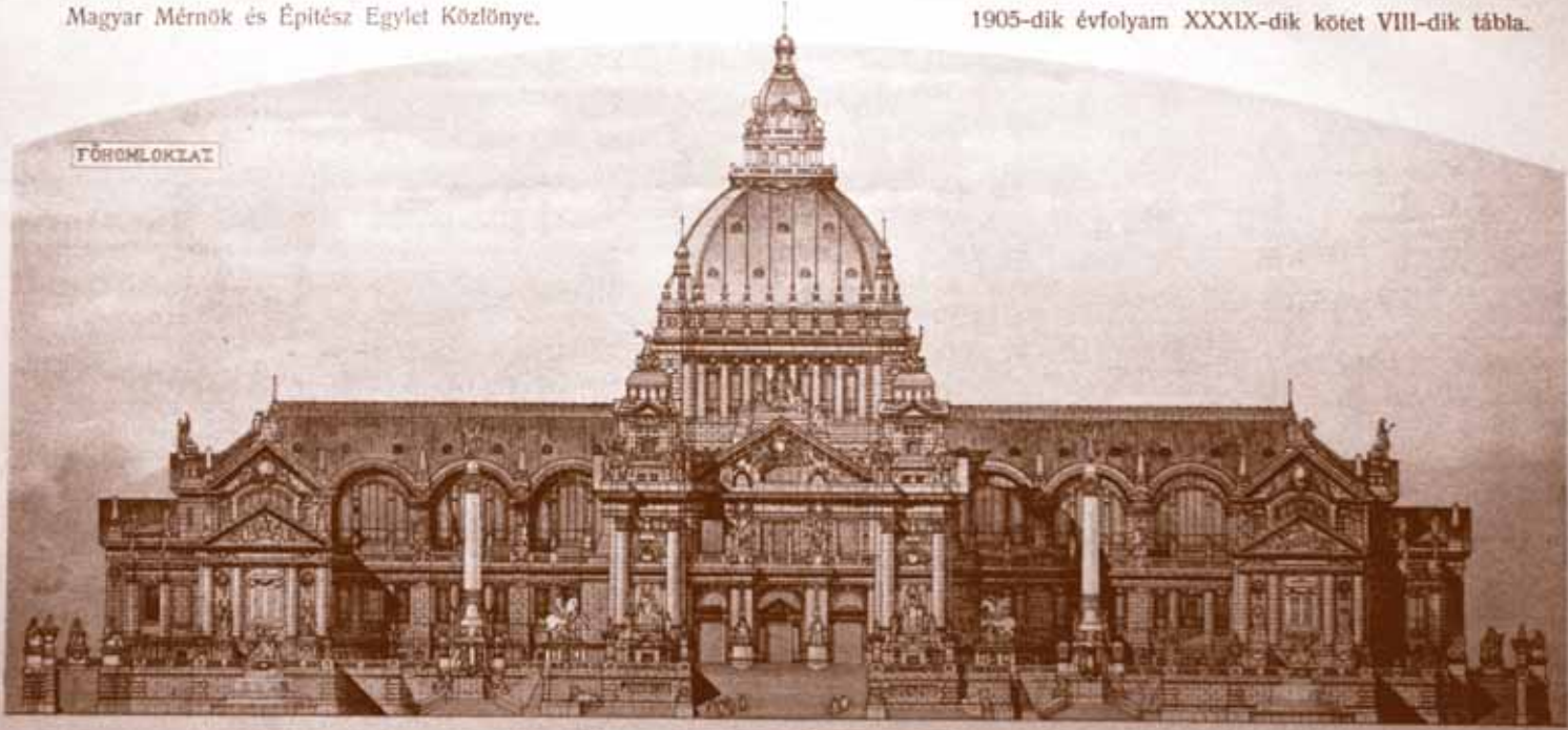
A Lipták Pál tervezte későreneszánsz stílusú építészeti múzeum 1908-ban a Szabadság tér déli végén épült volna fel.