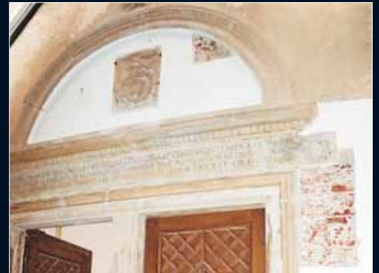
Nyírbátor, a déli kapu (részlet)