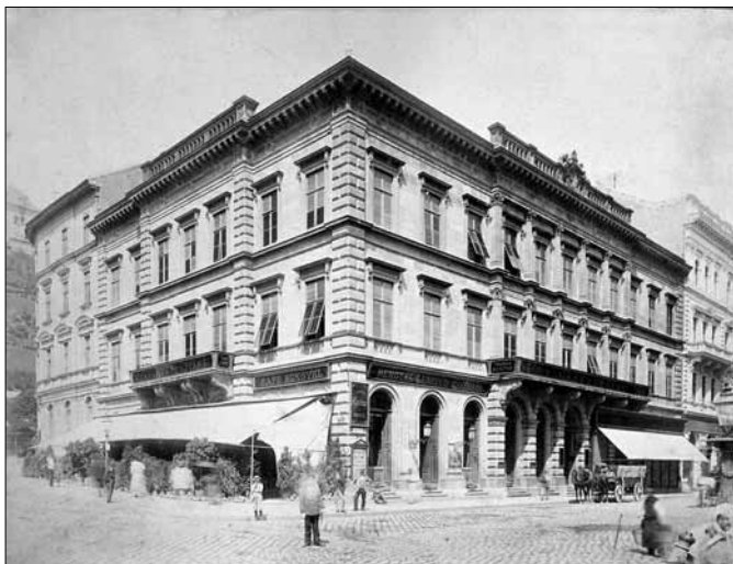
Budai Takarékpénztár, 1862.

működött, a maradék telken kerthelyiséggel, a földszinten.) A rendkívül értékes telek „mellesleg” a fővárosi Világörökség budai oldali területének súlypontja, innen páratlan a körkilátás a Dunára, Pestre és Dél Budára, valamint a rálátás ide, a pesti