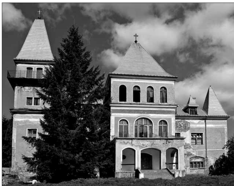
Felsőlugos-Magaslak – Zichy-kastély

A terepbejárásakor a kastélyokról, kúriákról egységes adatlapos felmérések készültek, amelyeknek a digitalizált változatán alapul az épületek részletes feldolgozása.