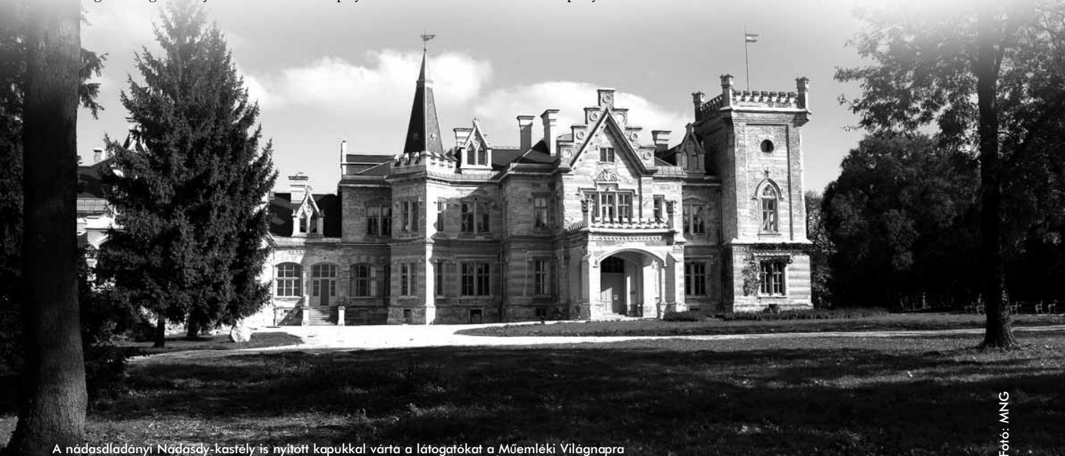
A nadasdladányi Nadasdy-kastély is nyitott kapukkal várta a látogatókat a Műemléki Világnapra

A projekt várható indítása: 2009. második fele.