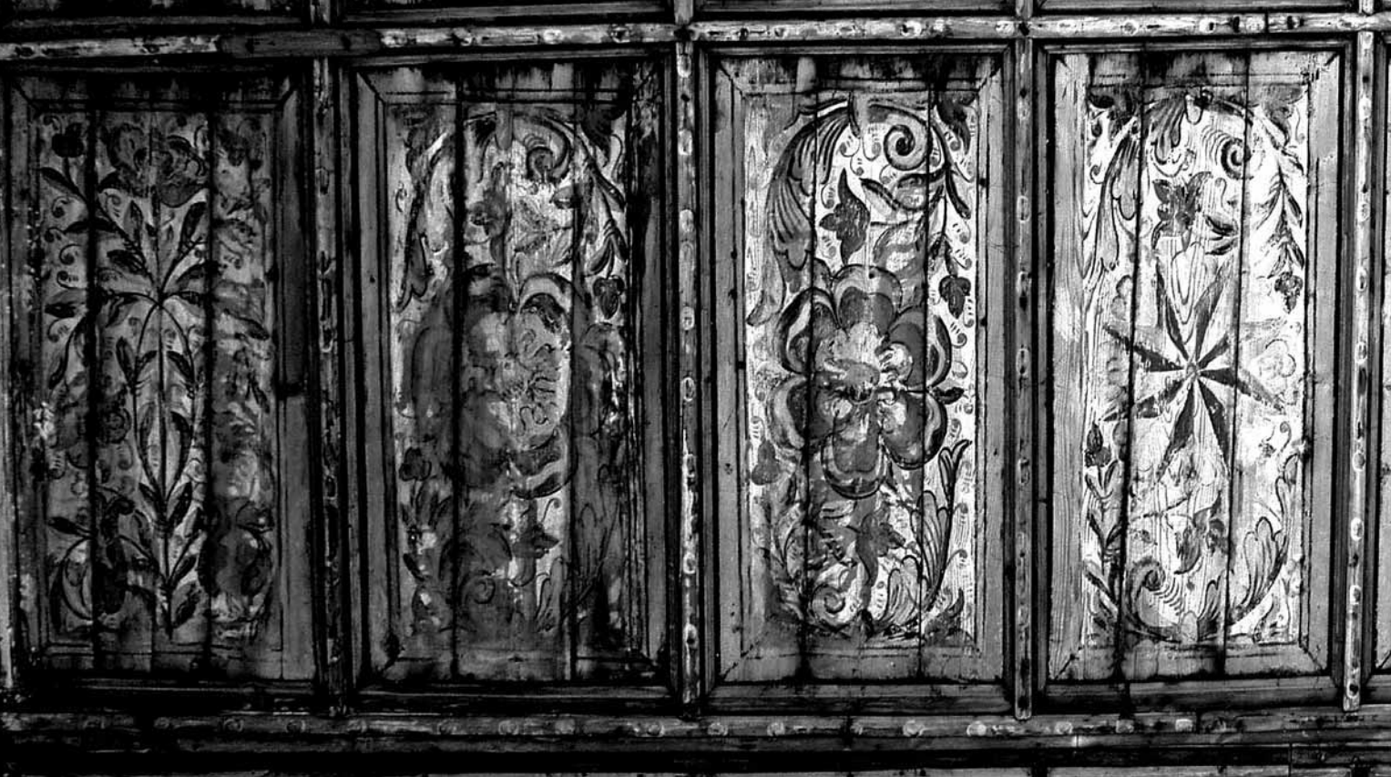
Farcád, mennyezetrészlet – 1629

A 16-17. századdal újabb források állnak rendelkezésünkre – leltári adatok, vagyonösszeírások, leltárak. Természetesen ebben az esetben sem elsősorban a falusi közrendűek épületvagyonáról értesülhetünk, de a felsőbb osztályok épületei között számos olyan van, ami nem tért el a falu átlagától. Az ezekből kibontakozó kép szerint a 17. században részben az előzőben is készült épületek, épületegyüttesek szinte tobzódnak a – gyakran különböző neveken említett – tornácokban. Ezek azonban, többnyire rendkívül szerény kivitelűnek tűnnek, olyanoknak, mint, a csikrákosi 1660-70-es években épült Cserey-kúria tornáca, melyre Balogh Jolán is hivatkozik.