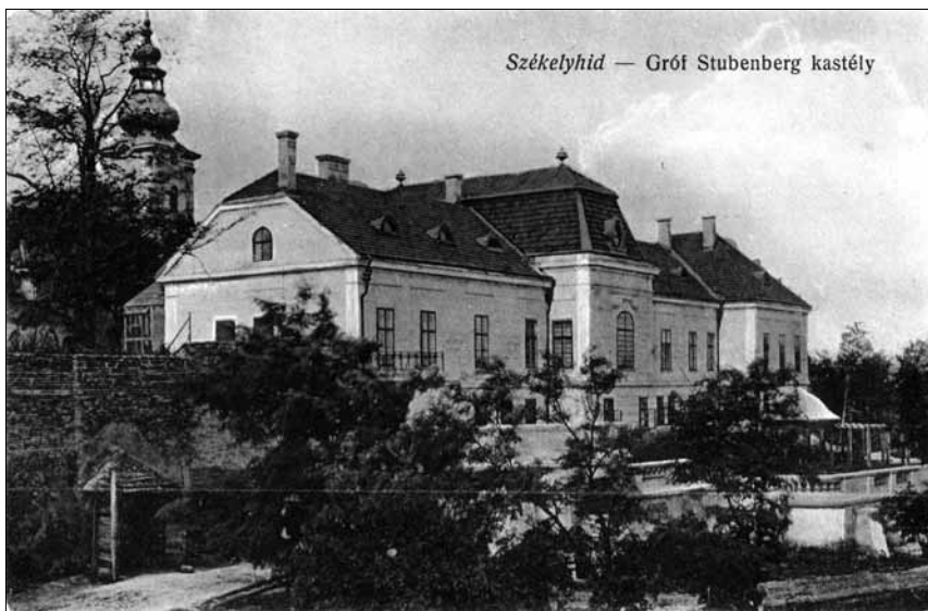
Ma általános iskola az 1906-ban épült kastély

Bihar megye művészettörténeti szempontból legértékesebb kastélyai részben a barokk, részben a historizmus korában épültek. (Érdekes, de a klasszicizmus s a romantikus historizmus korában viszonylag kevés rezidenciát emeltek.) Néhány jelen-