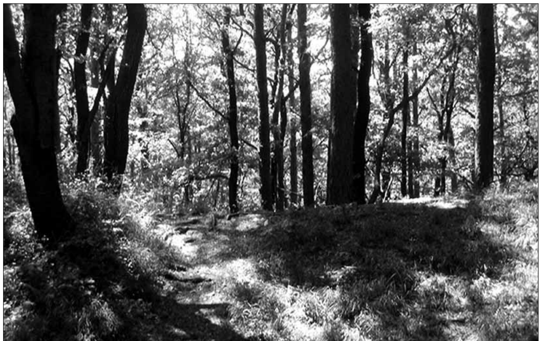
A Várhely sánca

A halomsírmező végigjárása után a Récényi utat keresztező piros háromszög-jelzésen indulunk el kelet felé. Hosszas gyaloglás után a Hét Bükkfa-nevű pihenőhelynél a Z jelzésre rátérve érzük el a Sopron felé vezető műutat. A műút kelet felé a Károly-magaslat irányába ágazik el, majd a Z jelzés is erre az útra tér rá. A gépkocsival is járható út a szomszédos Dalos-hegyen található TV-toronyhoz vezet. Egy keskenyebb aszfaltozott út ágazik le a Dalos-hegyre vezető útról, amely egészen a Károly-magaslatig vezet, de sorompóval lezárták, ezért csak gyalogosan járható. Ez a keskenyebb aszfaltozott út átvágja a hegyen található kora vaskori erődített település viszonylag jó állapotban megmaradt déli sáncát, amely az út mindkét oldalán jól követhető az erdőben, mintegy 100-150 m hosszú szakaszon. Az 1888-1991-ben, majd 1912-ben és 1918-ban folytatott ásatások nemcsak a magaslati település, hanem hét – ma már nem látható – halomsír területét is érintették. A 3. számú halom egyik síri használatra szánt, jelenleg a soproni múzeumban őrzött edényen a várhelyi halmokból ismert urnához hasonlóan bekarcolt jelenetek láthatók: egy harang alakú szoknyás nőalak, lovas, valamint egy szarvast feláldozó (?) alak. A műút végül a 394 m magas magaslattetejére kapaszkodik fel, ahol a Romwalter Károlyról elnevezett kilátó áll. ■