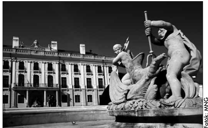
A díszudvar Fertődön

A Műemlékek Nemzeti Gondnoksága e díjmentes látogatási nappal