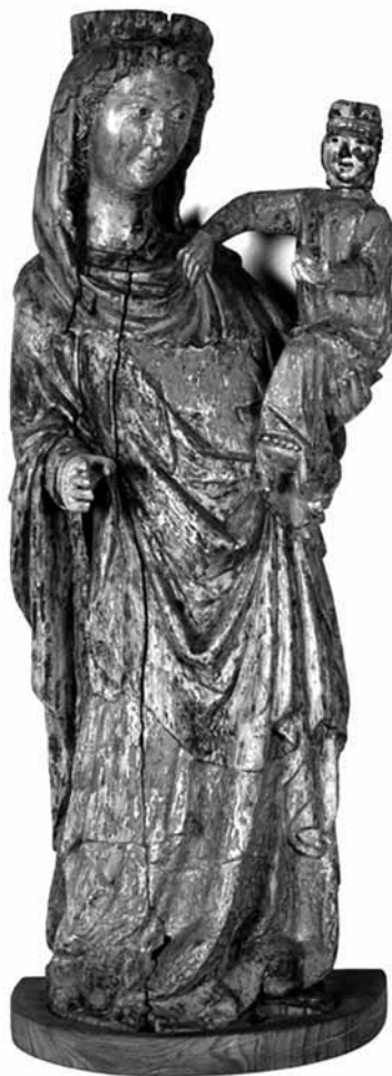
Mária a kis Jézussal Dominikowicéből. Egyházmegyei Múzeum, Tarnow

A gazdasági felemelkedésel egyidőben a városok tárgyi kultúrája is bővült, templomaik olyan berendezési tárgyakkal gazdagodtak, amelyeket ma már nagyértékű művészi alkotásokként tartunk számon.