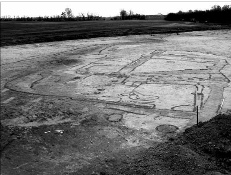
A régészeti feltárás helyszíne

A Kulturális Örökségvédelmi Szakszolgálat Paks határában 2008. április 7-én kezdte meg az M6 autópálya tervezett nyomvonalába