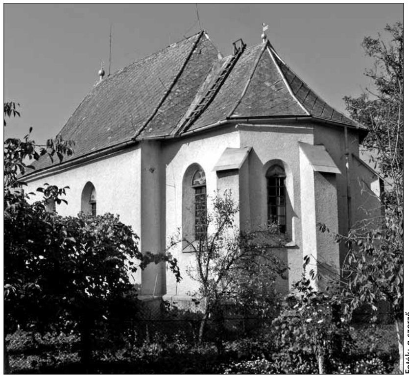
Akli, középkori eredetű református templom

ratori, mind pedig a régészeti kutatások megszervezése és engedélyeztetése nagyon nehézkes. A támogatások megtervezésénél mindezt figyelembe kellett venni, ezért csak olyan beavatkozásokra került sor, amelyek magyarországi és erdélyi szakemberek (építészek, művészettörténészek, épület-diagnosztikusok, faanyagvédők, fa- és falkép restaurátorok stb.) rövid de alapos helyszíni vizsgálatai és jelentései alapján a szakmai szempontok-