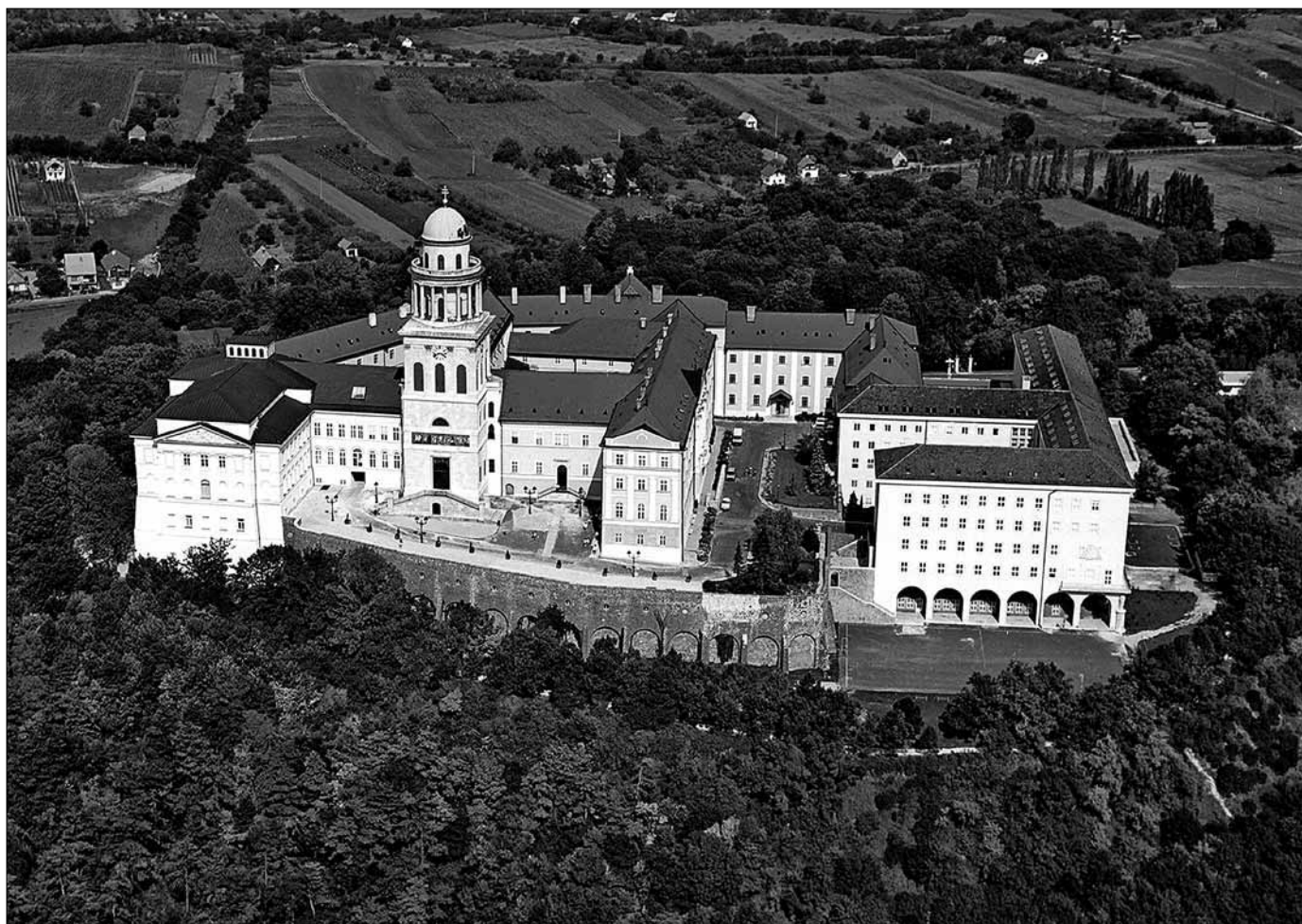
A Világörökséghez tartozó Pannonhalma, a nemzet vallásos kegyhelye

A magyar és a francia példa is azt bizonyítja, hogy a világörökségi helyszínek listájának kialakításában a nemzetépítés logikája működik egy olyan paradigma szerint, amely a 20. század utolsó harmadában fogalmazódott meg, s amelynek intézményesült formája a kulturális örökség. Az elkövetkező években dől el, hogy az említett hagyományos nemzeti tudományok képviselői át-szervezik-e saját tudományaik eszköztárát ezen új paradigma hatására, vagy épp annak tudatos elszigetelésébe kezdenek. ■