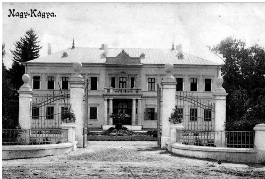
Nagykágya – Pongrácz-kastély

A terepbejárásakor a kastélyokról, kúriákról egységes adatlapos felmérések készültek, amelyeknek a digitalizált változatán alapul az épületek részletes feldolgozása.