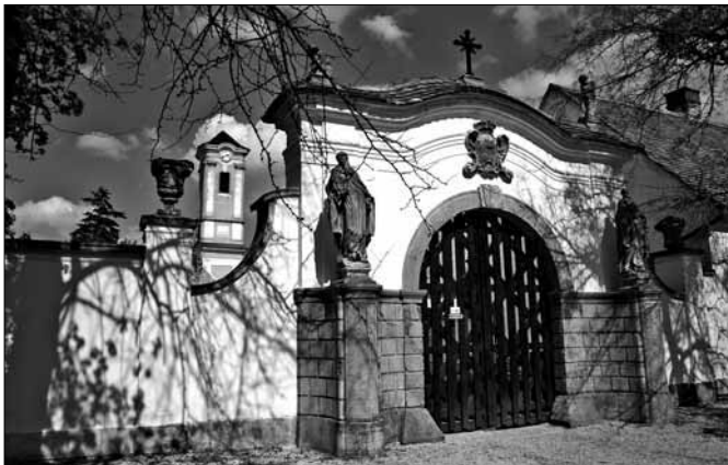
A Kamalduli remetesség kapuja Majkon

Április 18-án a díjmentes látogatási lehetőséggel és idegenvezetéssel várták a Műemlékek Nemzeti Gondnoksága kezelésében lévő műemlékegyüttesek az érdeklődőket. Az idén először meghirdetett akcióban az intézményhez tartozó több mint egy tucat kiemelkedő kultúr-történeti és építészeti értékkel bíró épület vett részt. Az ország nyugati részében a magyar Versailles néven emlegetett fertődi Eszterházi-kastély, a zempléni hegyek közt a reneszánsz világot idéző füzéradványi Károlyi-kastély, a fővároshoz közeli Majkon a fogadott némaságban élő szerzetesek hajdani Kamalduli remetessége, és a középkori angol kastélyok mintájára épített nádasdladányi Nádasdy-kastély várta nyitott kapukkal a vendégeket. Ozorán, a reneszánsz várkastélyok világát idéző Pipó vár, Dégen a szabadkőművesekhez kapcsolódó titokzatos legendáiról nevezetes Festetics-kastély megtekintésére invitálták szintén díjmentesen látogatókat.