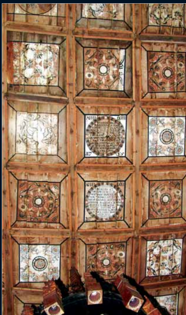
Bánffyihunyad, az 1705-ös mennyezet részlete