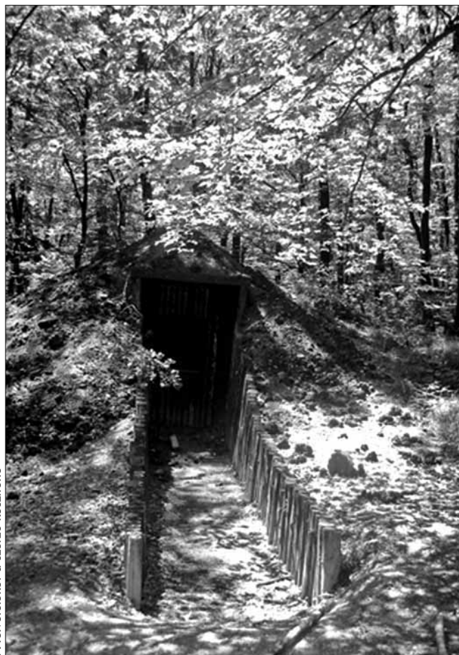
A felvételeket a szerző készítette

A régészek a sűrű erdő miatt a földvár belsejében csak néhány kisebb felületen áshattak. Néhány kisebb lakóház maradványai kerültek elő, amelyeket a Kr. e. 8.-6. századokban használtak az itt élők. A település következő lakóit – több száz évvel később – már a keltákkal azonosíthatjuk. Ők a Kr. e. 2.-1. században