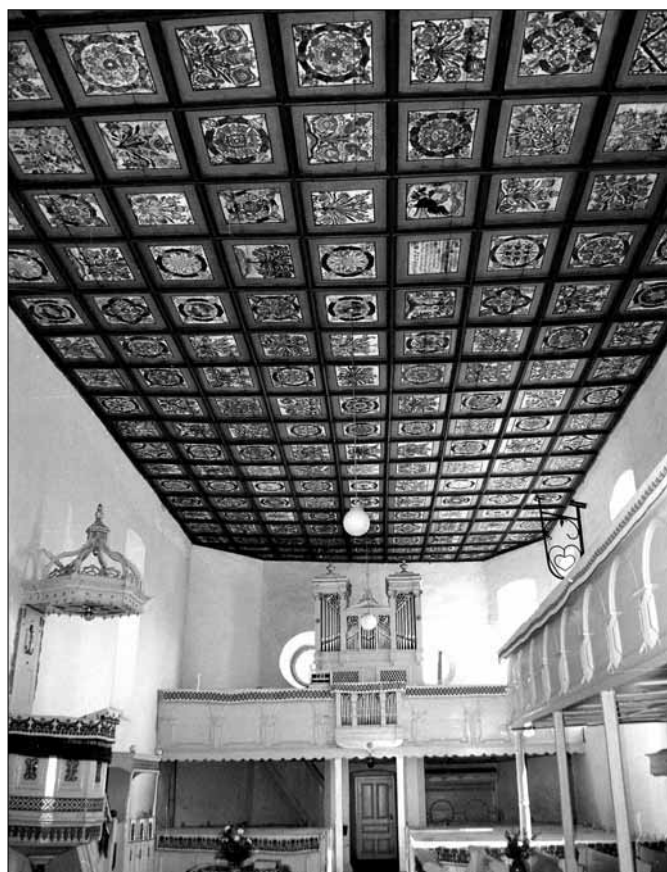
Szilágyosmlyó, a ref. templom kassettás mennyezete – 1737