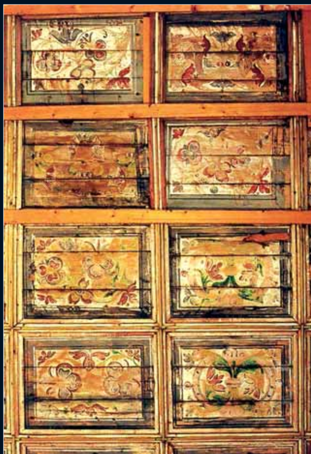
Gyalakuta – kazettás mennyezetrészlet, 1623.