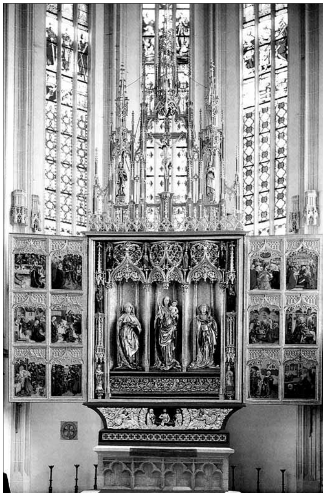
A székesszegyház főoltára