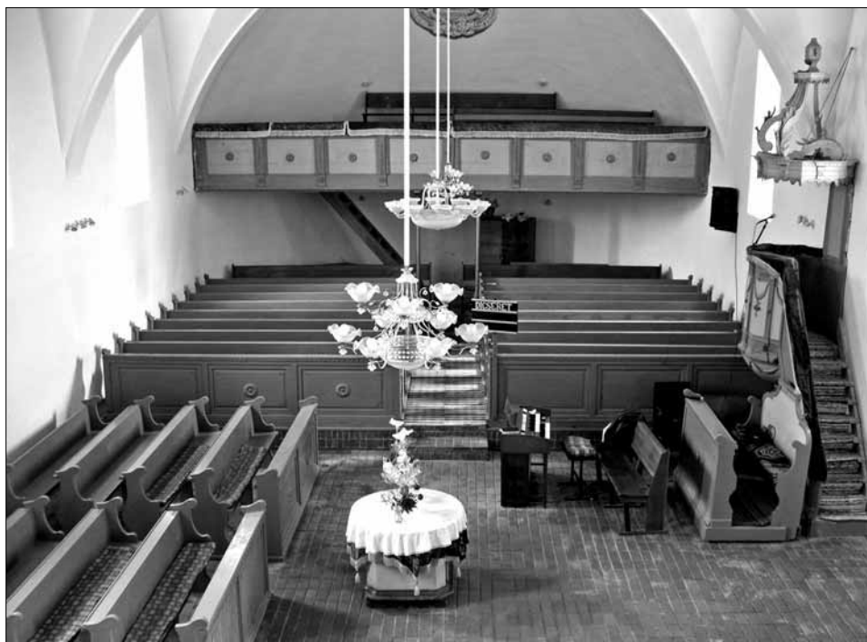
A helyreállított mezőkaszonyi templombelső

juttatta a kárpátaljai műemlékek tulajdonosainak egy részét. Amit azonban egyértelműen sikernek könyvelhetünk el, az a szakmai szempontú megközelítés átplántálása volt. Ezt hangsúlyozta a támogatási programot bonyolító Telesi László Alapítvány minden évben más országban sorra kerülő konferencia sorozata is. A 2005-ben megrendezett konferencia helyszíne éppen a kárpátaljai Visk volt. Eredmény, hogy az elmúlt évben a feladat súlyát átérezve, néhány egyéb alapítványi és pályázati forrást is sikerült e nemese cél szolgálatába állítani. S talán azt is remélhetjük, hogy a füredi konferencián is megnyilvánuló közös szándék nyomán hatékony és európai szintre emelt akcióprogram születik a hátrányos helyzetű térségek ilyen vagy olyan okból elhanyagolt örökségi elemeinek megőrzésére. Addig azonban még, szakmai és szakmapolitikai értelemben egyaránt igen sok a tennivaló. ■