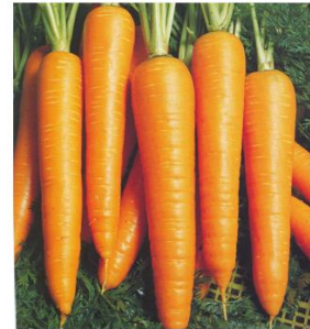
2. ábra: Sárgarépa felhasználási lehetőségei (Takácsné Hájos, 2013)

A sárgarépa fejlődése során a hőmérséklet, a vízellátás és a növénytűrűség gyakorolja a legnagyobb hatást a répatest formájára, színére és méretére (Hraskóné, 2004). Rubatzky és munkatársai (1999) szerint a sárgarépa termésmennyiségére ható legfontosabb környezeti tényező a talaj hőmérséklete. Jó minőségű répatestek 15,5-21 °C-os talajhőmérsékleti értékek között fejlődnek legjobban. Ettől alacsonyabb hőmérsékleten, 15 °C alatt hosszú, megnyúlt gyökerek képződnek, míg 25 °C felett a vállátmérő nagyobb lesz, illetve a répatest nyaki része kiemelkedik a talajból, ami annak zöldülését, egyben a répatest keserű ízét okozza (Ravishakar et al., 2003).