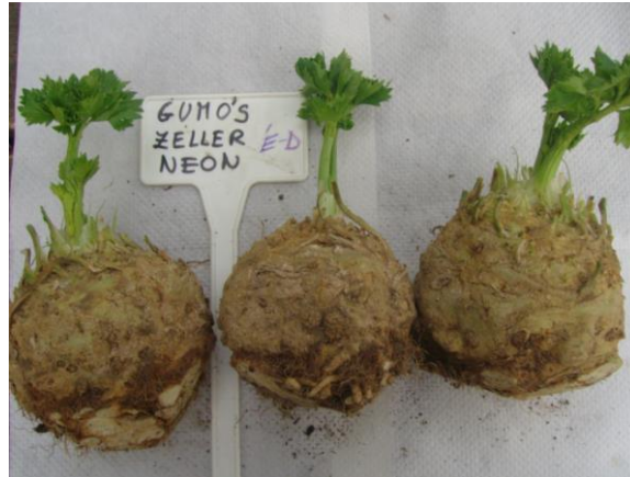
1. kép: Neon zeller-fajta

Ez utóbbinál a levél polifenol-, flavonoid- és szárazanyag-tartalma nagyobb volt az É-D-i soriránynál, minden bizonnyal a lombozat kedvezőbb megvilágítotttsága eredményeként. A Neon -nál a K-Ny-i sorirány mutatott jobb eredményt a lomb beltartalmi értékeire. Ennek ellenkezőjét állapítottuk meg a gumó polifenol , flavonoid és szárazanyag-tartalmának mérésénél. Ennél a soriránynál a D-i napsütés hevítette az ágyást, amelyben a gumók fejlődtek, ami kedvezőtlenül hatott azok fejlődésére.