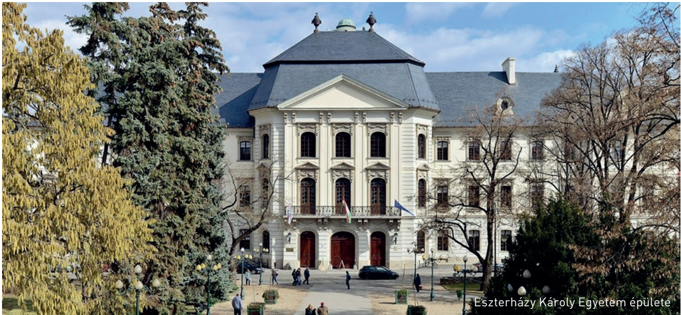
Eszterházy Károly Egyetem épülete