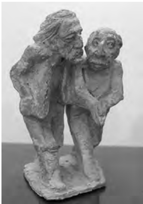
Kós Károly (baloldalt) és Balogh Edgár. 1970-es évek

Hasonló módon hiányoznak a Kós Károlyra vonatkozó források. A neves transzilvanista építész, irodalomszervező és politikus az 1970-es években a Rákóczi (ma General Eremia Grigorescu) út 42. szám alatt lakott, három házzal odébb, mint Balogh Edgár (Rákóczi út 48.). Bár – családi emlékezet szerint – nem látogatták egymást, ám az utcán és rendezvényeken találkoztak. Akkoriban – mivel nagyon kevés személygépkocsi közlekedett – az emberek gyalog jártak Kolozsvárott, így szomszédok lévén gyakorta összefuthattak. A titkosszolgálat utcai megfigyelést is végzett, ezekről a feltételezett találkozókról nincsen leírás, legalábbis eddig nem leltem rá. A titkosszolgálati anyagok alapján úgy tűnhet, mintha a két személy nem is ismerné egymást.