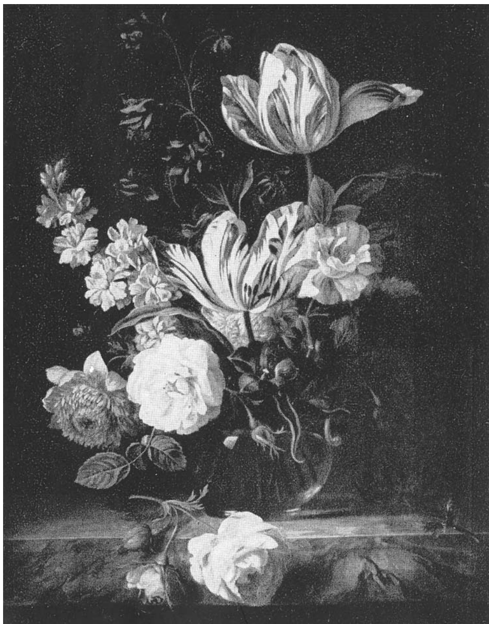
Bogdány Jakab: Virágcsendélet, Magyar Nemzeti Galéria, Nemes Marcell ajándéka 1908-ban a Szépművészeti Múzeumnak