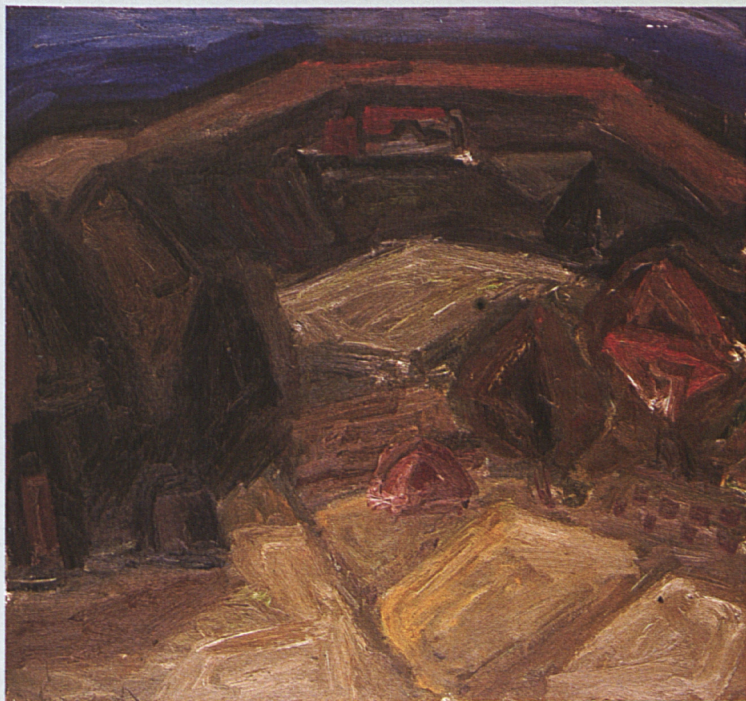
Barcsay Jenő: Őszi táj