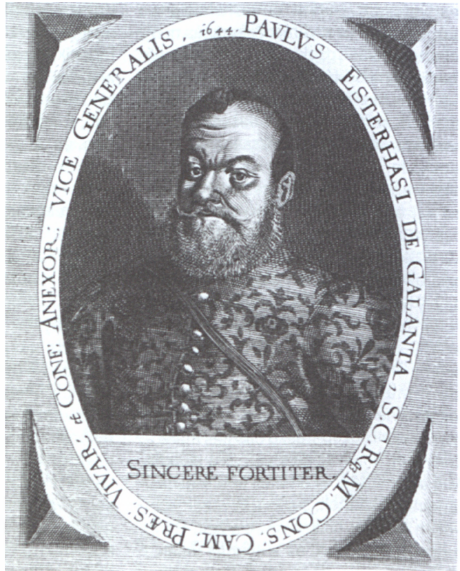
Widemann, Elias: Eszterházy Pál, rézmetszet

Az új épület és a várkastély a múltban is összetartozott. A kiskastély a 17 században a prefektus szállása volt, 1651-ben lakodalmos házként szerepel a forrásokban. A 18. század első felében épült át a fogolykiváltó rend kolostorának és templomának. A helyreállítás eredményeként a múlt egymásra rakódott rétegei, az épület építési periódusai, a legkorábbi rész, a késő középkori lakóépület pincéjének bemutatásával láthatóak lesznek. A terek lehetőséget kínálnak majd ásatási anyag bemutatására, és a késő középkori lakóépület pinceterének élményére is. A kör-