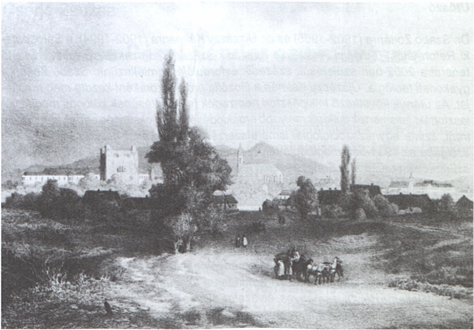
Keleti Gusztáv: Sárospatak, litográfia

határtól – ahova egy kis időre kisétáltunk Szabó Zoltán dr.-ral – visszafelé jövünk, az utcán sétálók közül megismerjük az egyik nyíri embert. Köszönt bennünket ő is. Csendesen jön mellettünk egy darabig, azután kimondja ami a szívéen van: "Mások ezek a pusztafalusiak, mint mi nyíriek. A nyíri nép híres összetartásáról. De a papjuk is más, mint a pusztafalusiaké. A pusztafalusi is derék ember, de éppen a pusztafalusiaknak való. Éppúgy ahogy a nyíri pap a nyírieknek. Finom ember a mi papunk – ezzel köszön el tőlünk – nekünk való!"