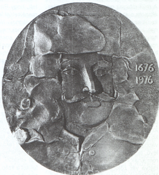
Fritz János: Rákóczi-érem, bronz

alhatták a táj természeti és épített értékeit. Személyesen szereztek benyomást – többek között – a pataki vár szépségéről, művészeti értékeiről, a kulturális turizmusban betöltött jelentőségéről. A