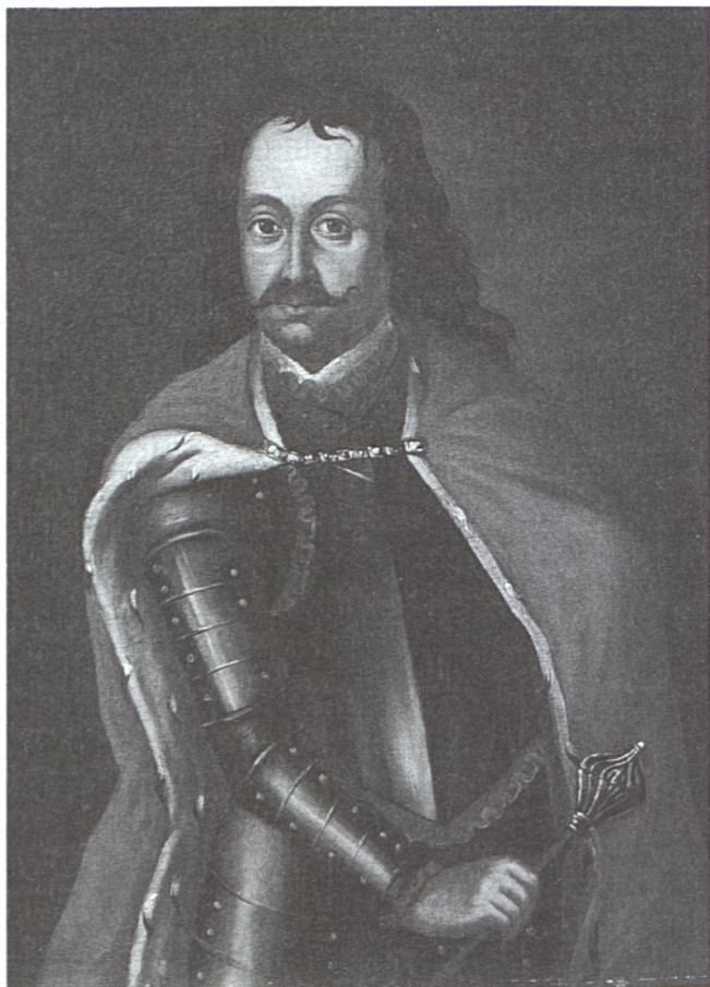
Ismeretlen festő: II. Rákóczi Ferenc portréja