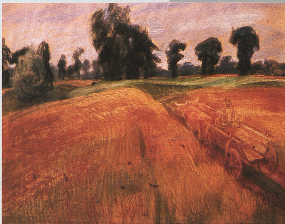
Szobotka Imre: Táj ökrös szekérral