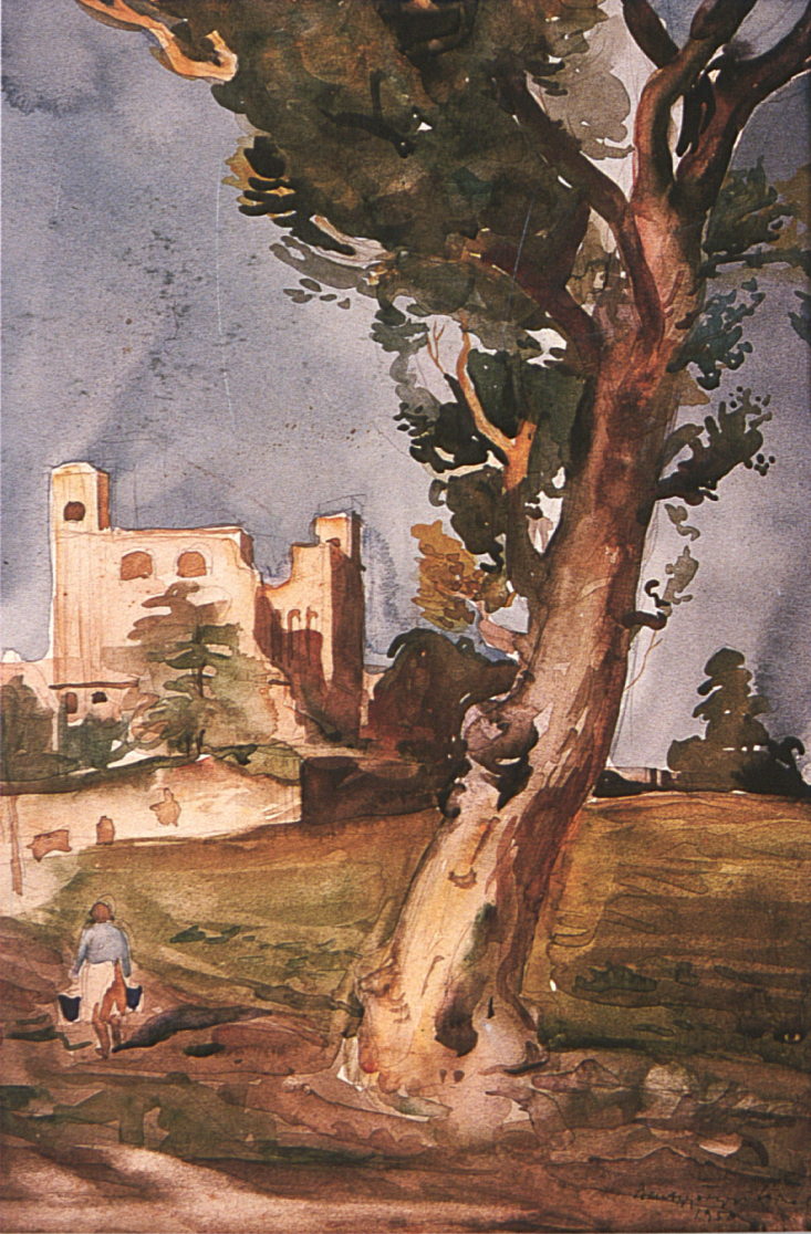
Szentgyörgyi Kornél: Sárospatak - tájkép a várral 1954.