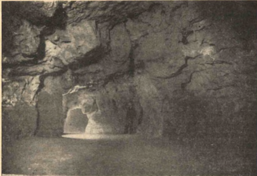
7. kép. A Várhegyi barlang I. szakasz, IX. terme.

körülfalazott kút foglal helyet, az itt időnként összegyűlő talajvíz befogadására. Jobboldalt a közepén pompásan kiépített kőkapun át vezetnek lépcsők a barlang második szakaszába. Az ívelt kapu tetejéről lecsüngő régi lámpás sárgás fénye misztikusan világítja be az egész környezetet. A csarnok mennyezetéről színpalakra emlékeztető, félelmetesen lecsüngő sziklarészeket kerek oszlopokkal támasztottuk alá. A fényszórával megvilágított szép nagy barlangrész felejthetetlen nyomokat hagy a látogató lelkében.