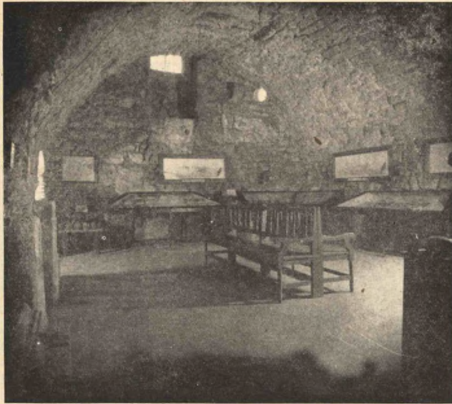
13. kép. A barlangtani gyűjtemény IV. terme.

Látogassuk tehát minél gyakrabban a barlangtani gyűjteményt és terjesszük annak híret ismerőseink és a tanuló ifjúság körében. Felépődíjunkkal mi is hozzájárulunk néhány fillérrel a gyűjtemény fejlesztéséhez. Legyünk azon, hogy a jelenlegi szerény gyűjtemény minél előbb tekintélyes Magyar Barlangtani Múzeummá váljon !