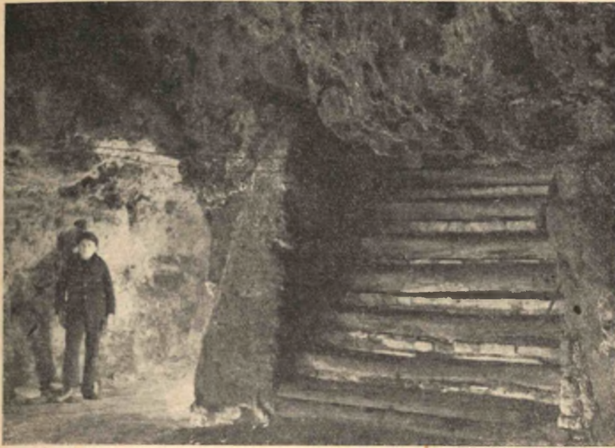
2. kép. Az Uri-utca 32. sz. ház barlangpincéje.

nevezetesen iszap, homok és kavics képezi. Ez nem más, mint a Dúnának őskori lerakódása, ami viszont azt jelenti, hogy a Duna az őskorban a hegyhát magasságában folyt, hullámai a Verböczy- és Fortuna-utca táján volt partján rakta le hordalékát. Mindebből következik, hogy az őskorban a Duna ártere, vagyis a pesti sík a Várhegy magasságában terült el.