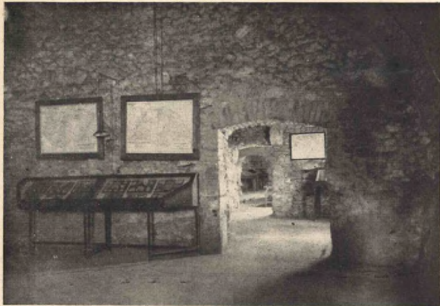
12. kép. A barlangtani gyűjtemény I. terme. Másik részlet.

Ugyanebben a teremben van felállítva az ősember három mellszobra; az egyik a neandervölgyi, a másik az orinyáki, a harmadik pedig a kromanyóni fajta testi sajátosságait szemlélteti. A falakon felüggesztett több festmény az ősember életéből vett jeleneteket ábrázolja. Két kép az ős- és újkőkori ember kőeszközeinek típusait és használati módját, két további kép az ősember mammut-vadászatát és az újkőkori ember barlangelőtti életét mutatja be, számos kisebb kép pedig az ősembernek barlangi rajzait szemlélteti.