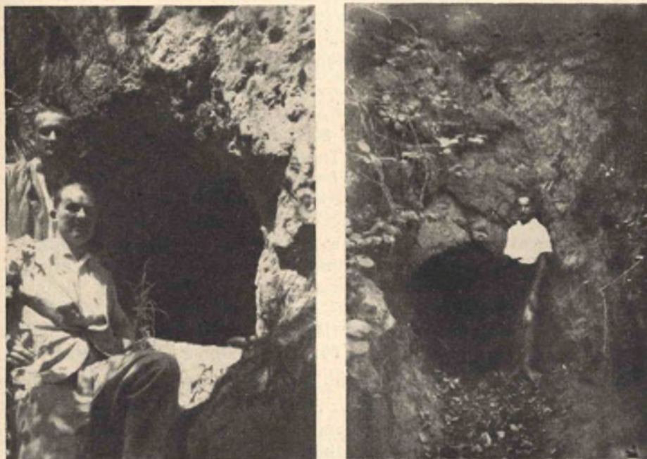
A balatonendrédi Barátlyuk (bal) és a ságvári Betyár-barlang (jobb) bejárata.