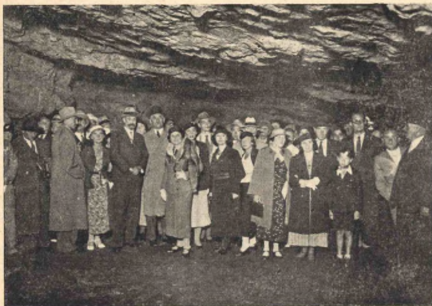
4. kép. A Várhegyi barlang megnyitása 1935 augusztus 17-én.

emeljük, s mint egyedülálló székesfővárosi látványosságot a nyilvánosság legszélesebb köreinek bemutatassuk. Hogy ebből a nagy feladattól eddig mennyit sikerült megvalósítanunk, az a következő fejezetből fog kitünni.