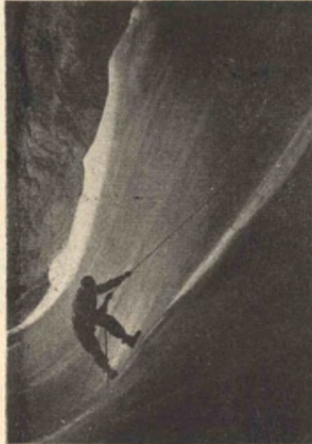
1. kép. A Szilicei jegesbarlang. Nagy zuhatag.