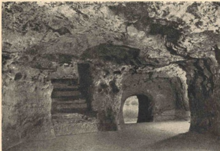
6. kép. A Várhegyi barlang I. szakasz, V. terme.

ket a koponyákat, szembeötlik alakjuk különfélesége, valamint az is, hogy egyik-másik koponyán az erőszak nyoma is megfigyelhető, mely valószínűleg zúzástól és vágástól ered. A terem mennyezetén látható fekete foltok állítólag fáklyafüsttől erednek.