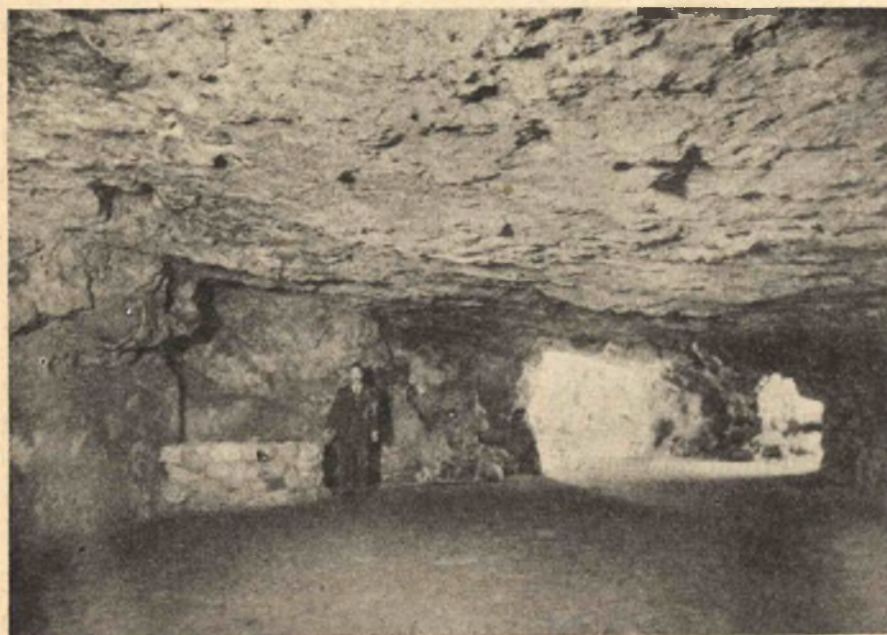
5 kép. A Várhegyi barlang I. szakasz, I. terme.

Az általános ismertetés után, lépjünk közelebb a barlanghoz és nézzük meg egyes részeit úgy, ahogy az a rendszeres vezetés alatt szokott történni. A látogatás kiinduló pontja a Szentháromság-utca 2. sz. alatti kerületi előljáróság épülete lett, mint erre a célra legalkalmasabb közhely. Az előljáróság előtt elhaladó idegennek a szeme megakad a főkapuban kifüggesztett két plakáton, amelyről magyar, német, francia és angol nyelven megtudjuk, hogy milyen körülmények között látogathatjuk meg a Várhegyi barlangot.