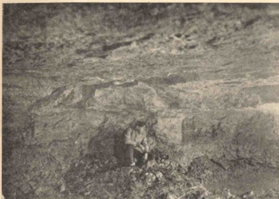
1. kép. A Fortuna-utca 21. sz. ház barlangpincéje.

rajzi szempontból járták be a pincéknek egy részét. Ez az egész, ami műszaki és tudományos szempontból a várbeli törökpincékben végeztek. Azóta sem geológus, sem régész bennük nem fordult meg; csak ujságírók keresték fel időközökben, hogy azokat bejárva, színes közlésekben ecseteljék a bennük látott és átélt borzalmakat.