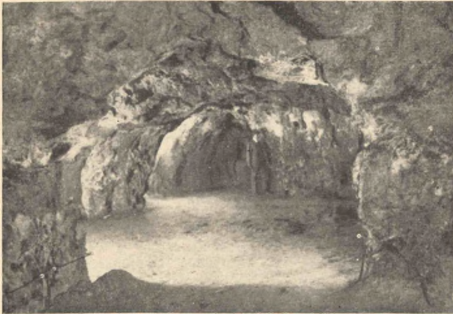
3. kép. A Szentháromság-utca 3. sz. ház barlangpincéje.

A mésztufa lerakódása után, a benne keletkezett repedéseken és hézagokon át, a felszínen összegyülemelő víz a mélységbe szivárgott és annak alján részben oldó, részben pedig vájjó hatásánál fogva, létrehozta a szóban levő m é s z t u f a ü r e g e k e t. A víz itt nagy munkát végzett, mert a Várhegy egész területén, bárhol mélyesztettek lejáratot, vagy légaknát, mindenütt kisebb-nagyobb üregre akadtak. A Vár lakói eszerint biztosra mentek, amikor házaikból a mésztufát lejtős aknával áttörve, sziklaüregre számítottak.