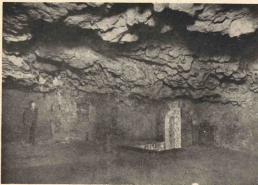
10. kép. A Várhegyi barlang II. szakasz, I. terme.

ilyen magasan folytak. A másik tömbképen azt az állapotot látjuk, amikor a folyó és a patak medrét a jégkorszak idejében jóval mélyebbre vájta és árterét alacsonyabb szintre mélyítette. Az előző ártér maradványai a hegyek lábán magas terraszok alakjában még ma is láthatók. A harmadik tömbkép a hegységet a jégkorszak utáni időszakban, vagyis a mai állapotában szemlélteti. A Duna és a patak árterét ebben az időszakban még mélyebbre süllyesztette, az előző ártér foszlányai pedig alacsonyabb terraszok alakjában maradtak meg.