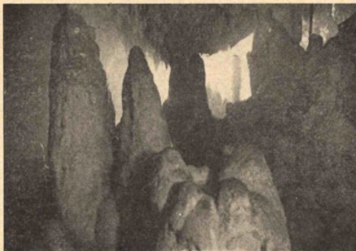
2. kép. Mészhegyi barlang. Hosszú folyosó.

Egy kis keresés után a pataknak egy régibb, jelenleg kiszáradt, járatában mentünk tovább. Egyik szűk, agyagos letörésen ismét rábukkantunk vízére, medre azonban itt is olyan alacsony és szűk volt, hogy tovább semmiképpen sem hatolhattunk. A patakot a barlangban gyönyörű zöldeskék vízű, mintegy 60—70 m 2 területű tó alakjában látjuk utoljára; ezen eddig, mélysége miatt, még senkinek