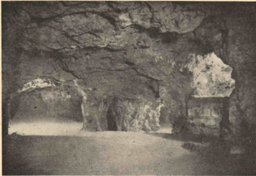
9. kép. A Várhegyi barlang I. szakasz, XIII. terme.