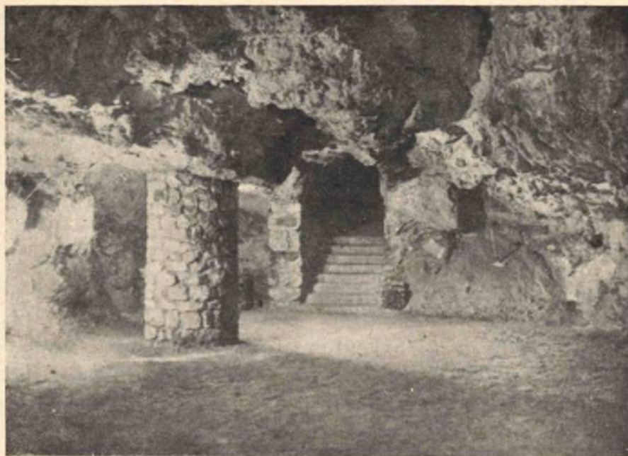
8. kép. A Várhegyi barlang I. szakasz, X. terme.

Az ismertetett nagy terem tulsó falának két sarkából egy-egy kapu vezet hasonló típusú, megnyúlt háromszögű, tág üregbe, a III. t e r e m b e. Ennek mennyezetét is négyszögalakú pillér támasztja alá, mellette széles akna visz a magasba. E terem egyik fala mellett deszkaállványon régi építőtégglák gyűjteménye van kiállítva. Ezeket az előjáróság mérnöki osztálya gyűjtötte össze a Vár területén.