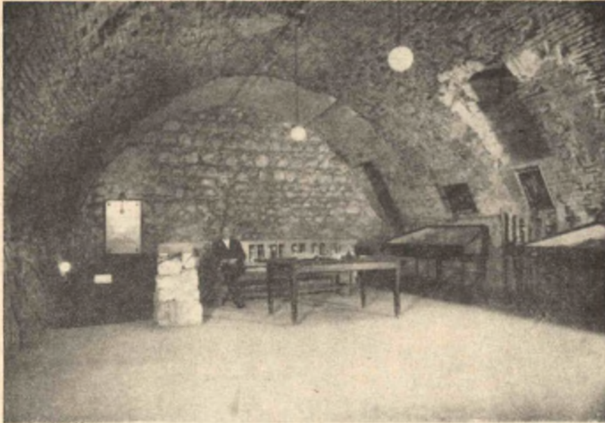
11. kép. A barlangtani gyűjtemény I. terme. Egyik részlet.

A terem tulsó oldalán vannak nagyobb vitrinben kiállítva azon jégkori emlősök csontmaradványai, amelyeket az Óbuda fölötti T á b o r h e g y i s z i k l a ü r e g feltárása alkalmával gyűjtöttünk. Főben az állattársaságban képviselve van különösen a vadló, a gyapjas orrszarvú és a gimszarvas. Mindezeknek a fajoknak jelenléte a nevezett sziklaüregben arról tanuskodik, hogy abban az időben, amikor azok itt éltek, Hazánkban hideg éghajlat uralkodott.