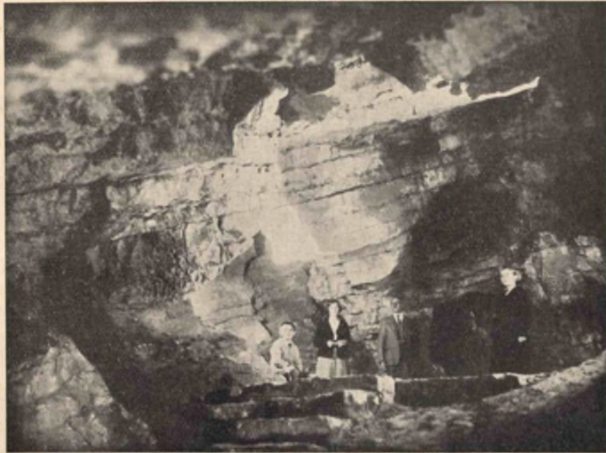
Lóczy — barlang.