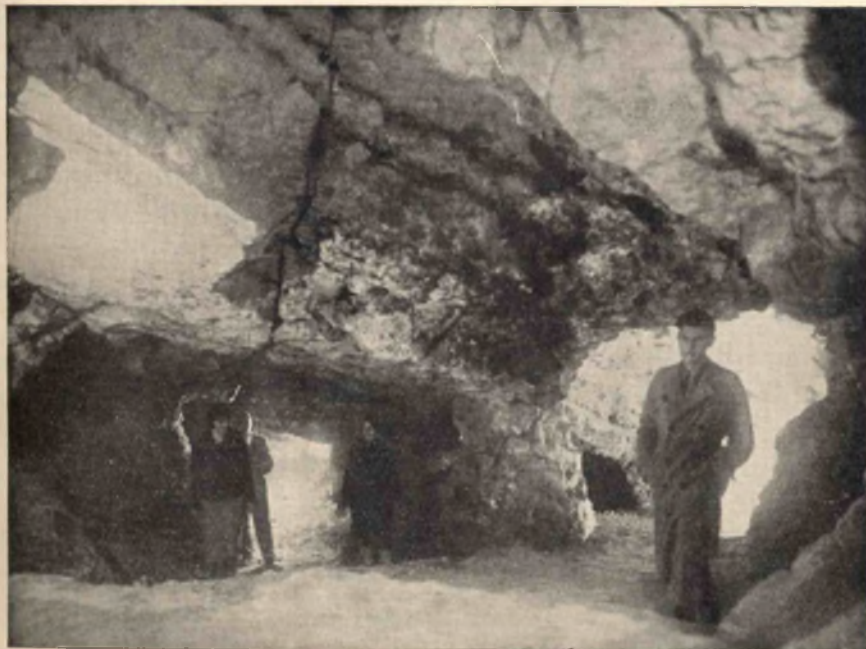
Lóczy — barlang.