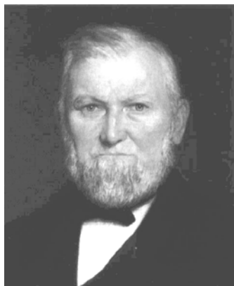
6. ábra: Wilford Woodruff