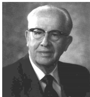
10. ábra: Ezra Taft Benson