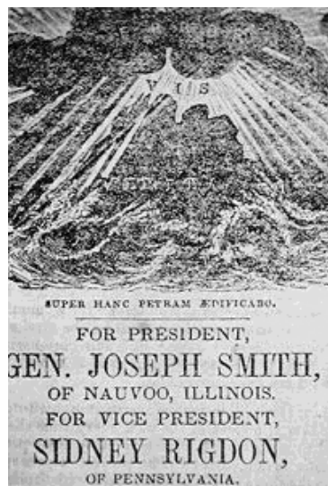
4. ábra: Joseph Smith választási plakátja