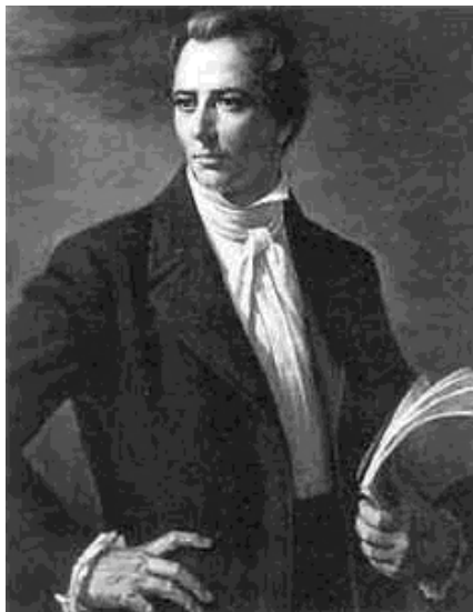
1. ábra: Joseph Smith Jr.