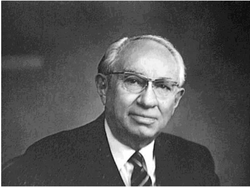
11. ábra: Gordon B. Hinckley