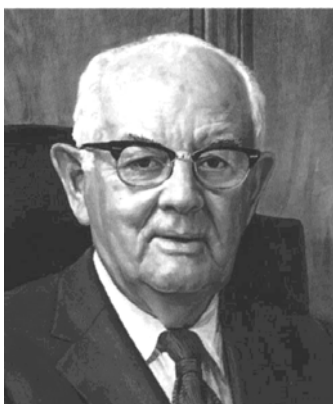
9. ábra: Spencer W. Kimball