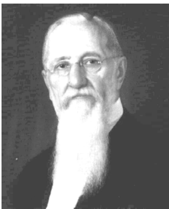
7. ábra: Joseph F. Smith