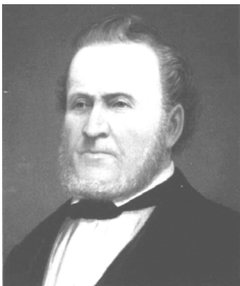
5. ábra: Brigham Young