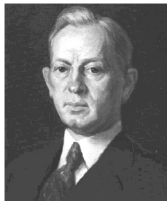
8. ábra: Joseph Fielding Smith