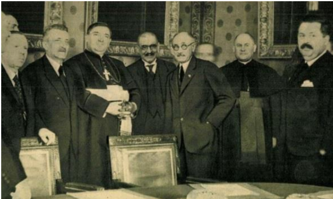
Ruszin küldöttség Sztojka Sándor püspök vezetésével Budapesten. 58