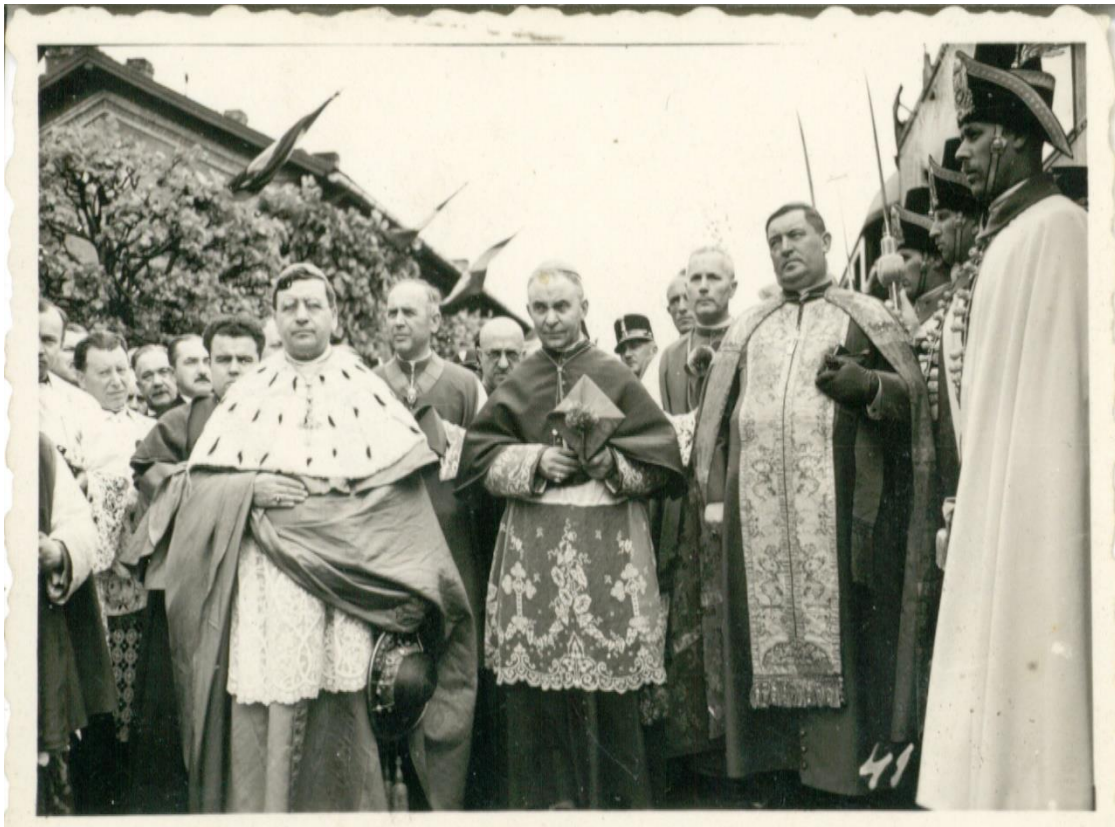
Serédi Jusztinián esztergomi érsek, Angelo Rotta pápai követ és Sztójka Sándor püspök Ungváron 1939. május 14-én. 64

Ugyan 1939. július 7-én polgári közigazgatás lépett életbe, a tisztviselők – elszórtan igaz – de továbbra is gátolták a görögkeleti vallásúak szabad vallásgyakorlást. Ez azonban inkább betudható a helyi magyar közigazgatásnak, mintsem egy budapesti központi akaratnak. 65 1939. szeptember 23-án Hóman Bálint vallás és közoktatásügyi miniszter kifogást emelt Keresztes-Fischer Ferenc belügyminiszternél a magyar közigazgatás pravoszlávellenes magatartásával kapcsolatban: „Ismételt panaszokból aggodalommal látom, hogy Kárpátalján a közigazgatási hatóságok (szolgabírók, jegyzők, csendőrök) részéről a görögkeleti lelkészek és hívők gátolva vannak vallásuk szabad gyakorlásában és hitükért üldöztetésnek vannak kitéve.” 66 Arra is felkérte, hogy azonnal utasítsa a helyi magyar közigazgatást, hogy ne zaklassák a görögkeleti híveket és „az államszó legfőbb felügyelete alá tartozó görögkeleti egyház vallásgyakorlatába