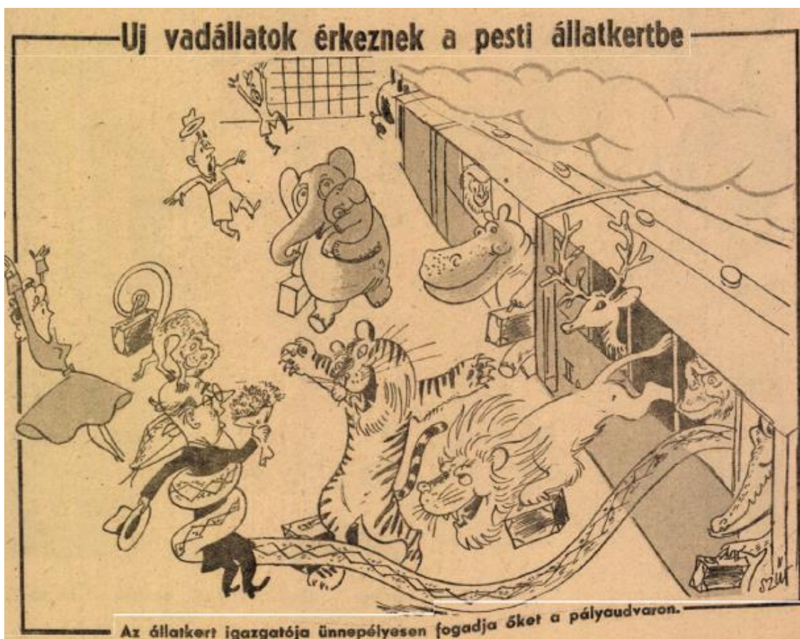
Ludas Matyi, 1949. március 18-i szám.

Károlyi Józsefet is csak elvétve említették meg a napisajtóban, róla azonban még egy karikatúra sem született. 216 Az államosított üzemek élére kinevezett munkásigazgatók létét mind a Rákosi-korszakban, mind a Kádár-korszakban a szocialista gazdaság kiépítésének egyik legfőbb elemének tartották. 217 Így az sem számított kirívónak, hogy az állatkertet munkásokból lett igazgatók vezették. Azonban az ötvenes évek második harmadára a városligeti zoológiai és botanikus kert esetében a főváros döntéshozói közel nyolc év után belátták, hogy csak tudományosan képzett, gyakorlati szaktudással rendelkező igazgató tudja felvirágoztatni és a természettudományos ismeretterjesztéséhez szükséges színvonalra emelni az intézményt. 218