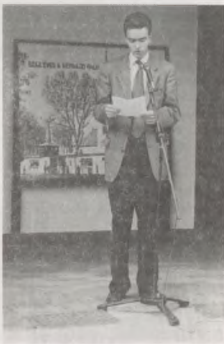
Habsburg György a kiállítás megnyitóját tartja

A kiállítást 1996. május 2-án nyitotta meg HABSBERG GYÖRGY – ugyanazon a napon, amikor az Ezredéves Kiállítást, s benne a Néprajzi Falut FERENC JÓZSEF, Magyarország királya megnyitotta.