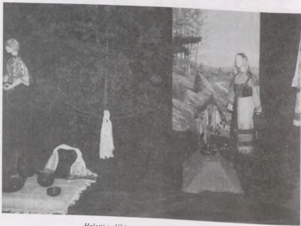
Halotti emlékűnnep a balti finneknél temetőjében