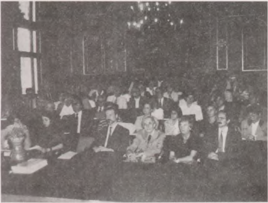
A közgyűlés résztvevői