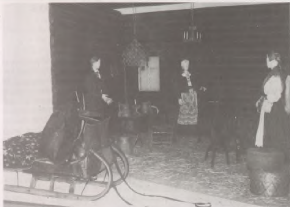
Karácsonyi álarcos alakoskodók érkezése egy észti családhoz