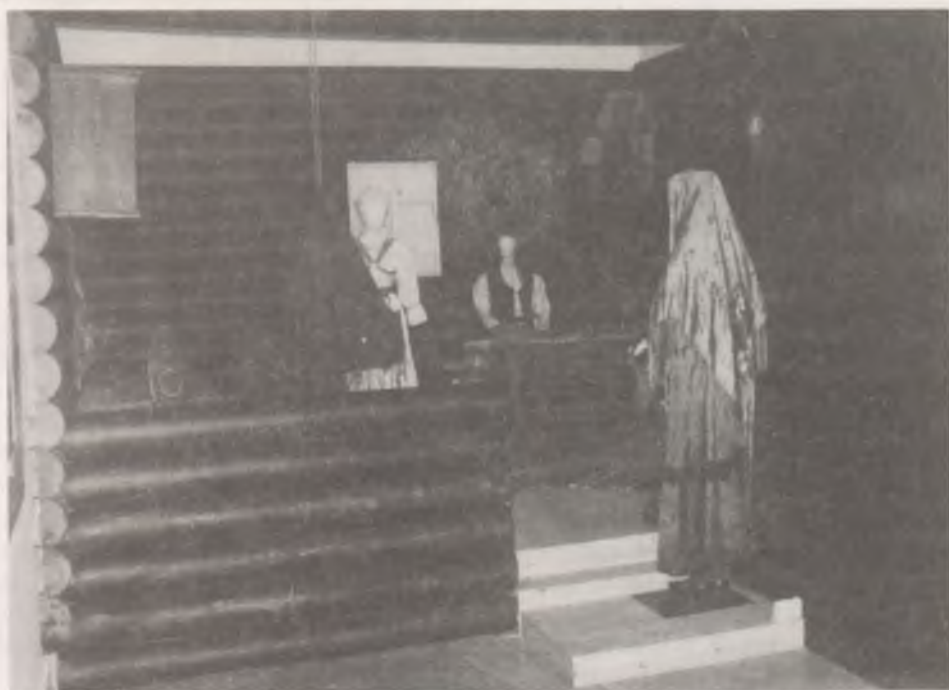
Komi házbelső, előtérben az újszülöttet meglátogató asszonnyal