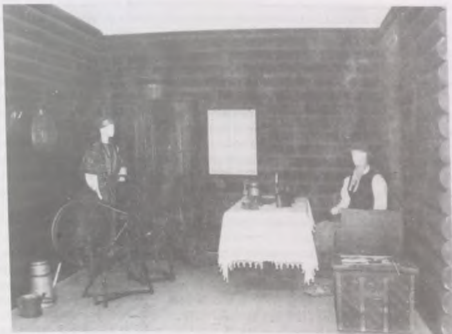
Finn szobabelső