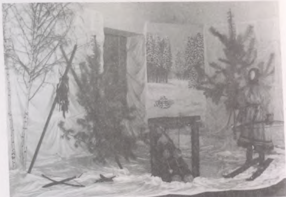
Obi-ugor vadász, mellette zúzócsapda és kisebb önlövő szerkezetek