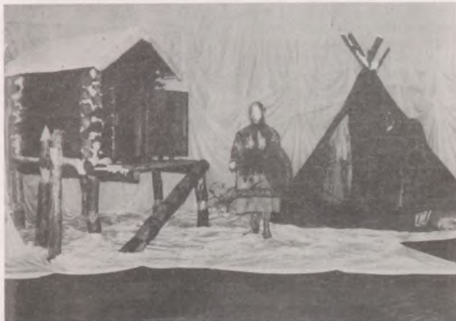
Hanti sámán a bálványházikó előtt, mellette medveünnepet tartanak a sátorban