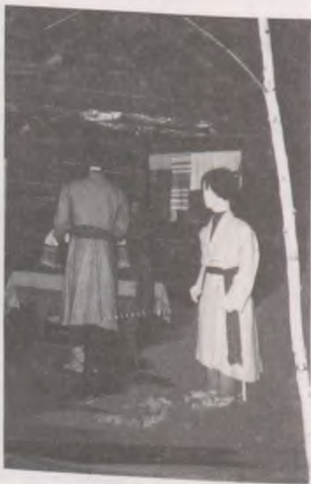
Udmurt áldozati szertartás a kualában