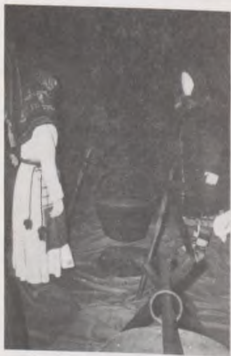
Északi és déli udmurt népviselet