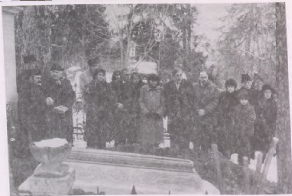
A család búcsúzik Kós Károlytól

A néprajz mint viszonylag új tudomány könnyen fogadott be egymást váltó divatos elméleteket. KÓS KÁROLY nem vált rabjává sem divatos szavaknak, sem divatos módszereknek. De tisztelt minden, a világból bárhonnán érkező újító szándékot, és kipróbálta a sokat ígérő elméletek teherbíró képességét.