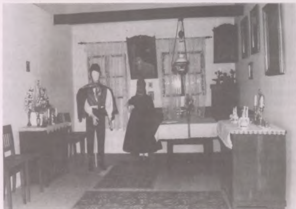
Kapuvári szobabelső