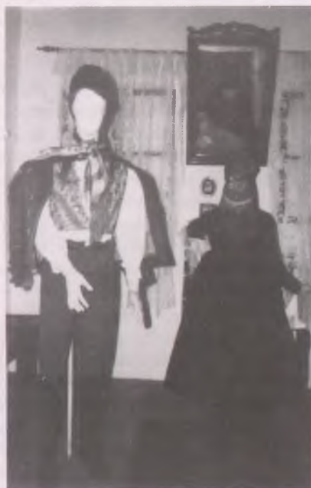
Templomba induló kapuvári pár ünnepi viseletben