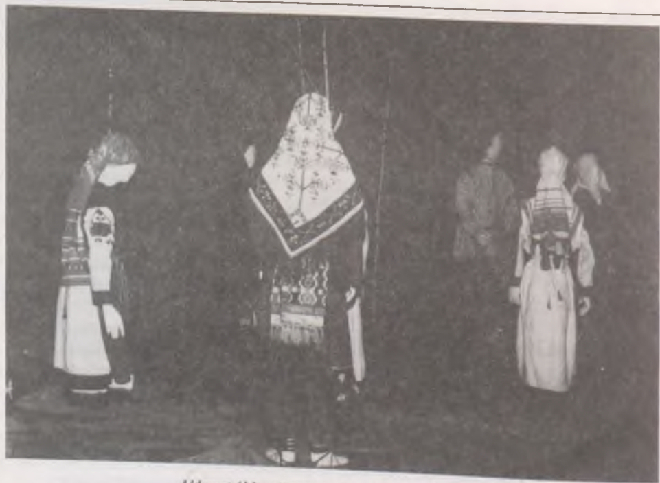
Udmurt áldozati szertartás a szent ligetben