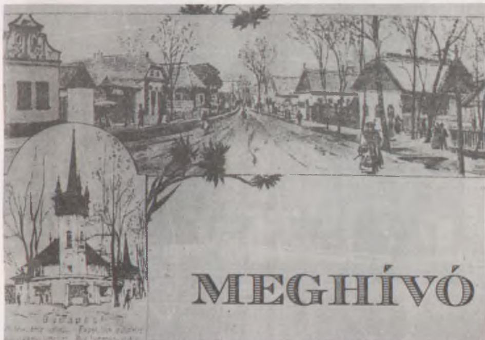
A kiállítás meghívója a millenniumi Néprajzi Falu képével

A kiállítás gerincét a millenniumi Néprajzi Falu megvalósítását bemutató egység képezi. A látogató összefoglaló tablón általános tájékoztatást kap a munkálatok kronológiájáról, lefolyásáról, majd fotók és iratok szemléltetik a gigantikus vállalkozás egyes állomásait. Néhány jól kiválasztott objektum fókuszba állításával (mint a büdszentmihályi és csongrádi ház) különösen jól követhető az épület-kiválasztástól a megvalósulásig tartó munkafolyamat. A dokumentumokból megismerhetjük a házakat kiállító megyék szempontjait, állásfoglalását