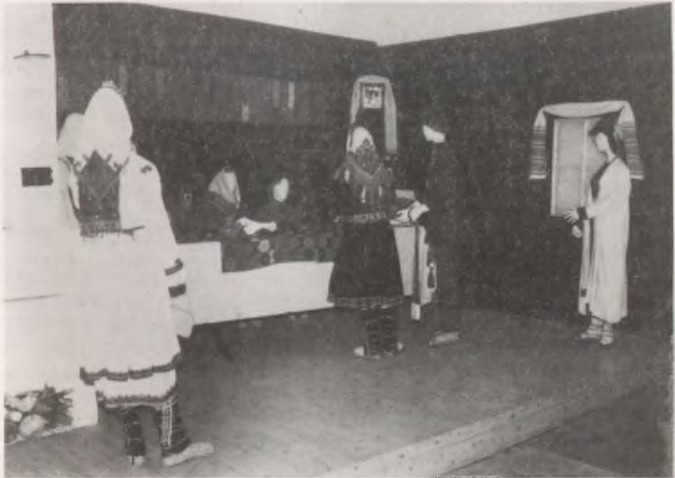
Mari esküvői szertartás