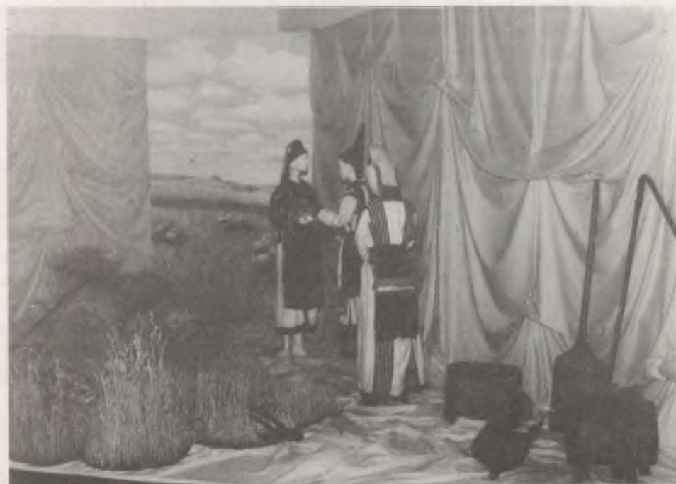
Mordvin aratóünnep, előtérben a hagyományos mezőgazdasági eszközökkel