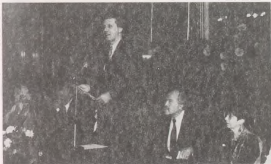
Magyar Bálint művelődési és közoktatási miniszter a kiállítás megnyitóját tartja