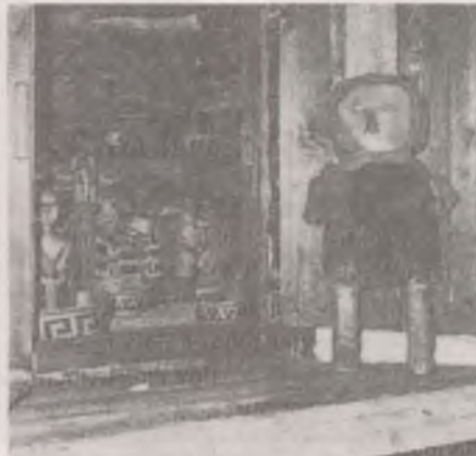
Hanti segítő- és védőszellemek figurái