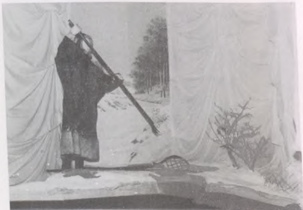
Lékes halászat szigonnyal az obi-ugoroknál