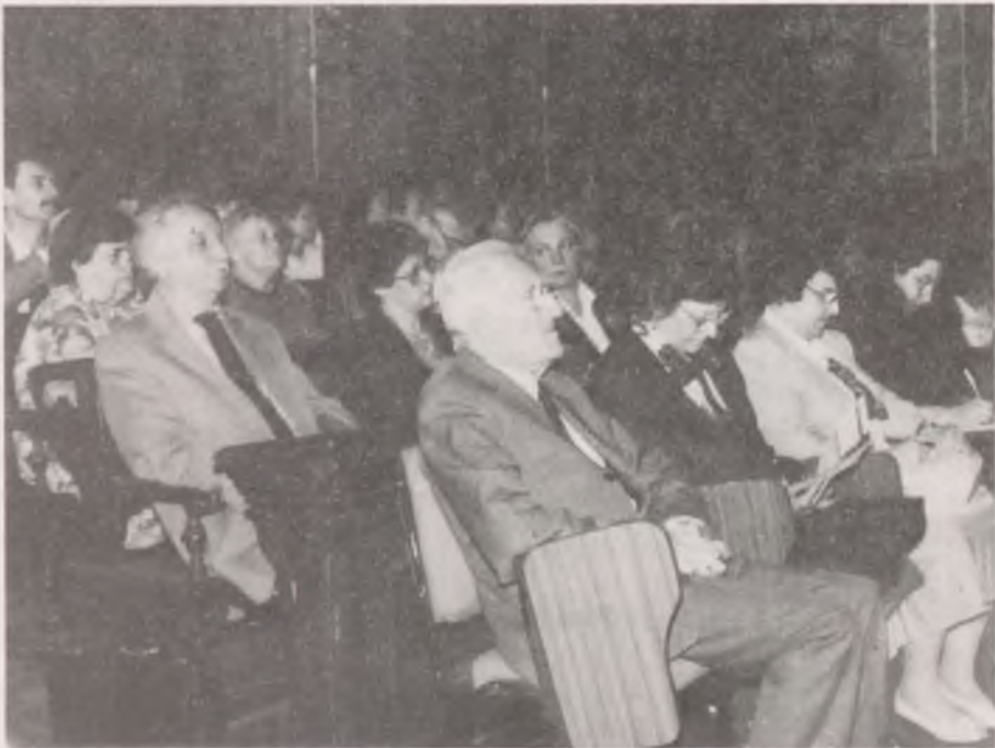
A közgyűlés résztvevői