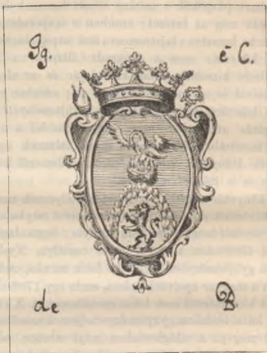
Gróf Batthyány Ignác könyvjelzője.

A példányok szépsége, a tetszetős, bár egyszerű kötések jó izlésű könyvbarátra vallanak. A minden