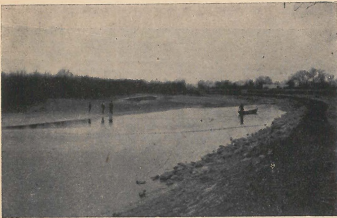
A beverés .

A halászás a következőképen megy végbe: csendben megérkezve a tanyára, kiszáll a laptáros a kisapatyú kötelével a part közelébe levő sekély vízre, a hálókitevő pedig kirakja a hálót a vízbe, úgyhogy az ólmos része alul legyen. A csónakon egy vágós-ember és a halászmester evetik. Félkörben kerítik el a halászhelyet. Ha a víz nem nagyon széles, akkor a tulsó partig kerítenek vele, ahol a háló vége a nagy-apatyúban végződik. Innét köteleket eresztenek (nagy-alattság) a vízbe, amíg arra a partra kijutnak, ahonnan kezdtek a kerítést. Itt két ember kiszáll a partra, a halászmester pedig elmegy a csónakkal « beverni », vagyis a halakat terelni a csörgős csákyával a háló felé a víznek szabad részétől, a tanya legfelső szélétől. Mikor közelbe ér,