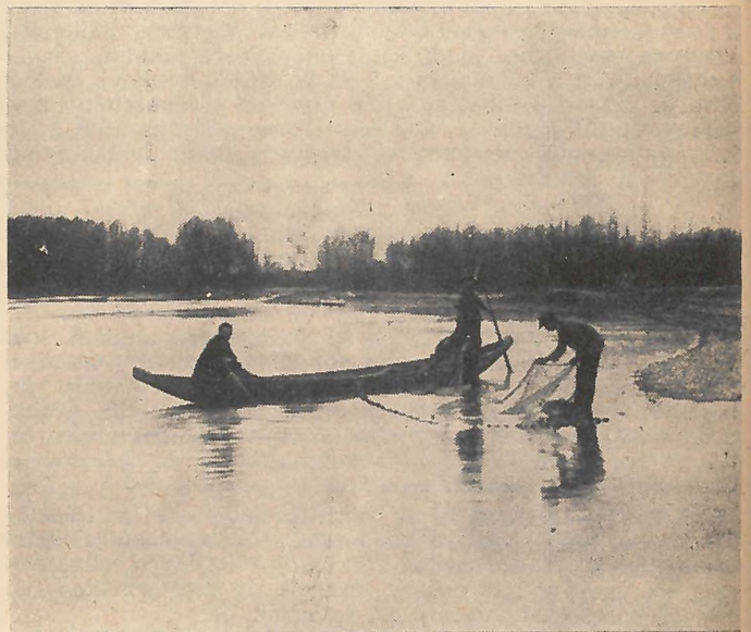
A háló kimosása .