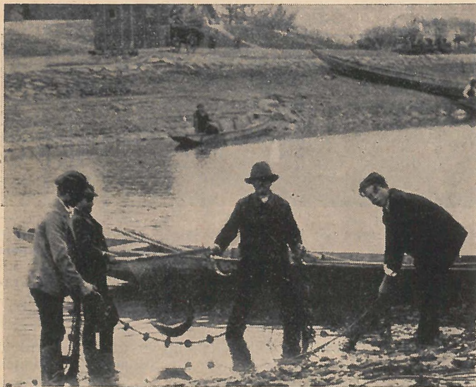
A zsákmány .

a két halász a laptáros segítségével gyorsan áthúzza az öreg-apatyús véget a kiszedő partra, azután « hókkán » (=lassan) az egyik halász (rendesen a mester) a « jölél », másik kettő pedig az inát húzza a partra. A laptáros tartja a szakot a háló mellett, amibe a kifogott zsákmány azon részét teszik, mely szedés közben került kézre. A hálót félkörben húzzák ki. Előbb az öregapatyús végét szedik ki, addig, míg a « szakkarni » nevű részhez nem jutnak. Ekkor kezdik szedni az óbakandlit vagy földhálót is, ha mélyebb a víz, vagy nagyobb volt a tanya. Legutoljára jön ki a kiszedőháló vagy szakli. Ebben van a zsákmány . Innét