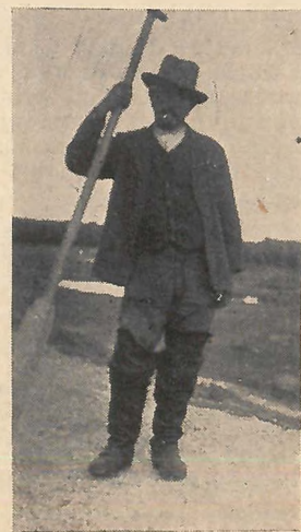
Halászmester a sarukban .