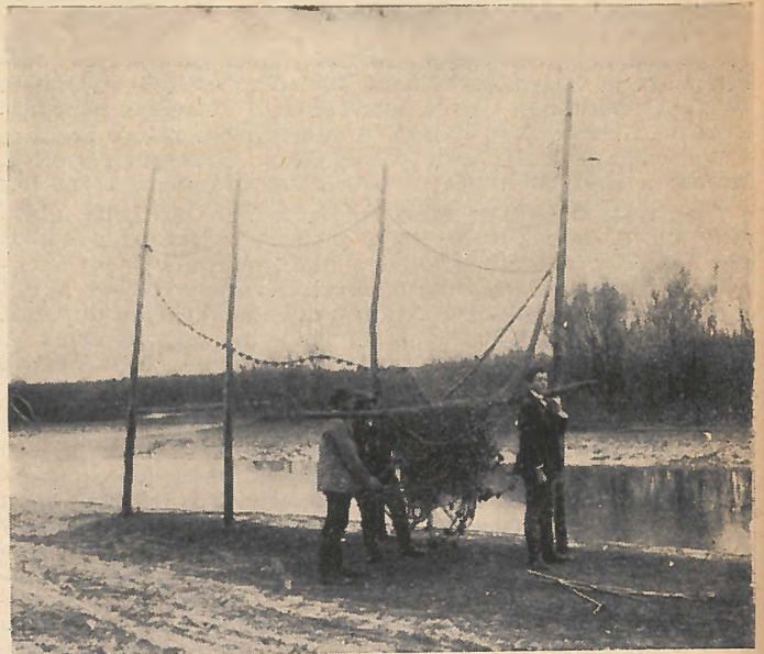
A háló jölakasztása .

azután a szakba rakják s ebből a hegyesbárkába s így szállítják haza. Ha nagy a fogás, nem fér el a hegyes-