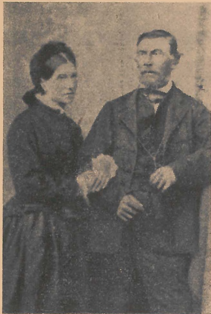
A Céhmaster és a felesége.

Csallóköz halászata ma már végnapjait éli. Nemsokára el is pusztul. Az idők hozzák ezt magukkal. A halászok