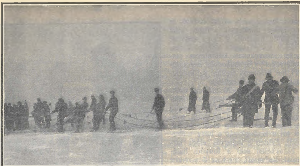
A kihúzónál cibékkel húzzák a kettős kötelet.

Előbb jönnek napfényre a könnyebb fajsúlyú, silányabb halak meg az garda, őn, csuka) (keszeg, apróbb fogasok, míg az öregje és értékesebbje (ponty, harcsa, nagy fogas) mindig a későbbi vetetekkel kerül szárazra. A zsák legalján találják — ha kedvez a halászserencse — a nagy harcsákat és a tízkilón felüli vén pontyokat. A harcsák között elég gyakran kerülnek napfényre 30—40 kg-os példányok, a 80 kg-osak már nagyon ritkák, mázsásat pedig