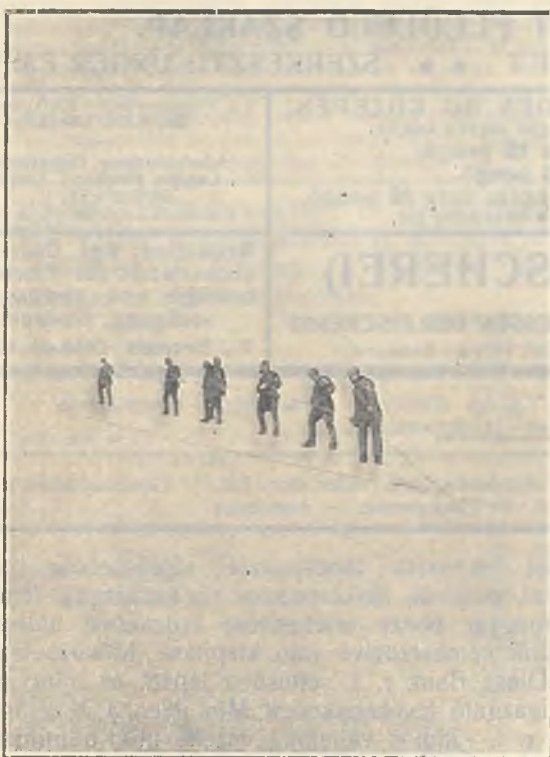
A cibékések húzzák a kötelet.

Mikor a vezérrúd a kihúzólék alá érkezett, a vezeres egy másik halász segítségével utolsó fordítást végez rajta a kihúzólék hossz tengelye irányában, azután kieme-