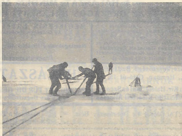
A vezérrúd fordítása a kihúzólékben. Balsarokban a két húzókötelet látható; a fehérsapkás halász buffogat a már kihúzott első vezérrúddal.

A két sáros alinat egy ember, az ú. n. alinas (ezt a gúnyarontó munkát felváltva naponkint más-más végzi) a két kötélt közé állva, arccal a tanyafej felé, jobb- és balkezébe kapja és húzza szakadásig hátrafelé, mögötte meg jobb- és baloldalt a többi halász ugyancsak pusztá kézzel vagy cibékkel serényen húzza kifelé a háló inait, annál gyorsabb ütemben, minél több háló került már ki a jég alól. A háló szárnya is hoz néha egy pár kezeget vagy kisebb fogast, és azt tartja a halászsregula,