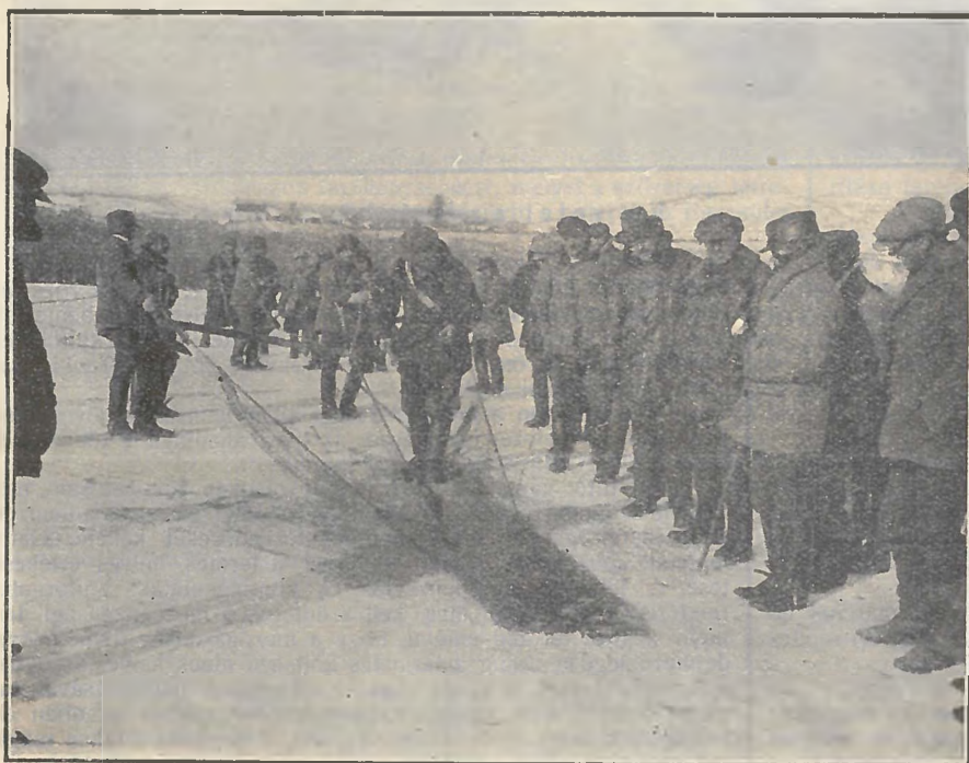
A kihúzóból kiemelik a háló két szárnyát.

már évtizedek óta nem fogtak a Balatonban. Az utolsó 15 évben a legnagyobb harcsa, amely szemünk elé került, 87 kilót nyomott, hosszúsága megközelítette a 2 és fél métert. Fogasban 12 kg-os, pontyban 21 kg-os, csukában csak 8 kg-os volt a legnagyobb példány, amely az utolsó évtizedben a Balatonból felszínre került.