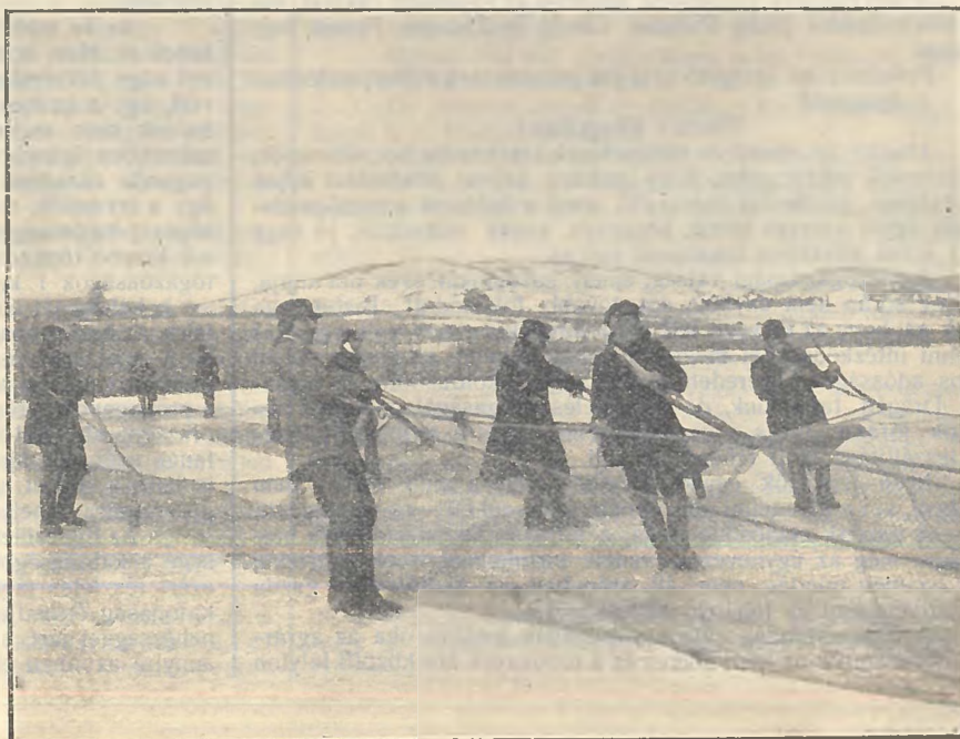
Közeledik a hálózsák.

Ha az időjárás és a jégviszonyok kedveznek a jégi halászatnak, aránylag jobb eredményeket hozhat felszínre a 400 m-es jégi háló, mint az 1200 m-es öregháló nyár idején. Ennek legvalószínűbb magyarázata az lehet, hogy a hideg vízben, a jég alatt a halak sokszor nagy csapatokba verődnek, a silány halak éppúgy, mint a fogasok, harcsák, „hogy egymáson melegedjenek“ (mint a halász mondja), — ellenben a nyári meleg vízben, amikor a halak ét-