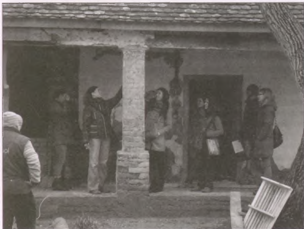
A kutatócsoport látogatása a felújítás alatt lévő gombosi tájházban

Az etnikai szegregáció a falu egyetlen temetőjében is megmutatkozik. Van egy hagyományos falusi temető, felnőtt és gyermek temetőrésszel, majd ezután a cigány és a zsidó temető rész következik. A temetői kálvária mögött viszont már létrejött a szerb temető.