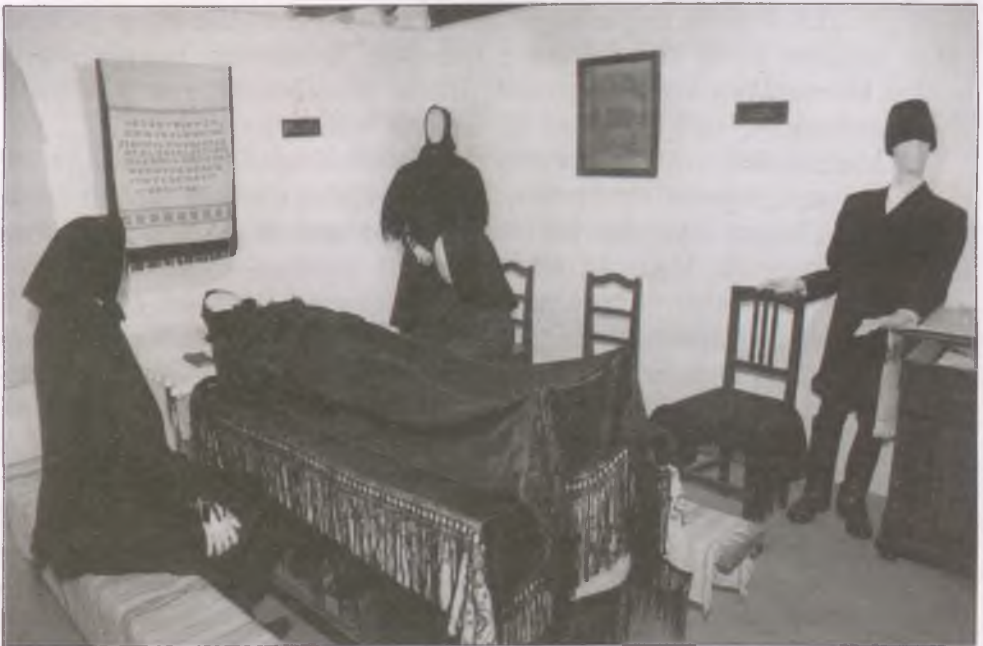
Református halottas szobabelső, részlet a kiállításból

A halál beálltát megelőző és követő cselekmények mindegyikének hagyományos rendje alakult ki. E cselekmények részint a halottal kapcsolatos gyakorlati szükségszerűség szabta teendők (mosdatás, fésülés stb.), részint a hozzátartozók viselkedésére és a halottas házra vonatkozó rendszabályok megtartásai. A halottat tisztelet és félelem övezte, tehát el kellett látni a neki járó dolgokkal, s visszajárását meg kellett akadályozni, illetve a halott akarata szerint kellett vele bánni. A halál beálltakor a legelső tennivalók közé tartozott az ablak kinyitása, az óra megállítása, a tükör letakarása, majd az ablakok lefüggönyözése. Az ablaknyitás célja az volt, hogy az eltávozó léleknek szabad útja legyen. A tükör letakarását, megfordítását a mai napig életben tartotta az iszonyat attól, hogy a tükörben is lássák a halottat, ill. a halott ne lássa saját magát benne. A halottas szoba ablakát a hiedelem szerint azért függönyözik le, mert ha valaki benéz az ablakon, sárgaságot kap, de kinézni sem szabad, mert akkor betegség üt ki. Az óra megállítása újabb keletű szokás; az élet megszűnése – az óra megállása képzet hozta létre. Ezeket a szokásokat be is mutatjuk a kiállításban.