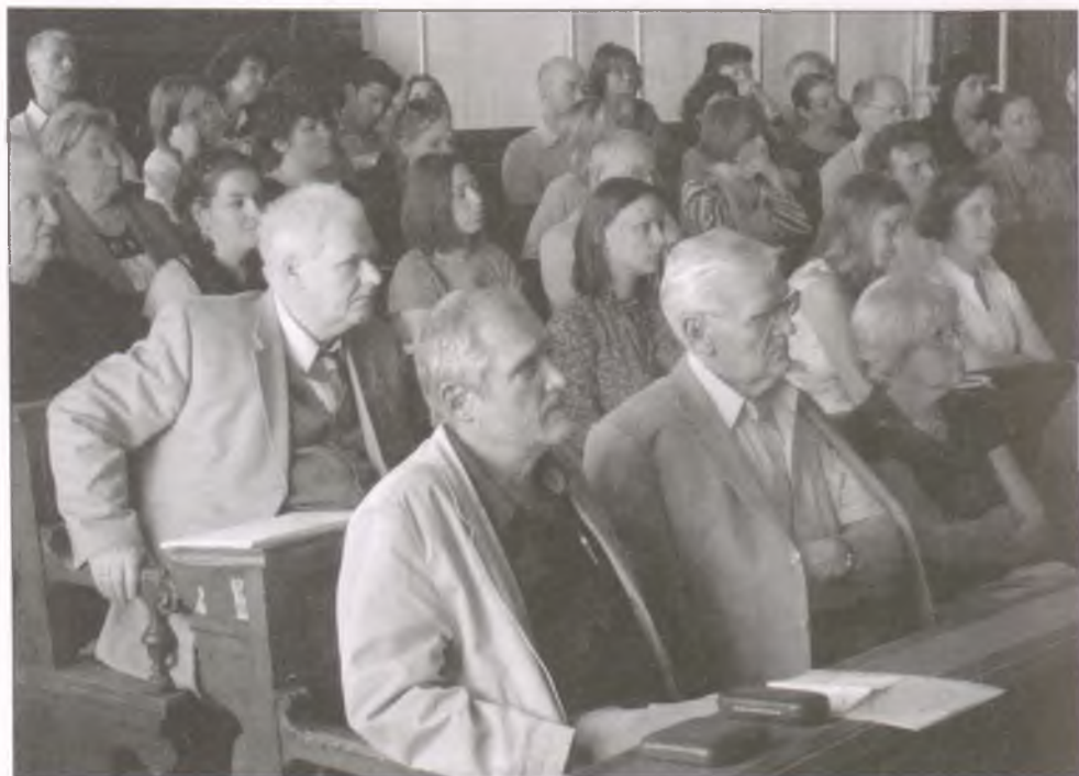
A közgyűlés résztvevői