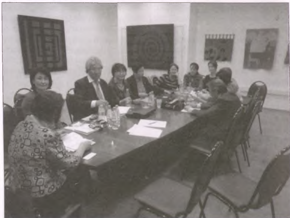
Szekcióülés a konferencián