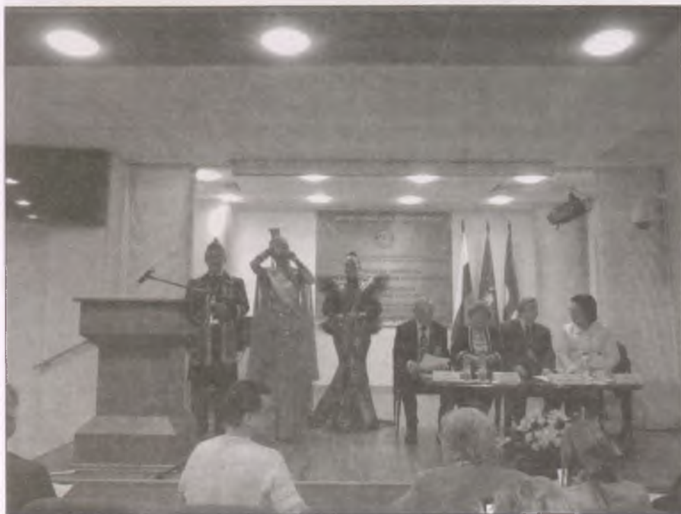
A konferencia megnyitója dorombzenével

európai tudományosság általános kritikája több előadásban is megfogalmazódott. Különösen gyakran idézték meg az előadók Oswald Spengler A Nyugat alkonya – A világtörténelem morfológiájának körvonalai című munkáját és annak gondolatait. A szaha előadók véleménye szerint a nyugat (vagyis Európa) jelenleg a spengleri történelemelmélet szerinti civilizációs időszakban, Jakutia és a szaha értelmiség ezzel szemben a kultúra időszakában található. A kultúra időszakát Jakutiában pedig éppen Kulakovszkij és annak száz éve írott levele nyitotta meg.