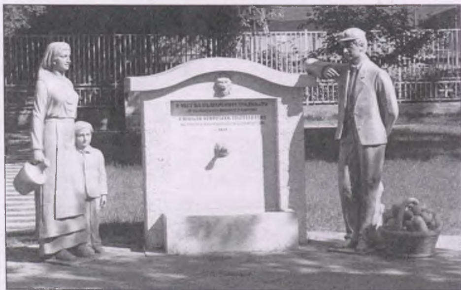
A budapesti bolgárkertész-emlékmű