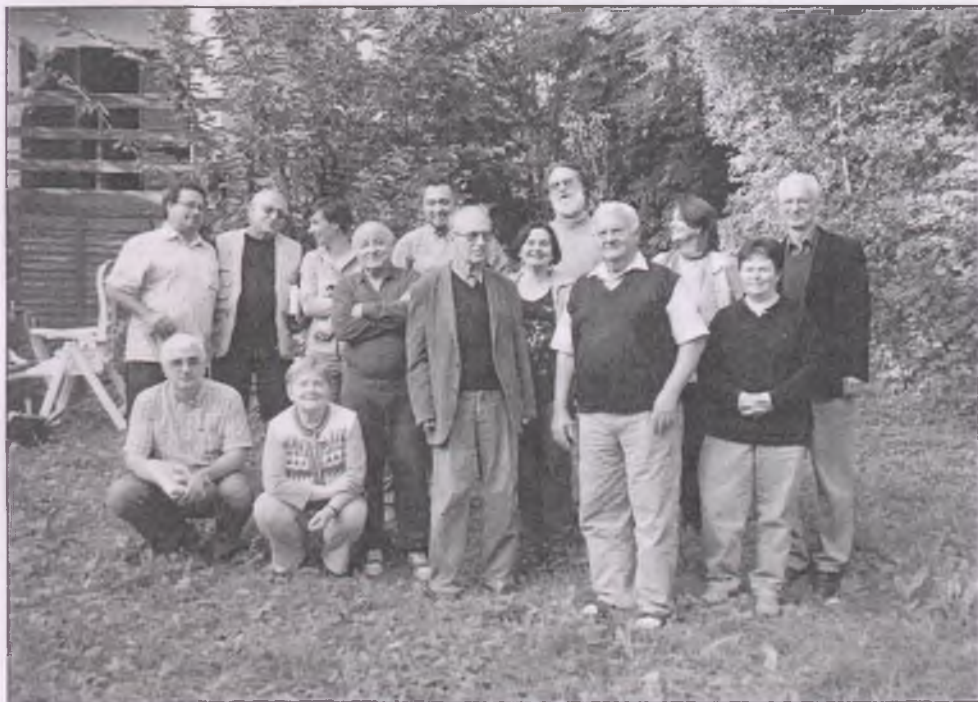
A Jankó János-díjas néprajzkutatók találkozásának résztvevői