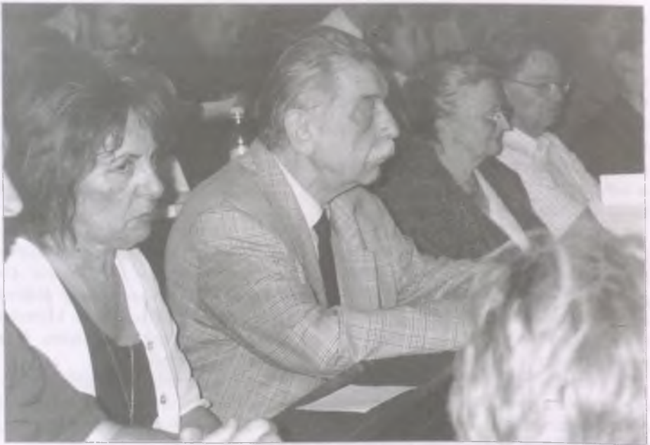
A közgyűlés résztvevői