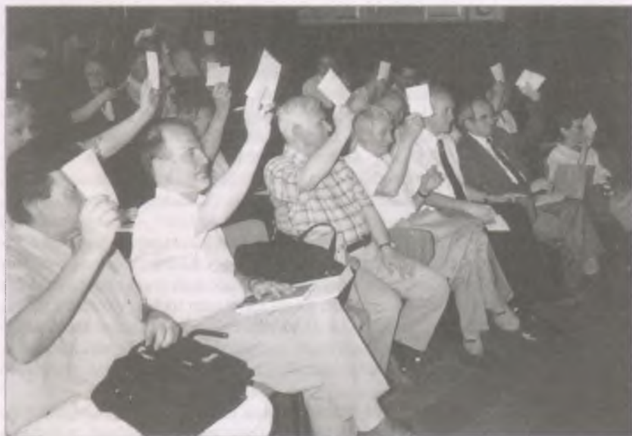
A közgyűlés résztvevői