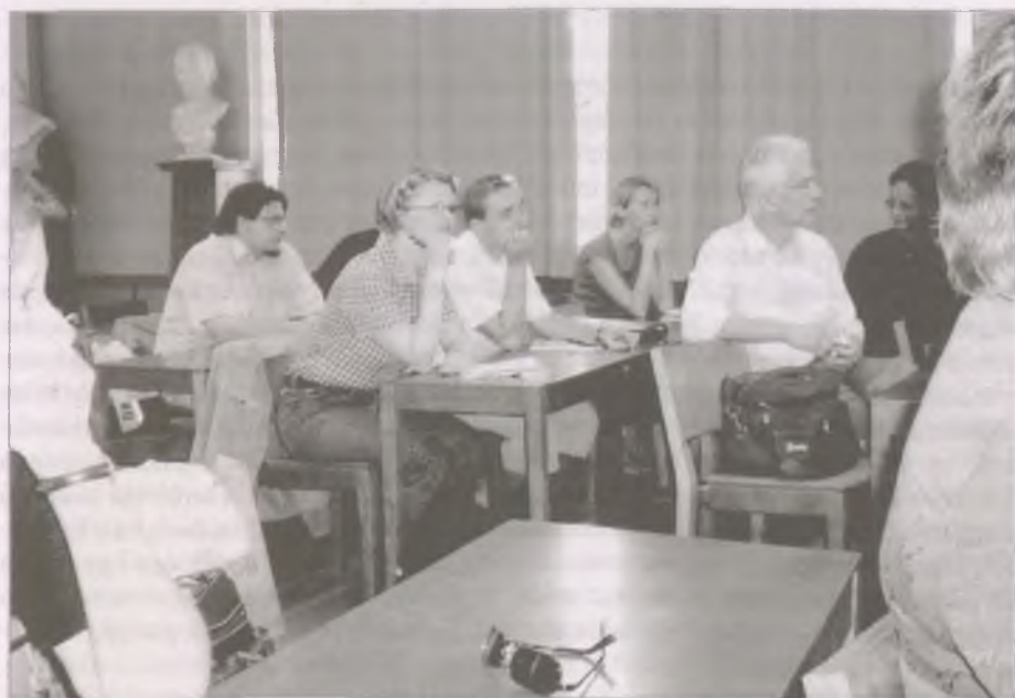
A szimpózium résztvevőinek egy csoportja