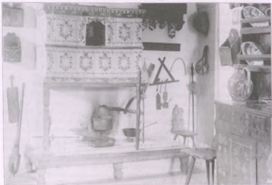
A székelyudvarhelyi református kollégium múzeumának egy részlete (Fotó: id. Kováts István, Néprajzi Múzeum, F 311194)