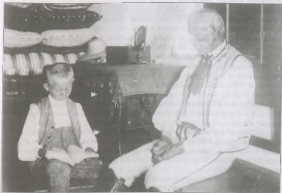
Lövetei székely öregember olvasó fiúcskával