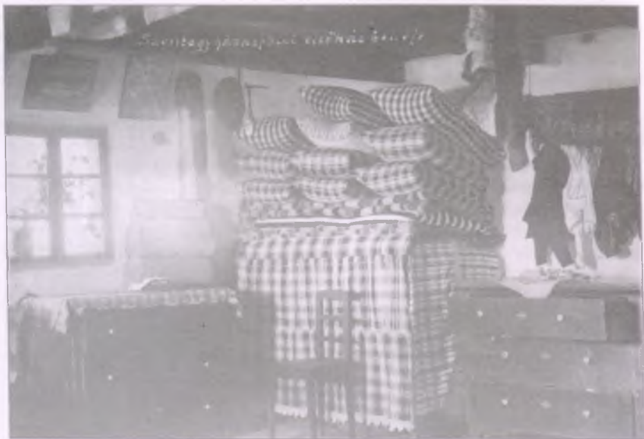
Egy szentegyházasfalui lakóépület „első ház”-a