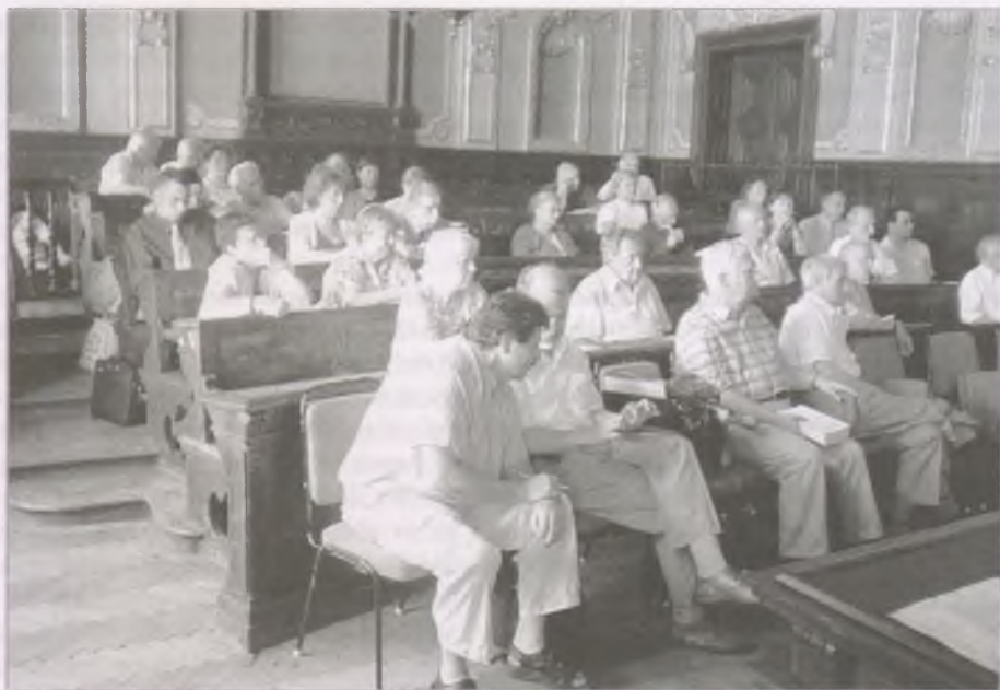
A közgyűlés résztvevői