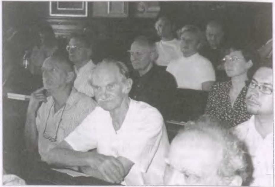
A közgyűlés résztvevői