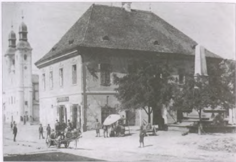
Székelyudvarhelyi városrészlet