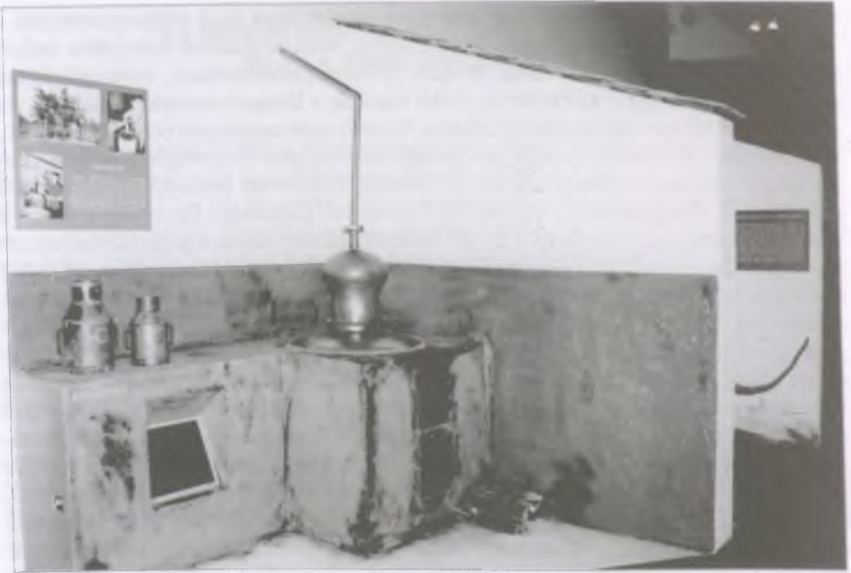
Pálinkafőző a kiállításban

lőket üzemeltettek, a rév, a vám, a halászati és a vadászati jog haszonbérletével foglalkoztak.