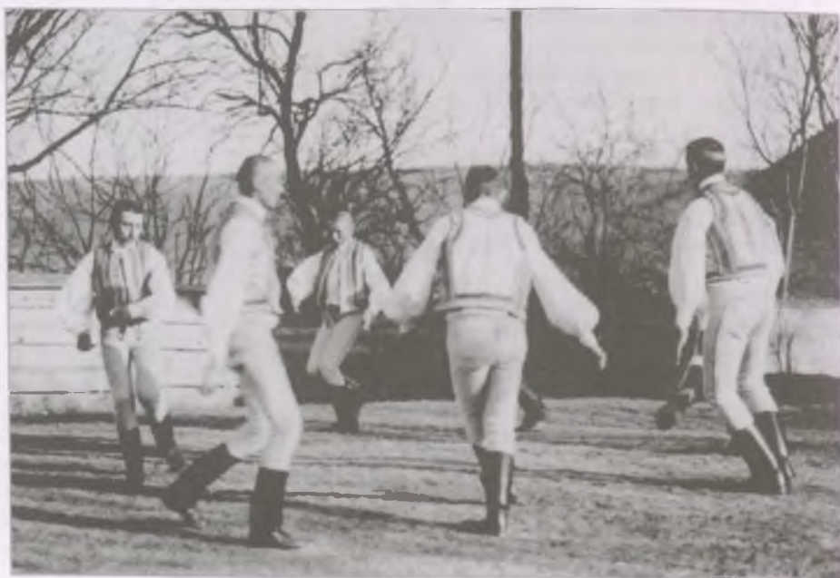
Kecsetkisfaludi „székely legényes”