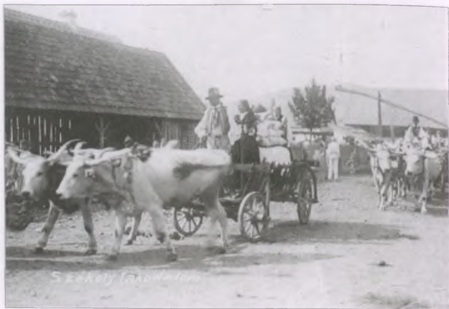
Udvarhely megyei székely lakodalmalás