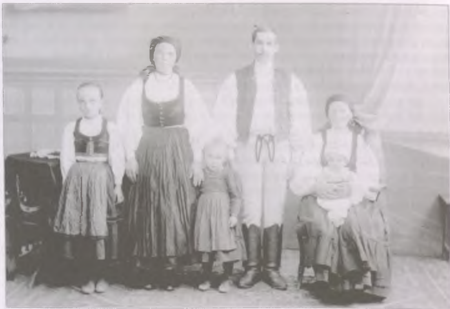
Dobói székely család (Fotó: id. Kováts István, Néprajzi Múzeum, F 65310)