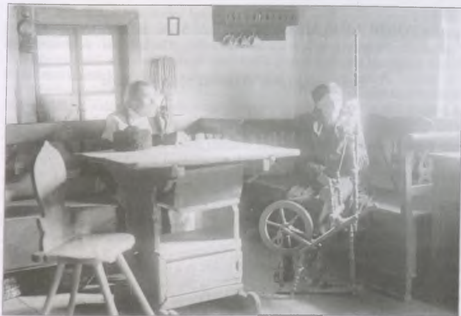
Kecsetkisfaludi „székely interieur” (Fotó: id. Kováts István, Néprajzi Múzeum, F 65262)