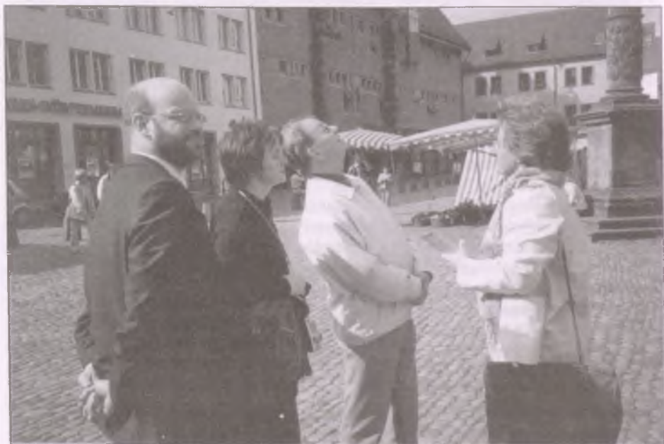
A freiburgi Münsterplatzon