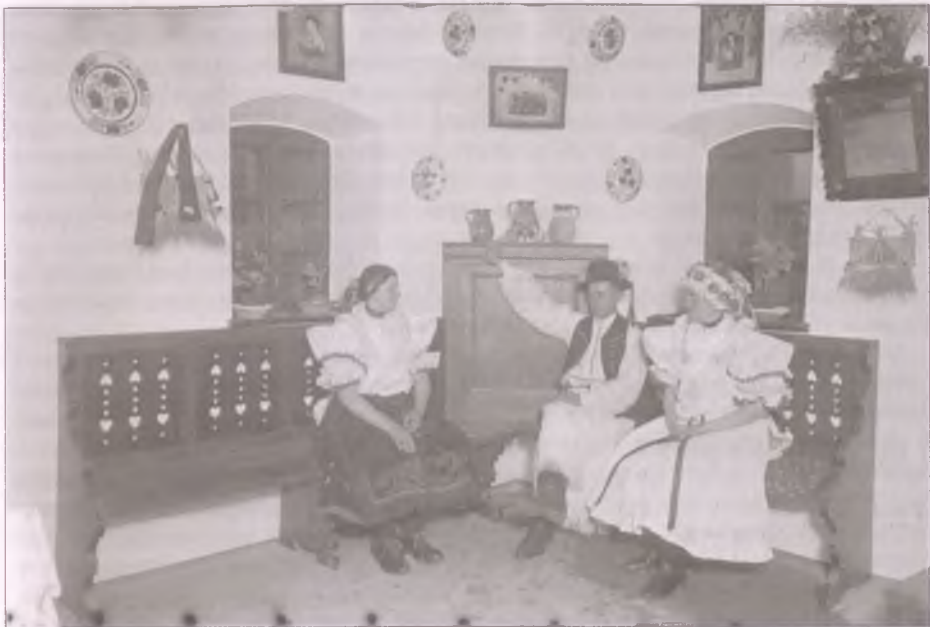
Idegenforgalmi vendégház Boldogon (Fotó: Vadas Ernő, 1940)