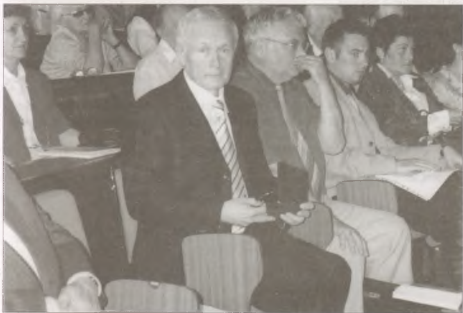
A közgyűlés résztvevői