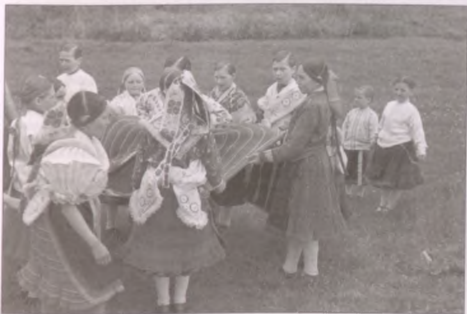
Várkörjáték Boldogon (Fotó: Dulovits Jenő, 1950)