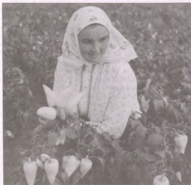
Paprikaszüret Boldogon (Fotó: Bakó Ferenc, 1962)