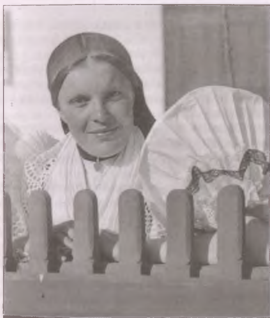
Boldogi lány (1936)