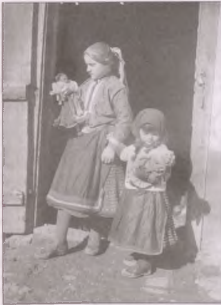
Két boldogi lányka babával (Fotó: Gönyey Sándor, 1936)