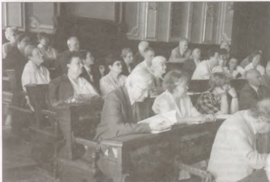
A közgyűlés résztvevői