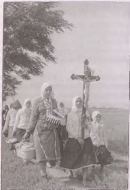
Mátraverebélyről hazafelé tartó boldogi búcsúk (Fotó: Falus Károly, 1950)