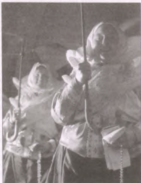
Boldogi asszonyok esernyővel (Fotó: Gink Károly, 1954)