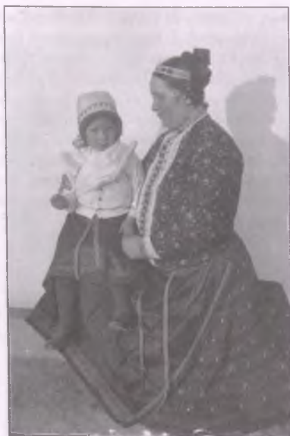
Boldogi menyecske gyermekével (Fotó: Gönyey Sándor, 1929)