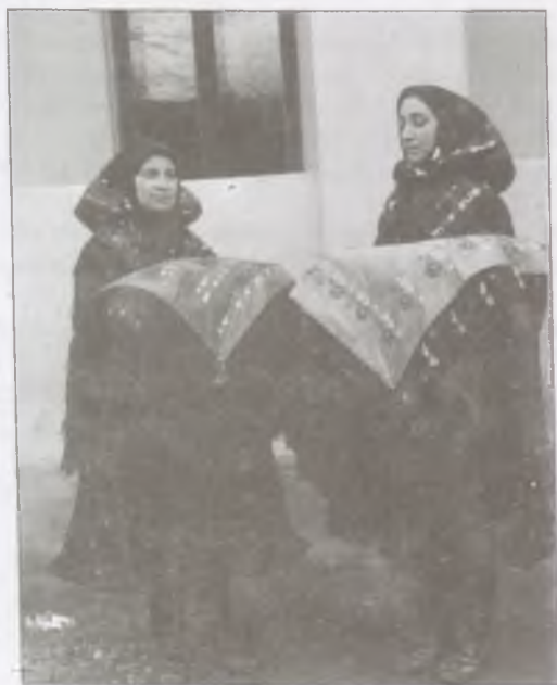
Boldogi keresztanyák (Fotó: Bruckner Jenő, 1920-as évek)