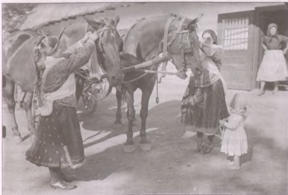
Felpántlikázzák a lovakat Boldogon