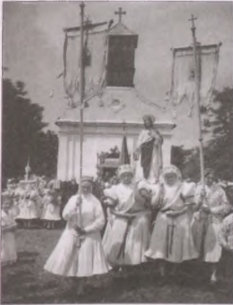
Boldogi búcsú (1941)