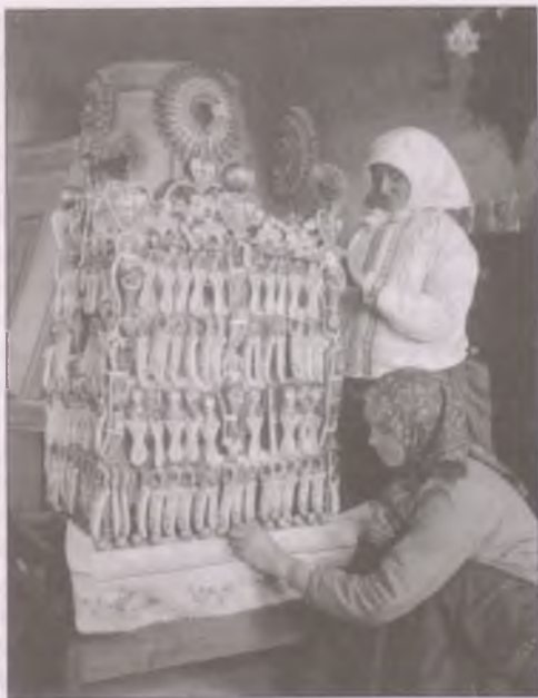
Menyasszonykalács díszítése Boldogon