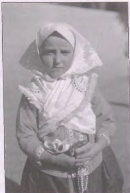
Boldogi kislány (1929)