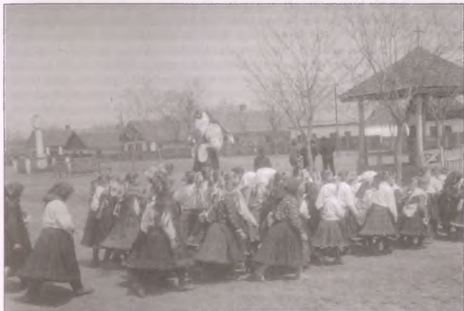
Viszik a kisébábot Boldogon

(Fotó: Bruckner Jenő, 1920-as vagy 1930-as évek)