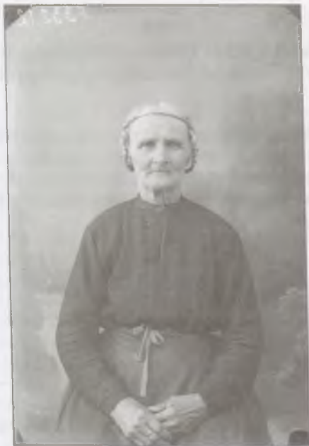
Idős boldogi asszony (Fotó: ismeretlen fényképész, 1910 körül)