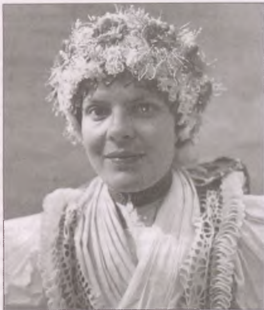
Boldogi menyasszonyfejdísz (Fotó: Kálmán Kata, 1935 körül)