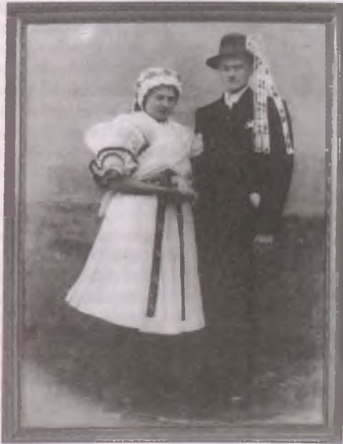
Boldogi esküvői kép (Fotó: Bakos Pál, 1948)