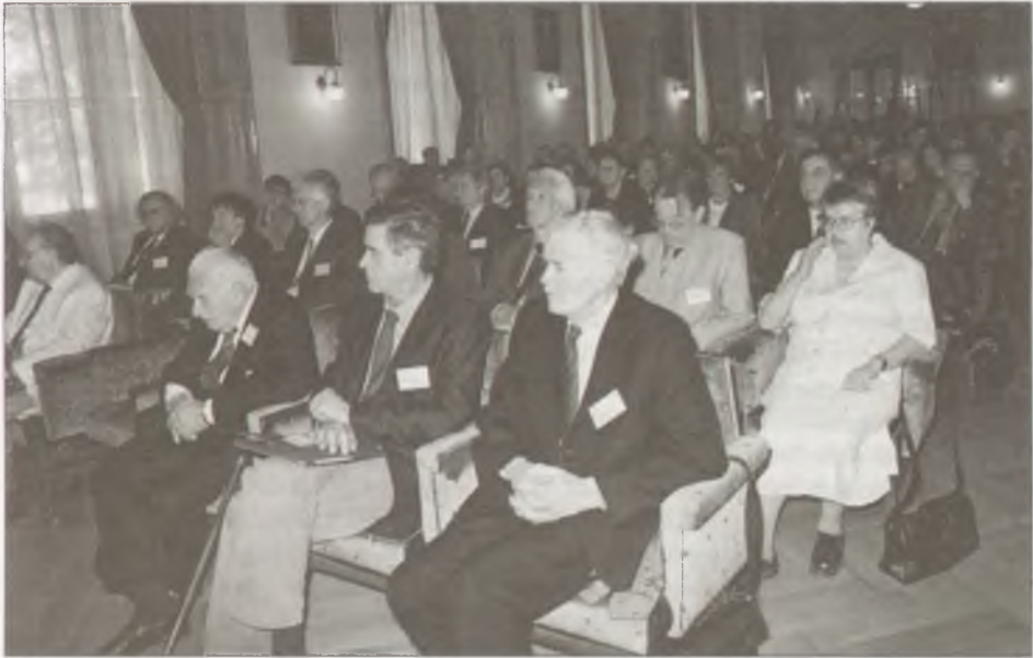
Az ünnepség résztvevői