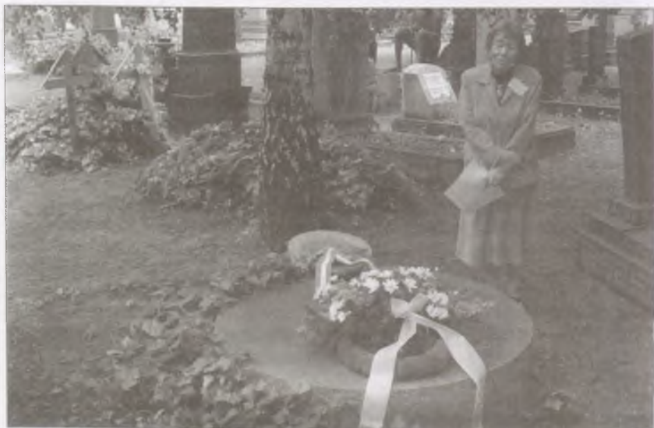
Dégh Linda Ortutay Gyula sírjánál