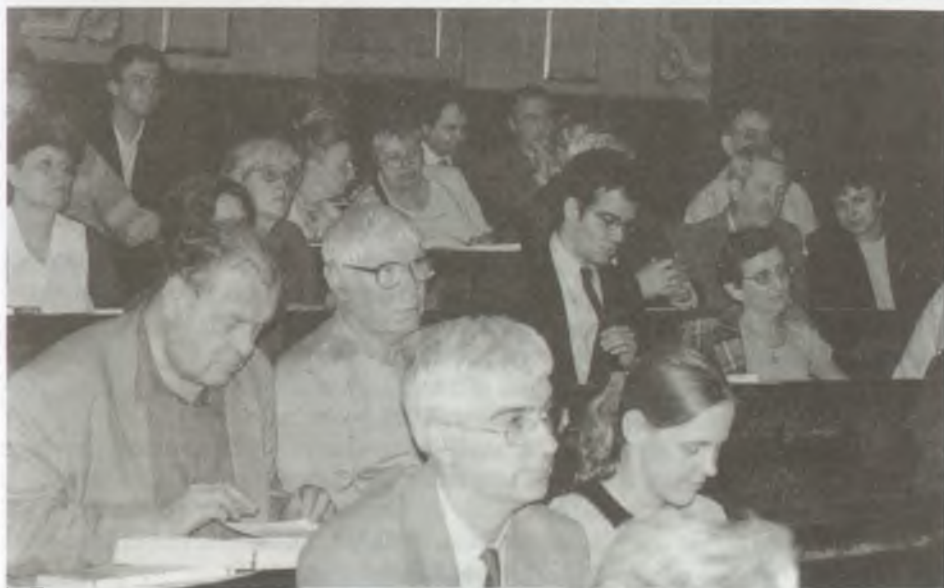
A közgyűlés résztvevői