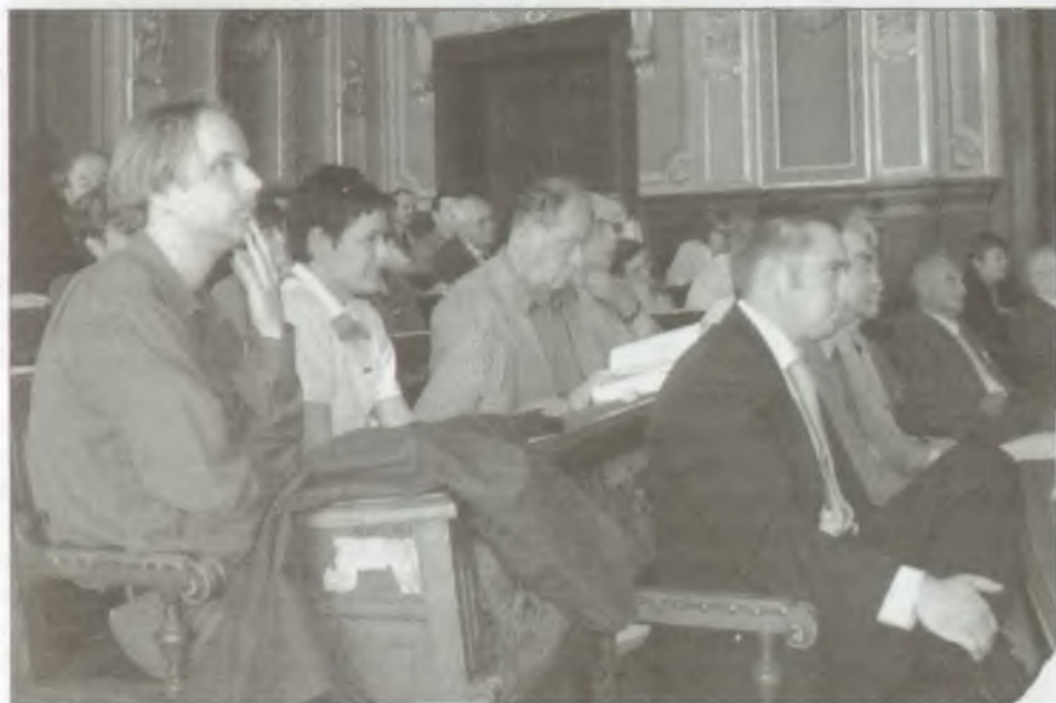
A közgyűlés résztvevői