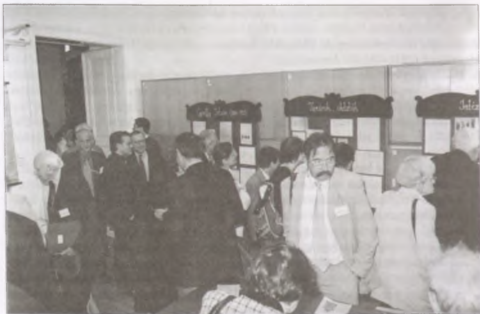
A vendégek megtekintik a kiállítást