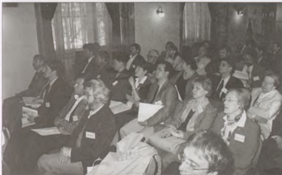
Az ünnepség résztvevői