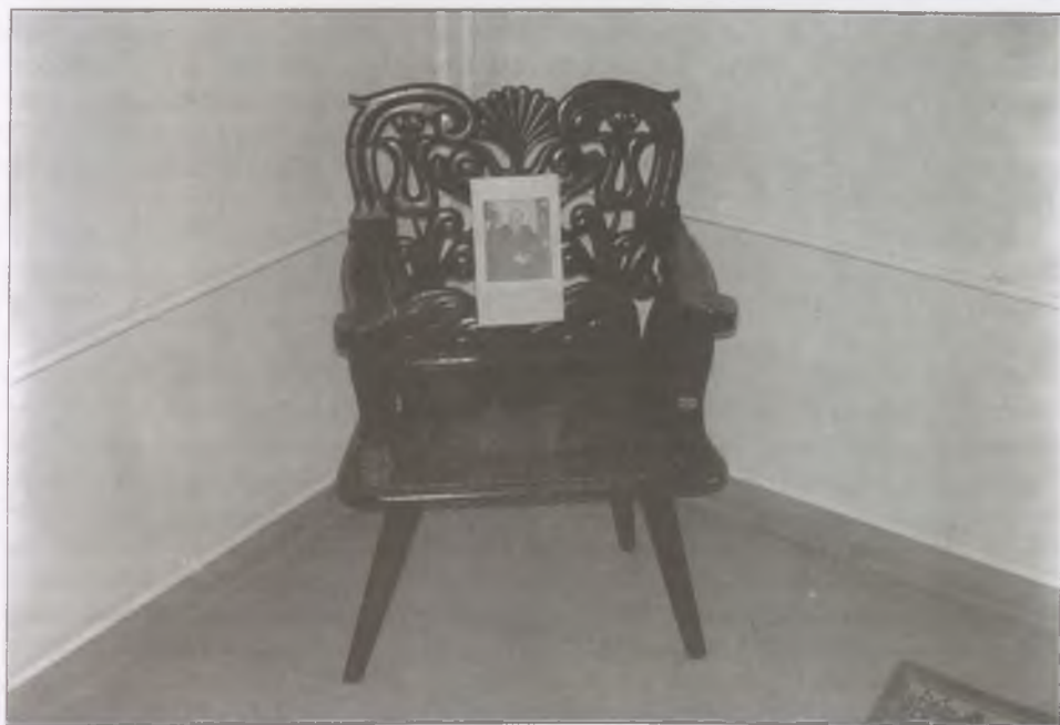
Györfy István széke az Intézet könyvtárában