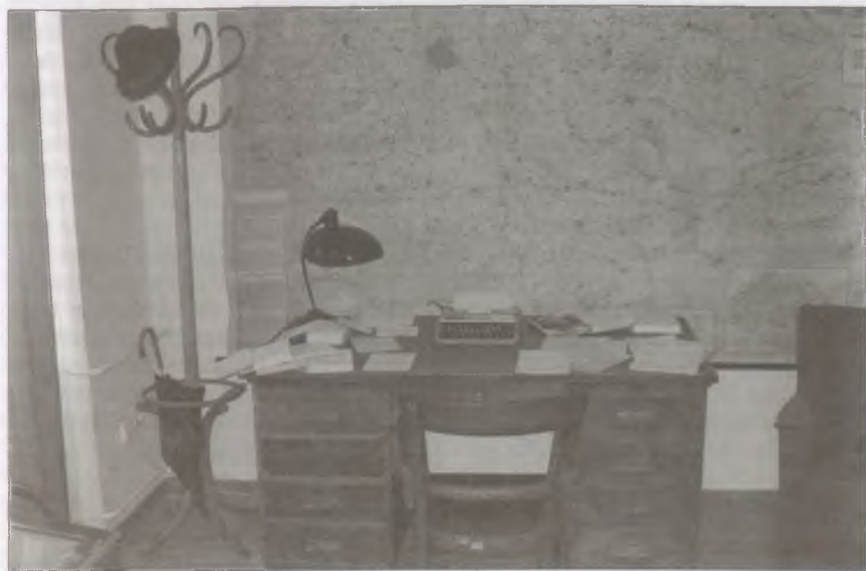
Tálasi István íróasztala a kiállításon