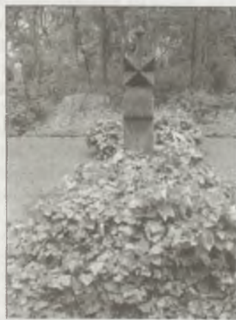
Györfffy István sírja a Kerepesi temetőben

csúcspontján sem mondhatunk le arról a kiaknázatlan, nagy nemzeti megújhodást jelentő forrásról, amit a néphagyomány jelent, aminthogy eszünkbe sem jut a magyar nyelvet egy világnyelvvel felcserélni. Egyébként Európa is azt kérdezi tőlünk, hogy mi az, amivel a európai műveltséget a magunkéból gazdagítottuk, s nem azt nézi, hogy átvettünk-e mindent, amit az európai művelődés nyújthat. Európa az egyéniséget keresi bennünk és nemzeti elfogultság nélkül mondhatom, hogy azok is vagyunk.” Végezetül reményét fejezte ki, hogy továbbra is a megszokott kerékvágásban zajlik majd az egyetemi élet és stílszerűen „még hétszer hetven évet” kívánt a Néprajzi Intézetnek.