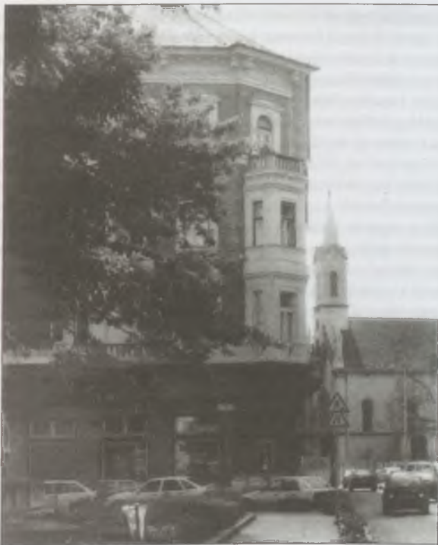
Az Európai Folklor Intézet székhelye: Budapest, Szilágyi D. tér 6.

2002-ben a Teleki Alapítvány rendezett egy hosszú távú együttműködés keretében zajló, az Örökségről szóló kerekasztal-beszélgetést, amelyen az intézet képviselte a hagyományon alapuló szellemi örökség kérdéskörét.