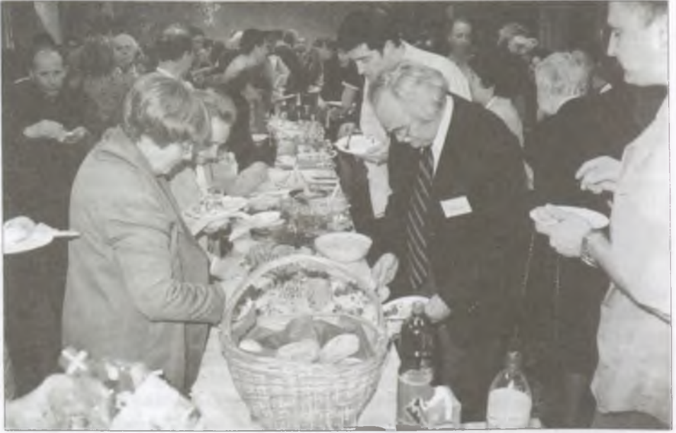
A fogadás résztvevői