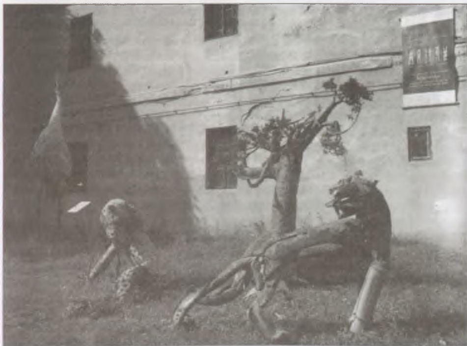
Finn alkotások a Zichy-kastély udvarán