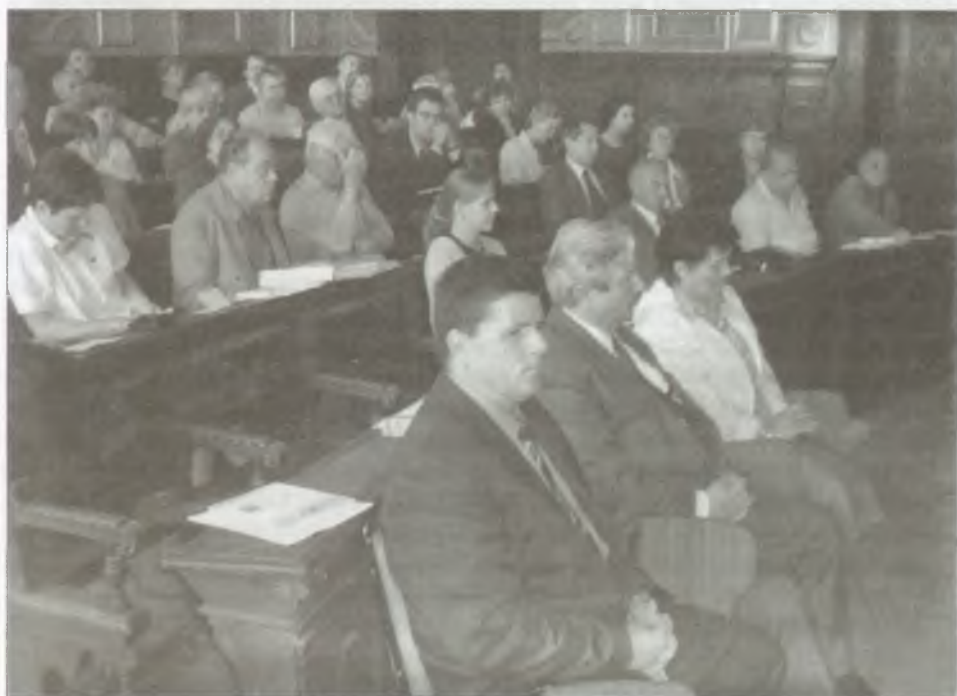
A közgyűlés résztvevői