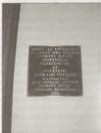
Györfffy István emléktáblája az Intézet könyvtárában