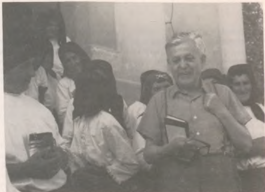
Bálint Sándor, baranyai gyűjtés közben (1973)

Bálint Sándornak nyugdíjazása után új, gazdag alkotó korszaka kezdődött, amit csak 1972-től számítva is hat megjelent önálló kötete fémjelez, többek között a kétkötetes Ünnepi kalendárium és A szegedi nemzet első kötete. Élete, munkássága, küzdelmei, feltáró kutatásai például szolgálhatnak mindannyiunk számára.