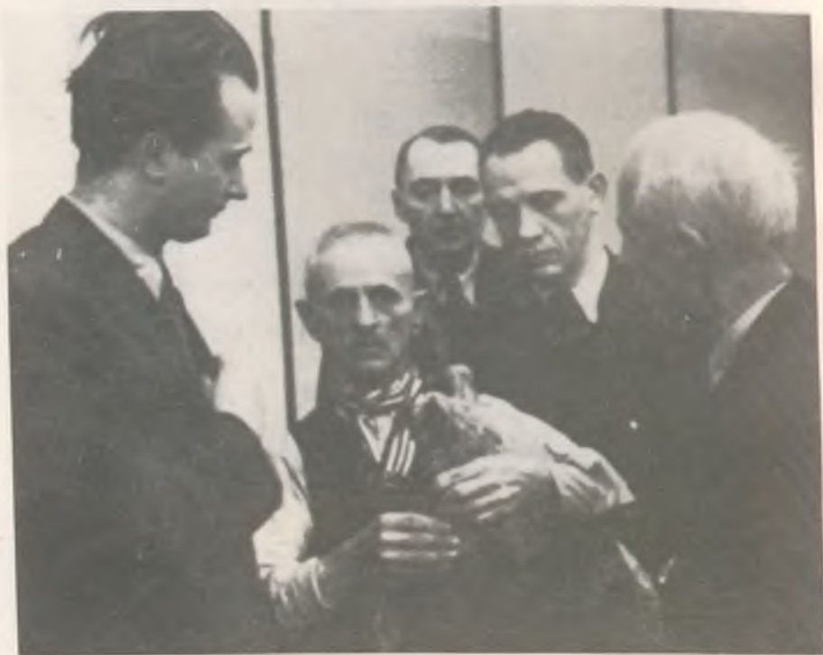
Ortutay Gyula Bartók Bélával és Lajtha Lászlóval

1946-ban a közgyűlés a korábban csak megbízott elnökét véglegesként megválasztja, aki ezt a tisztséget két éves megszakítással (1956–58) elhunytáig töltötte be. Számára az elnöki feladatok mindig azt a kötelezettséget jelentették, hogy a Magyar Néprajzi Társaság fejlődését, szervezeti és nemzetközi kapcsolatait, belső munkájának színvonalát és hatékonyságát minden rendelkezésre álló erkölcsi és anyagi eszközzel erősítse, ezáltal a magyar néprajztudomány számára itthon és a nagyvilágban rangot vívjon ki. Törekvése minden tekintetben eredményesnek is bizonyult. A Társaságban a néprajzzal összefüggő különböző pozitív tudományos és népszerűsítő irányzatok, szerteágazó tevékenységfajták biztos alapot, támogatást kaptak, így a forráskutatástól a filmezésig, a tudományműveléstől a népszerűsítésig, a magyar etnikum vizsgálatától a nemzetiségek, vagy a fejlődő országok népeinek archaikus értékei feltárásáig.