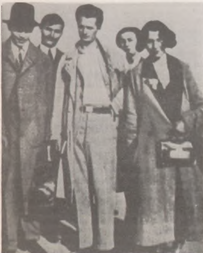
Ortutay Gyula a harmincas években a Szegedi Fiatalok Művészeti Kollégiumának tagjaival (Tolnai Gábor, Erdei Ferenc, Ortutay Gyula, Radnóti Miklós, Tomori Viola)

Napirend előtt Gunda Béla, a Társaság alelnöke kért szót és üdvözölte Ortutay Gyula akademikust, a Társaság elnökét abból az alkalomból, hogy negyven éve jelent meg a néprajztudomány fejlődése szempontjából oly kiemelkedően fontos „Magyar népismeret” c. könyve.