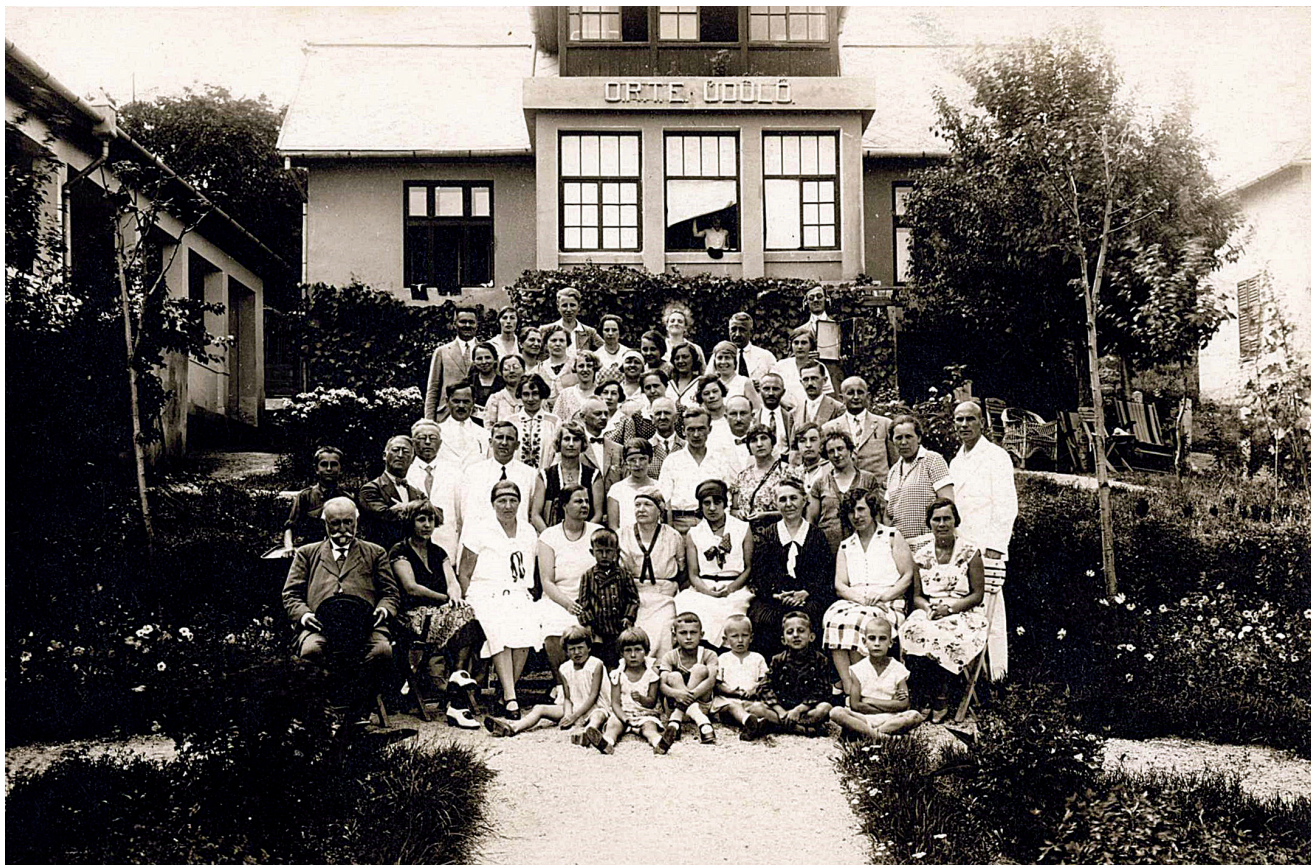
6. kép – Nyaralók csoportképe az ORTE balatonalmádi üdülője előtt az 1930-as években

ifjúsági egyesületben előadó s még analfabéta tanfolyam vezetője is volt. 33