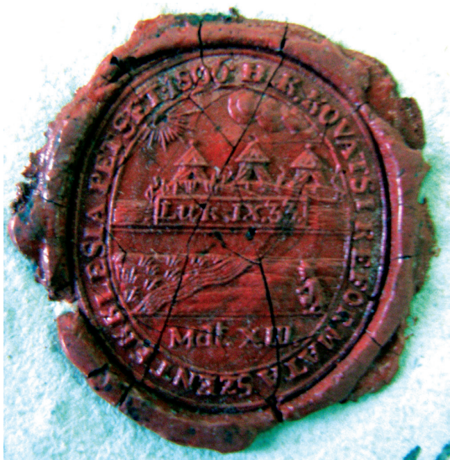
2. kép – A hegyközkovácsi eklésia pecsétje