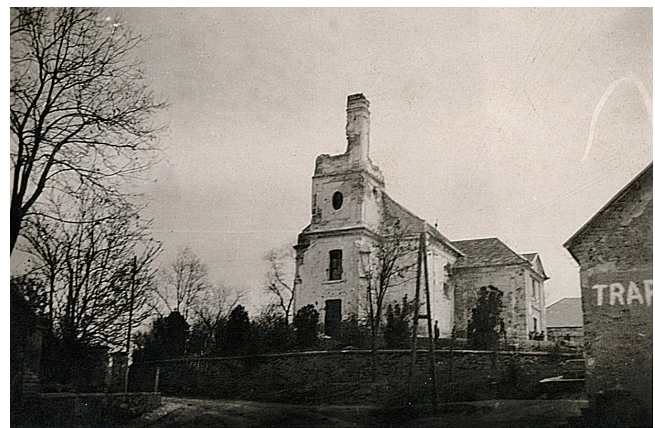
1. kép – A balatonfőkajári református templom a háború után

Az elveszett információk részleges pótlására fogalmazódott meg az ötlet, hogy a Magyar Nemzeti Levéltár Veszprém Megyei Levéltára (MNL VeML) célzott magániratgyűjtést folytasson Balatonfőkajáron, illetve balatonfőkajári vonatkozású