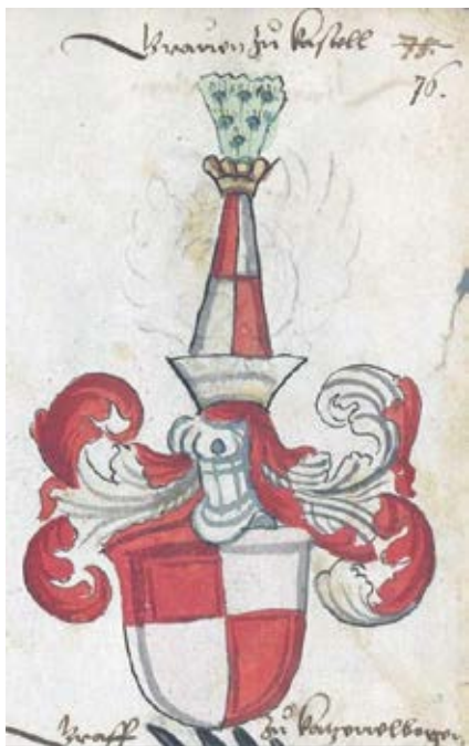
2. kép – A castelli grófok címere az Augsburgi Címereskönyvből, 1475 körül Bayerische Staatsbibliothek, Cod. icon. 311. 76r.