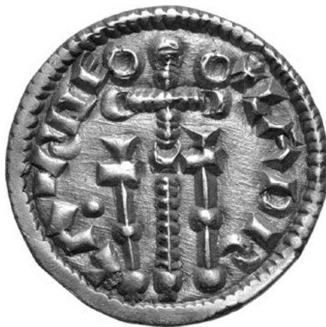
4. kép – Szent László érme, előlap (Huszár 28.)