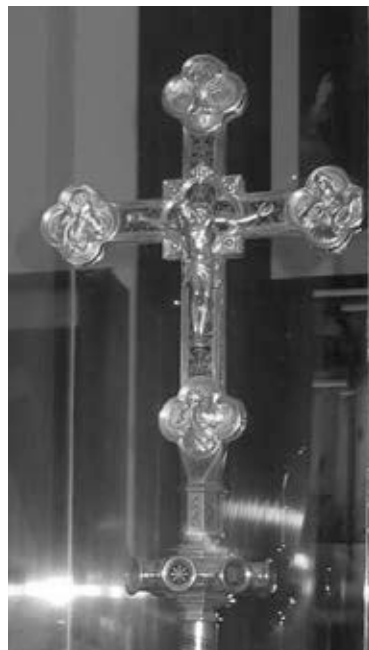
3. kép – Az ún. apostoli kereszt http://www.tti.hu/lendulet/537-ius-coronandi-konferencia-es-kiallitas-esztergomban (Letöltés ideje: 2012. december 1.)

ben és irányításában „mindkét jogn” – isteni és világi jogn – eljárhasson. Az „apostol” értelmező onnan ered, hogy miként Krisztus tanítványai, úgy István is minden előzmény nélkül, szinte a semmiből, kizárólag a római Szentszék közreműködésével teremtette meg a Magyar Királyság egyházszervezetét. A Hartvik-legenda szövegét liturgikus olvasmányként 1215-ben III. Ince pápa (1198–1216) a „mindkét jogn” kifejezés elhagyása után engedélyezte. 21