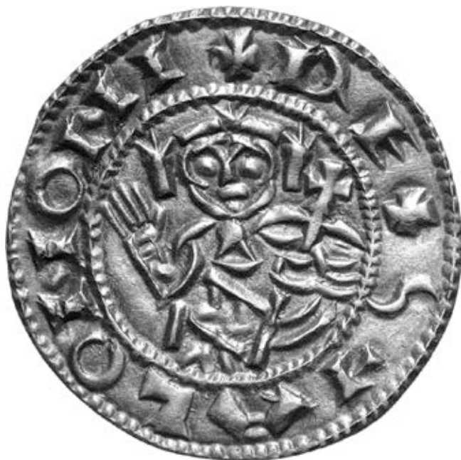
2. kép – Salamon érme, előlap (Huszár 17.)