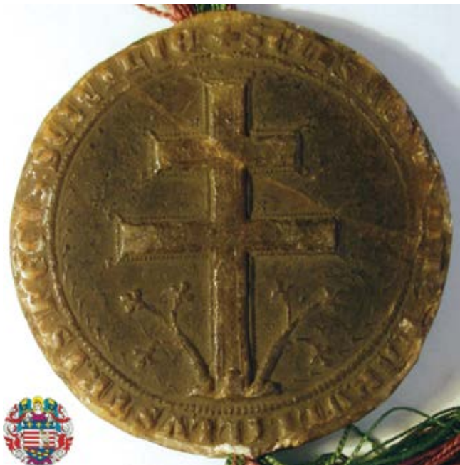
2. kép – Izabella (Erzsébet) királyné pecsétjének hátlapja, 1278

második pecsétjét ugyanis kétszer módosította, a Takács Imre által leírt pecset különbözik a most közölt 1278-as pecsettől, és az 1284-ben használttól egyaránt.