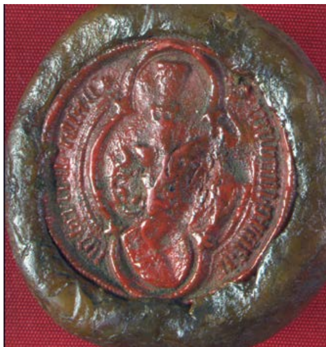
4. kép – II. Vilmos castelli gróf pecsétje 1434-ből (DL 12649.)