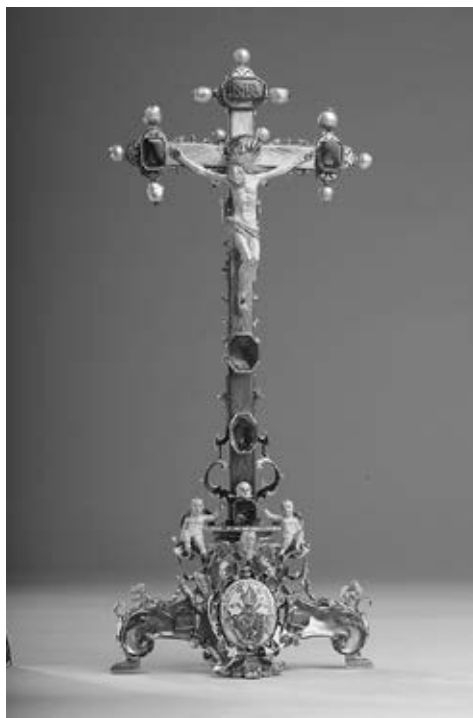
1. kép – A békefeszület

4 Marczali Henrik: Magyarország története III. Károlytól a bécsi congressusig (1711–1815). In: A magyar nemzet története. (Szerk. Szilágyi Sándor.) VIII. kötet. Bp., 1898. 18. Az uralkodó Magyarországhoz való viszonyára: Kalmár János: III. Károly és Magyarország 1711-ben. Levéltári Szemle, 39 (1989) 4. sz. 44–50.