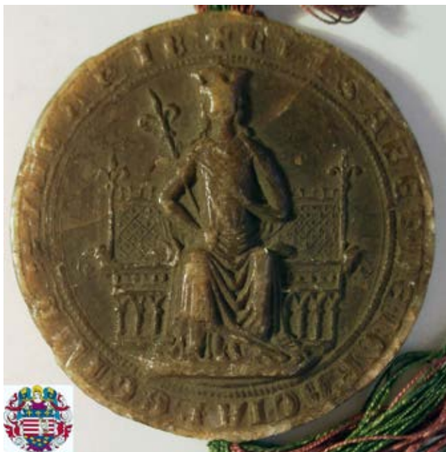
1. kép – Izabella (Erzsébet) királyné pecsétjének előlapja, 1278 (ld. a 8. jegyzetet)