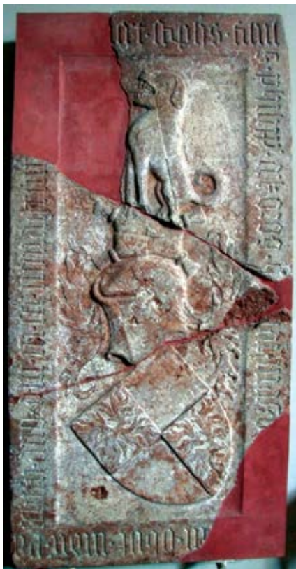
1. kép – Kórógyi István sírköve 1397-ből Eszék, Szent Kereszt-templom