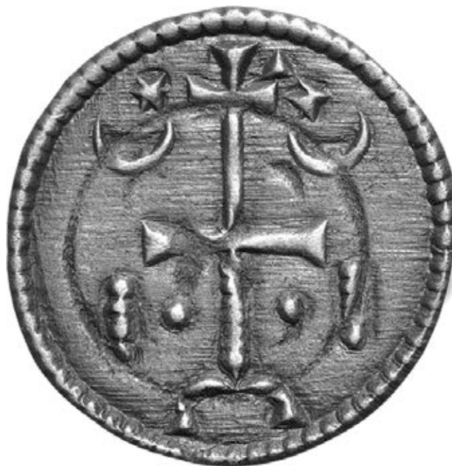
8. kép – 12. századi érem, előlap (Huszár 116.)

században mi volt az apostoli kereszt küldésének a jelentősége? Mit értettek az egyházban apostoli keresztnek? Milyen volt a formája? És a pápa keresztküldésén mit értett (vagy értett félre) Hartvik és Kálmán, illetve a királyi udvar? Véleményem szerint szükségtelen feltételezni, hogy a legenda 9. fejezete teljes egészében Hartvik aktuálpolitikai koholmánya: csak „az egyháznak és népeknek mindként törvény alapján történő igazgatása” 117 lehet az ő értelmezése és beszúrása. Ezt a szövegrészt III. Ince rendelkezése természetesen kihagyta az ünnepi szolozsma szövegéből. 118 A korona 119 és a kereszt küldése az apostoli levél mellett tárgyyszerű és hiteles lehet. 120 Mindenesetre a pápától érkezett keresztnek a magyar udvarban kezdettől nagy jelentőséget tulajdonítottak, ha I. András sírkövén kifaragták, majd Salamontól kezdve az érmek hátlapjára folyamatosan ráverték. Az éremhátlap ábrázolása egyértelműen arra mutat, hogy a korábbi lancea regis -t a körmeneti kereszt váltotta fel. Aligha tételezhető fel, hogy a változás nem szándék nélkül történt. Az ábrázolások tanúsága szerint ez a kereszt kétségtelenül latin kereszt volt. A 12. század vége felé pedig gyakorlatiasan gondolkodtak: a jelvényt fontosnak tartották, és ezért kettős keresztte átalakítva az ország címereként megtartották, hogy ne lehessen összetevésíteni a keresztiesek jelével.