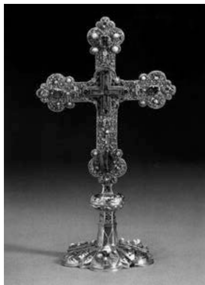
2. kép – A koronázási eskükereszt http://mek.oszk.hu/01900/01954/html/index207.html (Letöltés ideje: 2012. december 1.)

Eskükereszt: 40,2 cm magas, eredetileg famagon lévő, hétkaréjos szárvégekkel ellátott aranykereszt, amely egyben ereklyetartó is. A szentkereszt-ereklyét a szárak metszésénél illesztették be. 9 Az esztergomi műhelyben készült tárgyat kacsfiligránok, drágakövek (zafir, gyémánt, ametiszt, smaragd) és gyöngyök ékesítik. 10 Felső része 13. század második feléből származó, bizánci hatást is tükröző román stílusú alkotás, amelynek magyar (?) mestere egy kompozícióba foglalta a latin és a görög keresztet. 11 Az ötvösmű gombját és talpát Pázmány Péter esztergomi érsek (1616–1637) 1634-ben javíttatta ki. Ekkor készült az elő- és hátoldalon a négykaréjos, csillagsugaras Magyarok Nagyszonyaplakett, valamint – három eredeti filigrános mező felhasználásával – a talpazat, vésett aljú zománccal. Innentől fogva vált használatossá a királyavatási szertartásokon. 12 Batthyány József hercegprímás (1776–1799) jóvoltából 1790-ben négy-négy darab ametiszt és smaragdkő került rá, Keglevich Zsigmond nagyprepost bőkezűségének köszönhetően pedig 1803-ban újabb értékes drágakövekkel látták el. 13 Írott