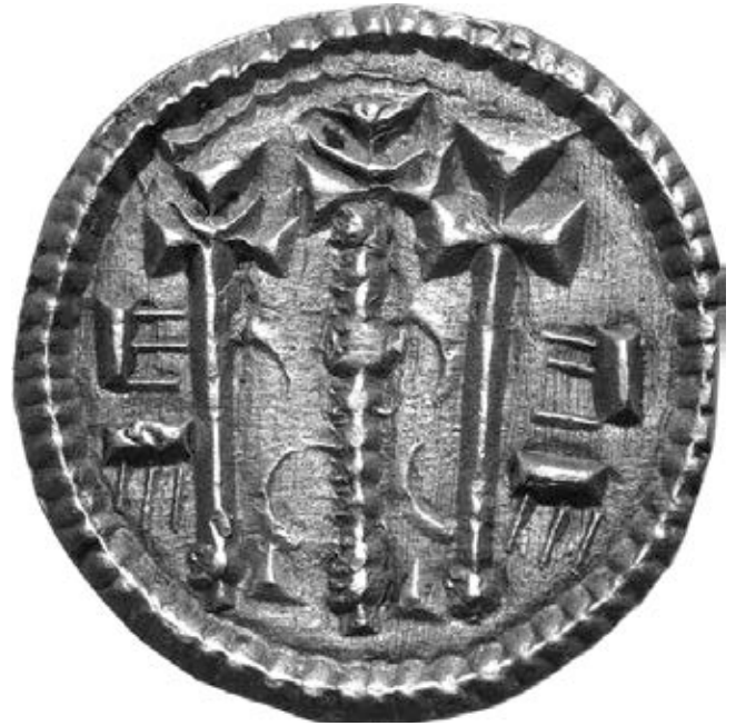
7. kép – II. István érme, előlap (Huszár 47.)

2.2. Fontos látnunk, hogy a magyar címer kettős keresztje nem mesteralak, amelyet a Szavojai-ház címerében, Anglia zászlóján és a Danebrogon (1219), valamint az utóbbi hatására alakult skandináv zászlókon látunk. 70 Alakja és lebegő elhelyezése az első (Árpád-kori) ábrázolásokon nem mértani alakzat, hanem a metszéspontból a száruk vége felé kissé szélesedő forma. A korai kettős kereszt-ábrázolások sajátosságára Takács Imre hívta fel újólag a figyelmet, 71 több pecséten a függőleges szár alsó végén hegyes, háromszög alakú nyúlvány van. 72 Ez fontos részlet, mert az ábrázolt tárgy eredetét mutatja: mintája a rúdra tűzött, azaz körmeneti kereszt ( crux processionalis, Vortragkreuz ) volt, azaz természetes ábrázolás. Huszár 69-es érmén is ilyen kereszt van a pajzsban: alján jól látszik a túske. Az ilyen keresztet a múltban és az újabb korban