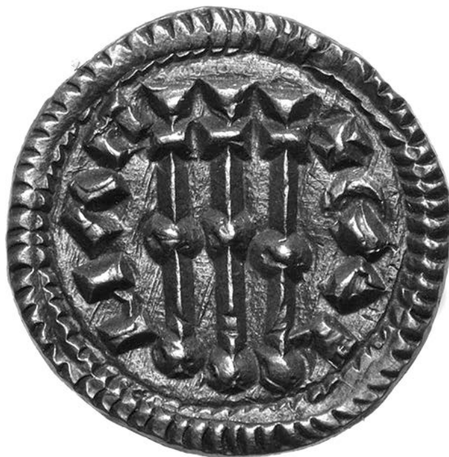
6. kép – Kálmán érme, előlap (Huszár 34.)

A kettős keresztet a 10–13. században a keleti és a nyugati egyházban és művészetben eltérően használták. A forma minden bizonnyal a Keletrómai Császárság területén a keresztfelirat táblájából alakult ki. 53 Alakja ismert volt a nyugatabbra fekvő országokban is, ha közel sem használták olyan intenzitással. Képe a keleti egyházban két témában gyakori: az anastasis – az Úr feltámadása – jelenetben Krisztus kettős keresztet tart a kezében, 54 és a hetoimasia – az Úr második eljövételéhez a trón előkészítése – jelenetben, 55 ahol a Krisztus eljövételére készített trónra gyakran kettős keresztet helyeztek. Valóságos tárgyként két formában jelenik meg. Az egyik, a tábla alakú sztaurotékáknak – amelyek a kereszttereklye-tartók bizánci formái – a kettős kereszt alakú betétje. 56 A szorosan vett szakrális, liturgikus körön kívül a császárok gyakran tartanak a kezükben hosszú szárú, kettős keresztet, azaz jelvényként használják, amely a 8. századtól kezdve érméken és pecséteken egyre gyakoribb. 57 Jelvényt szerepét mutatja, hogy