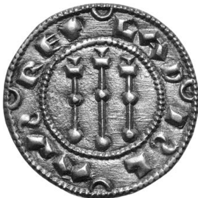
3. kép – Szent László érme, előlap (Huszár 27.)

1.2. A keresztpánt lemezein a Krisztus- és apostolképeket filigránnal, almandin gránátkövekkel és gyöngyökkel vették körbe. Elrendezésükben a tudatos tervezés jól tetten érhető. Az apostolok kiválasztása és elhelyezése nem volt véletlenszerű. Az Apostolok Cselekedetei névsora első nyolc apostolának képét tették fel a lemezre. Használhatták volna a misekánon vagy az evangéliumok névsorait is. 16 Az apostolképeket nem tetszőlegesen, hanem a felsorolásnak megfelelően, meghatározott rendben helyezték be a keretekbe. Nemcsak a Krisztus-lemez két oldalán a főapostolok, Péter és Pál lemezét, hanem a többit is. A képeket a mellékelt rajz szerint rakták ki (1. kép). Krisztus jobb oldalán Péter, a balon Pál áll, majd az elülső lemezen János, a hátsón Jakab következik. A második, alsó sorban ugyanilyen rendben indul a lemezek elhelyezése: Krisztustól jobbra András, balra Fülöp áll. Ezután változik a sorrend, mert az Apostolok Cselekedeteiben Tamás következik, a koronán viszont Bertalan lemeze áll: úgy látszik, mintha a két apostol lemezét felcserélték volna. Nem így volt. Eredetileg minden bizonnyal az Apostolok Cselekedeteinek megfelelő Tamás-kép következett a keresztpánt elülső lemezén. A homloknézetben a görög korona Krisztus-lemeze szinte teljesen takarja a Bertalan-képet. Amint azt régóta tudjuk 17 és én is ellenőriztem, a Bertalan-kép erősen sérült, csonka. A névfelirat alatti, nem látható része