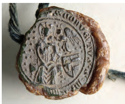
34. kép. A toplicai konvent 1399-i pecsétje (DL 66548., Kat. 14.8.2.)