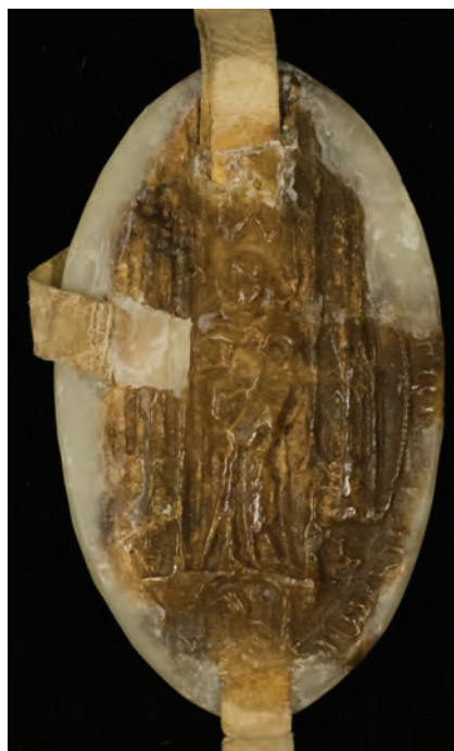
16. kép. Ulrik pilisi apát 1380-i pecsétje (DL 18439., Kat. 10.6.1.)