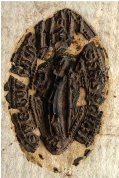
28. kép. Egyed zirci apát 1366-i pecsétje (DL 69984., Kat. 16.5.1.)