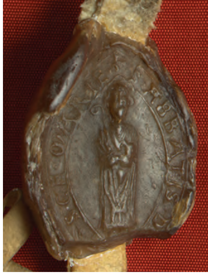
8. kép. A borsmonostori apát 1220 körüli pecsétje (DL 777., Kat. 2.1.1.)