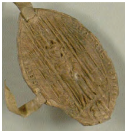
15. kép. Henrik pilisi apát 1377-i pecsétje (Heiligenkreuz, Stiftsarchiv 89-12-15, Kat. 10.5.2.)