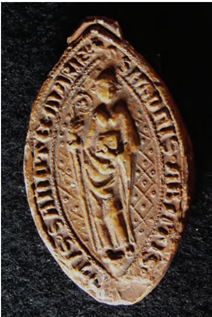
10. kép. Simon borsmonostori apát 1355-i pecsétje (MOL V 2 340, Kat. 2.4.1.)