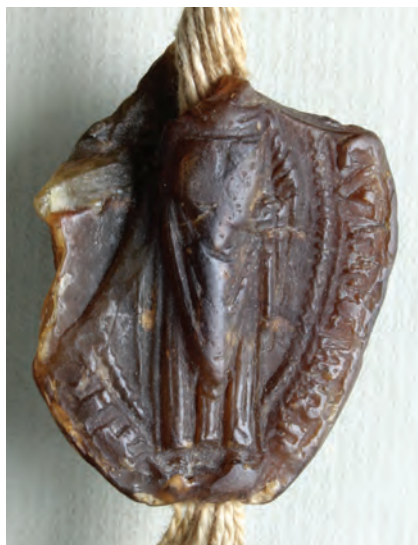
21. kép. A szepesi apát 1307-i pecsétje (DL 60961., Kat. 13.2.1.)