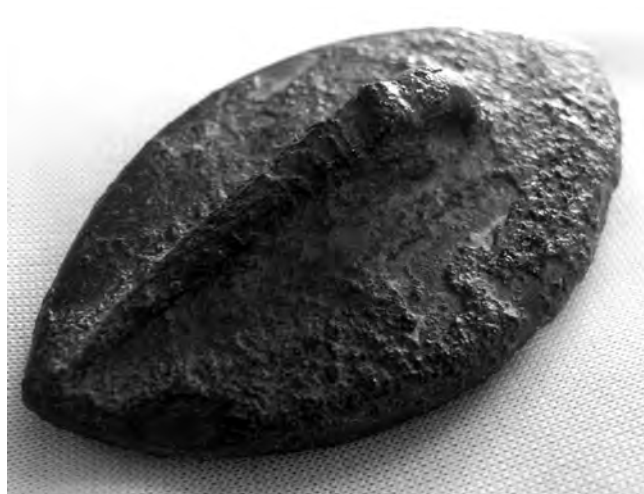
A visegrádi pecsétnyomó előlapja és hátoldala

szó. 9 A körirat kopottsága is arra utal, hogy a pecsétnyomót huzamosabb ideig használták. 10