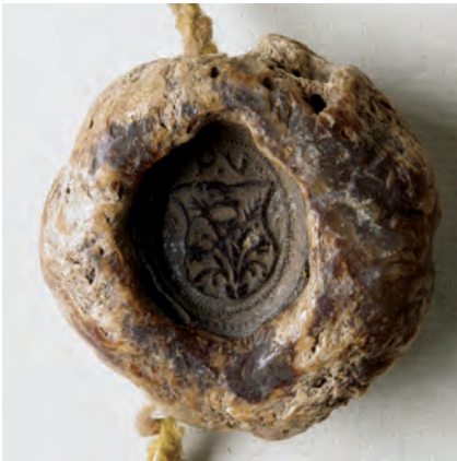
25. kép. Poszojevics Orbán toplicai apátsági udvarbíró 1509-i gyűrűs pecsétje (DL 108153., Kat. 14.6.1.)