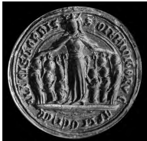
3. kép. A definitorium 1474. szept. 12-i pecsétje (Heiligenkreuz, Stiftsarchiv 60–4–6)