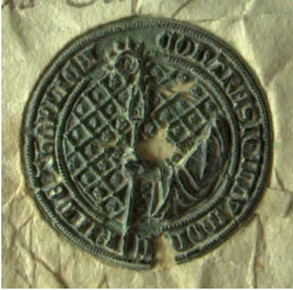
22. kép. Guido toplicai apát 1371-i ellenpecsétje (DL 5970., Kat. 14.2.2.)