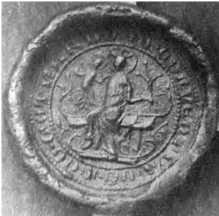
6. kép. A szentgotthárdi konvent pecsétjének 1489. évi lenyomata (Zlinszkyné Sternegg M.: A szentgotthárdi ciszterci apátság i. m. 369.)

Szűz Mária valamennyi magyar ciszterci konventi pecséten Mediatrix ként jelenik meg, 121 az esetek túlnyomó többségében trónuson ülve, ölében a gyermek Jézussal. A kerci konvent pecsétjének 1430. évi lenyomatán Máriát derekától fölfelé ábrázolták, a szepesi konvent 1320-as években használt pecsétjén pedig kétosztatú gótikus fülkében jobbra Mária, balra egy őt köszöntő angyal áll. 122 A trónoló Madonna-ikonográfia nagyobb szabadságot engedett a pecsétvéső művészeknek, mint az álló apát-téma. Mária legegyszerűbb esetben – az álló apát alakjához hasonlóan – a pecsétmező középtengelyére felépítetten, szemközt ül, ölében gyermekével. A mező két szélét a cikádori konvent pecsétjén a gótikus felépítmény, a kerci pecséten egy-egy gyertyatartó, Szentgotthárdén növényi ornamentika tölti ki. 123 A szentgotthárdi konvent 1489. évi lenyomatából ismert, de feltehetően korábban készült pecsétje alacsony színvonalú, bár az udvari reprezentációt követi: a Mária alatti hosszúkás trónus az 1300 körüli királyi pecsétek ábrázolására emlékeztet. Jézus érthetetlen módon lebegő alakja és Mária virágot tartó, kifacsart bal keze azonban a provinciális kivitelezés következménye. 124