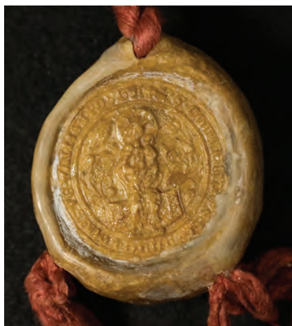
31. kép. A gotói konvent 1460-i pecsétje (DL 15490., Kat. 6.2.1.)