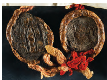
36. kép. János toploci apát és a konvent 1402-i pecsétje (HDA 659: Pavlinski samostam Zlat na Petrovoj Gori br. 3, Kat. 14.3.1. és 14.8.2.)