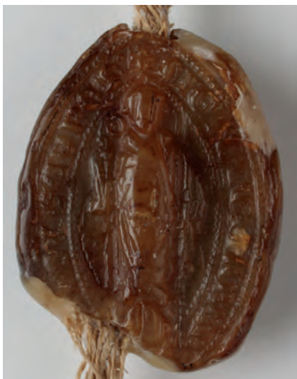
20. kép. A szepesi apát 1264-i pecsétje (DL 40058., Kat. 13.1.1.)