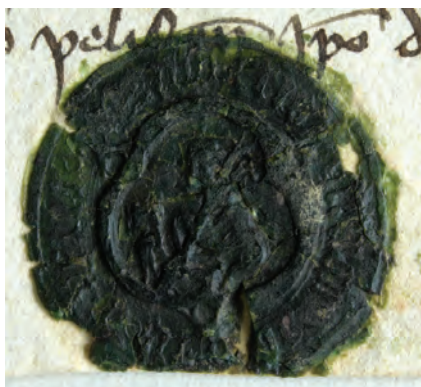
17. kép. Hermann pilisi apát 1445-i pecsétje (DL 44398., Kat. 10.8.1.)