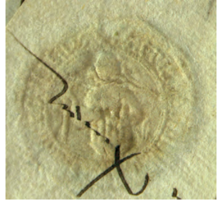
24. kép. Barnabás toplicai apát 1455-i pecsétje (DL 14982., Kat. 14.5.1.)