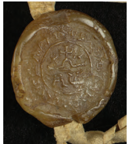
30. kép. A borsmonostori konvent (?) 1210 körüli pecsétje (DL 782., Kat. 2.10.1.)