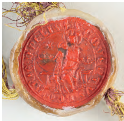
32. kép. A pilisi konvent 1341-i pecsétje (DL 71357., Kat. 10.11.1.)