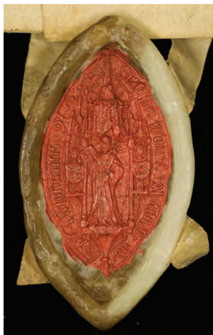
19. kép. János viktringi (és pornói) apát 1525-i pecsétje (DL 25315., Kat. 11.2.1.)