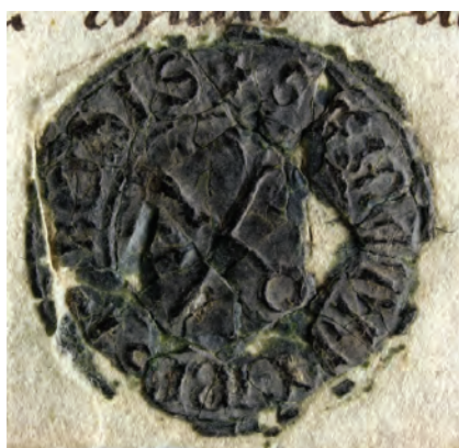
18. kép. Mátyás pornói apát 1401-i pecsétje (DL 42771., Kat. 11.1.1.)