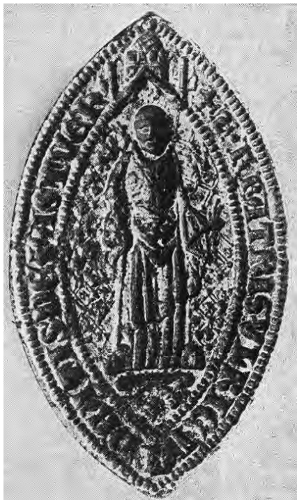
5. kép. A pásztói apát 14. századi tipáriumának lenyomata (Repertorium 247., Kat. 8.2.1.)

A szepesi apát 1307. évi pecsétjén az apát lába, a 1350 körüli pilisi tipáriumon a pástorbot lóg bele a köriratba. 106 Lehetséges, hogy ez az esetlen báj a vésnőkök ügyetlenségének következménye, de valószínűbb, hogy szándékosan feszítették szét a kompozíciót. Erre mutat a toplicai apát 1371-i, nagy művészi igényről tanúskodó ellenpecsétje. A rombuszhálós háttérbe bal oldalról határozott dinamikájú, pástorbotot tartó kéz nyúlik be. A könyökben behajlított karról súlyos redőkben omlik le a kissé visszacsúszott ruha ujja. A csontos kézfej erősen markolja a pástorbotot. A kép azáltal nyer további feszültséget, hogy a pástorbot alul és fölül is áttöri a pecsétmező keretét. 107 A 14. századtól – más főpapi pecsétekhez hasonlóan – a ciszterci apáti pecsétek is architektonikus tagolásúakká váltak, vagyis az apát álló alakja egy gótikus fülkébe került. A legkorábbi ilyen Henrik pilisi apát második, 1370 táján használt pecsétje. 108 A kisebb és gyűrűspecsétek nem architektonikus kiképzésűek. 109