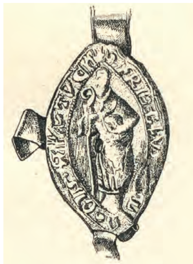
13. kép. Blondellus pásztói apát 1342-i pecsétje (Békefi R.: A pásztói i. m. II. 7., Kat 8.1.1.)