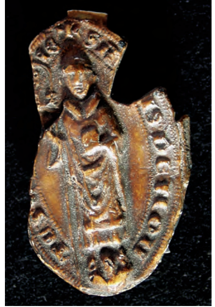
9. kép. A borsmonostori apát 1331-i pecsétje (MOL V 2 247, Kat. 2.3.1.)