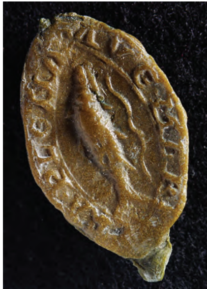
26. kép. A zirci perjel 1253-i pecsétje (MOL V 8 335, Kat. 16.1.1.)