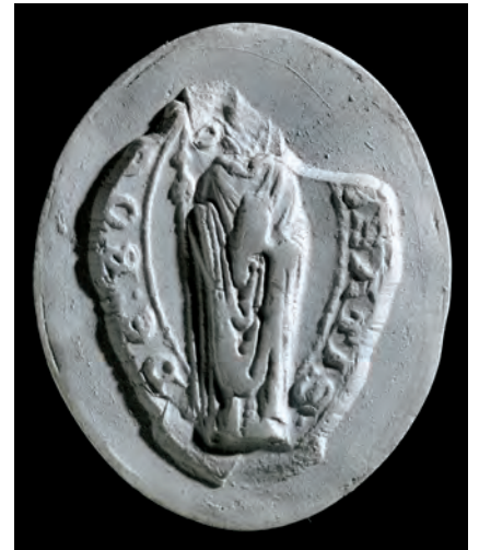
27. kép. A zirci apát 1262-i pecsétje (BTM 65.1830., Kat. 16.2.1.)