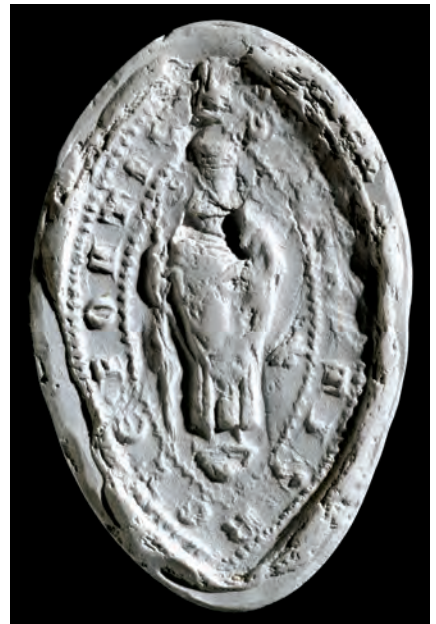
12. kép. A péterváradi apát 1302-i pecsétje (BTM 65.1845, Kat. 9.2.1.)