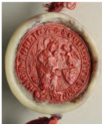
33. kép. A toplicai konvent 1384-i pecsétje (DL 66543., Kat. 14.8.1.)