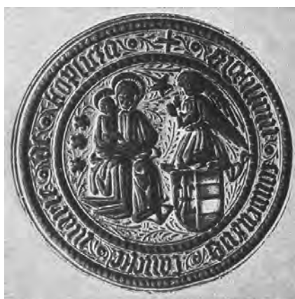
35. kép. A toplicai konvent 15. századi tipáriumának lenyomata (Repertorium 247., Kat. 14.8.3.)