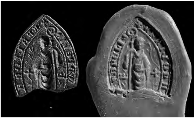
4. kép. János pilisi apát 1350 körül használt tipáriumának töredéke és lenyomata (Ferenczy Múzeum, Szentendre P-84.65., Kat. 10.4.1.)

monostor 1310-es évekből vagy korábról származó, és eredetiben ránk maradt oklevelei csupán egy pecsét alatt keltek (ezek corroboratio ja csak az apát pecsétjéről beszél); a rendház kiadványai között tehát egyaránt találunk egy-és kétpecsétes okleveleket. A konventi pecsét tilalmának tekintetében a pilisi monostor sem követte a generális káptalan előírásait. 1301. és 1311. évi oklevelein két-két pecsét függött, sajnos, mindkettőn csak az apáti pecsét maradt meg (érdekes módon az 1301. évin az apát ellenpecsétje függ). 96 A szepesi konvent tehát már 1294-ben, a pilisi 1301-ben használt pecsétet, évtizedekkel a pápa 1335-i bullája előtt. Magyarországon a generális káptalan tiltó előírásai e vonatkozásban nem érvényesültek maradéktalanul.