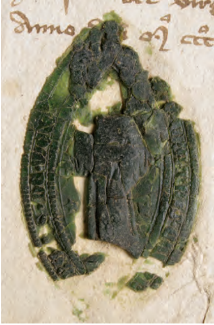
7. kép. Konrád bélháromkúti apát 1390-i pecsétje (DL 89562., Kat. 1.1.1.)