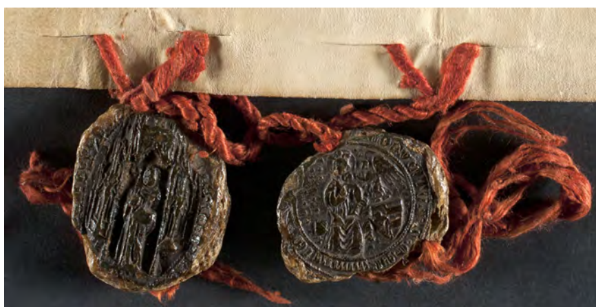
37. kép. János toplicai apát és a konvent 1402-i pecsétje (HDA 659: Pavlinski samostam Zlat na Petrovoj Gori br. 4, Kat. 14.3.1. és 14.8.2.)