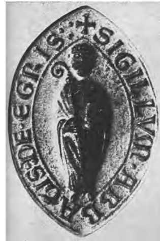
1. kép. Az egresi apát 14. századi tipáriumának lenyomata (Repertorium 247., Kat. 4.2.1.)

Az apáti pecséthasználat egyik fontos területe volt a vizitációk jegyzőkönyveinek hitelesítése. A Libellus definitionum 1220 körüli és 1257-i szövege hangsúlyozza, hogy a jelentést csak a vizitáló apát pecsételje meg. Egy 1296-i statútum megparancsolta, hogy a vizitációs jegyzőkönyvet a vizitáló és a