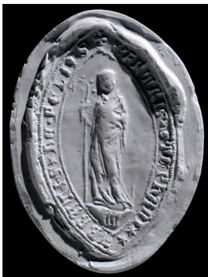
14. kép. István pilisi apát 1341-i pecsétje (BTM 66.2133, Kat. 10.3.1.)