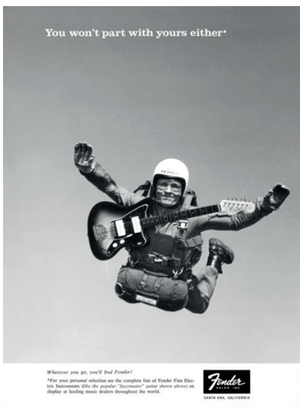
2. ábra. Életmódfotó Fender-módra az 1960-as évekből

Mindkét kép a fehér férfihoz és a fehér középosztályi kultúrához köti a Fender-hangszereket és a gitárost. A Fender-gitárokkal látható fiatal fehér férfiakat ábrázoló képek egyéb, a középosztálybeli fehér férfiakra jellemző kulturális vágyakra – így például a szörfözésre vagy az ejtőernyőzésre (lásd 2. és 3. ábra) utalnak. Más, a termékkatalógusokban szereplő fogyasztóiéletstílus-fényképeken a Fender-gitárok a fehér középosztályi maskulinitását – a tengerpartot, síparadicsomokat vagy háborús jeleneteket – jelenítik meg. Még egy olyan képpel is találkozunk, amelyen egy fehér férfi egy Fender-gitár társágában egy második világháborús tankot vezet. A kizárólag híres fehér gitárosok szerepeltetése és a fehér középosztályi maskulinitást ábrázoló képek használata együtt megerősíti a tárgyval és a fogyasztóval kapcsolatos rassz- és genderhatárokat. Míg a Fender híres gitárosokat és fogyasztói életmódot ábrázoló képeket is felhasznált reklámányaiban, addig a fő riválisának számító Gibson kizárólag a hangszereiket és eszközeiket használó hírességek képeivel dolgozott. Ebben az értelemben a Gibson-katalógusokban kizárólag a híres gitárosokat ábrázoló fényképek játszottak szerepet a rasszalapú határmegvonásban. 7