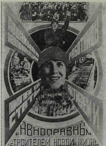
A. M. Rodcsenko: Fotómontázs: (1923)