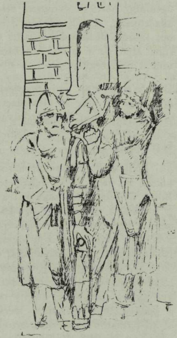
Jazig harcosok Traianus oszlopáról

A szarmaták külseje és viselete iráni eredetű népre utal. Tacitus, római történetíró feljegyezte, hogy az Al-Duna vidékén lakó basztarnákat elrutítja a szarmatákkal való keveredés. Lehetséges, hogy csak irodalmi sablonról van szó ebben az esetben, de valószínűbbnek látszik, hogy a rómaiak számára idegen, csúfnak tűnő vonások mongoloid jelleget takarnak, ugyanis többen mongoloid vonást véltek felfedezni Traianus császár diadalmi oszlopának ábrázolásain. A Konstancába száműzött Ovidius és később Claudius Claudianus azt állítják róluk, hogy a hajuk, a szakálluk szőke volt. Hajukat nem kötötték csomóba, mint a germánok, hanem hosszan leeresztve viselték. Tacitus szerint tetoválták vagy festették a bőrüket. Ruházatuk az iráni népekéhez állt a legközelebb. A parthusoknál szokásos bőszárú nadrágot hordták és nem a germánoknál elterjedt szűk – a rómaiak által – bracának nevezett nadrágot.