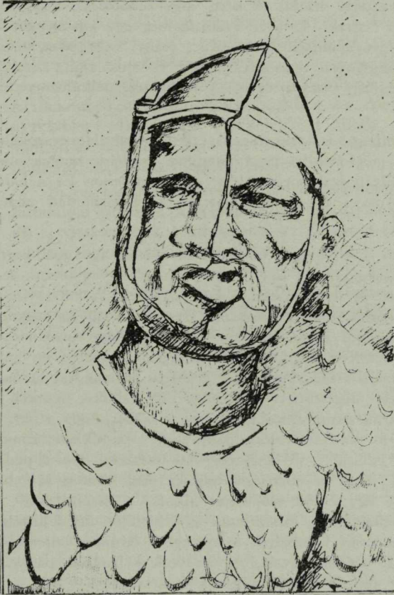
Roxolán harcos Traianus oszlopáról

non, Bormanon, Abiéta, Trisszon, Parka, Kandanon és Pesszion. Pontos lokalizációjuk mind a mai napig nem sikerült még – bár minden bizonyíték nélkül – már azonosították ezen városok neveit Szeged, Szolnok, sőt Jászberény nevével is. A rendelkezésünkre álló nyelvi anyag olyan kevés, hogy egyáltalán nem alkalmas a jász-jazig azonosság bizonyítására. Kérdéses, hogy egyéb adatok hozzásegítenek-e az azonosság tisztázásához?