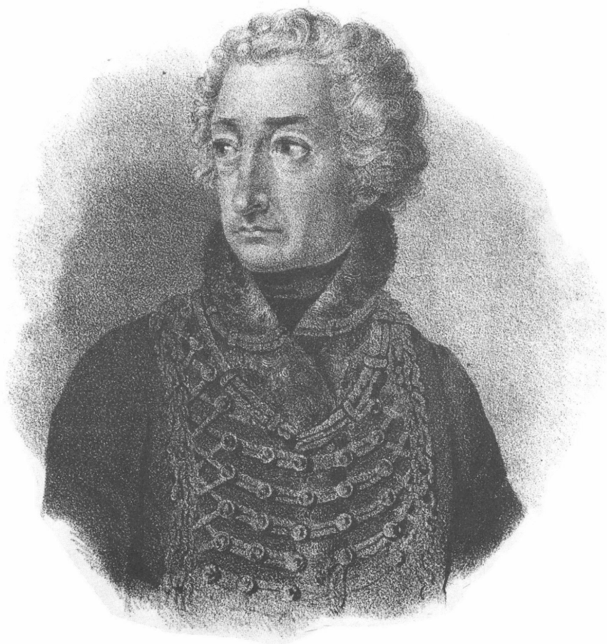
Gróf Festetics György (1755– 1819)