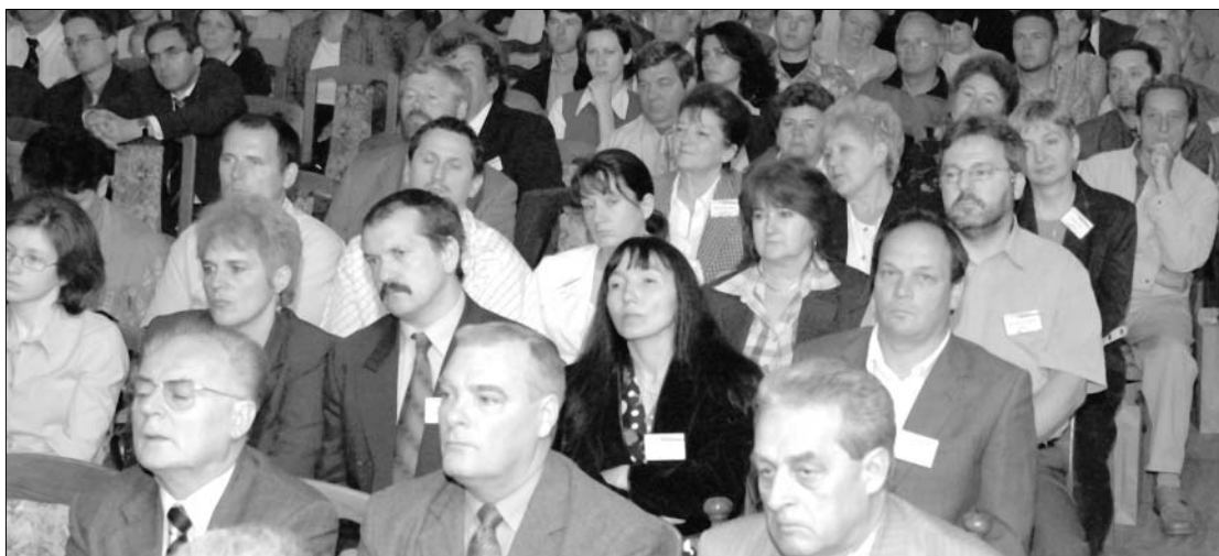
A közönség egy része

valyi nehézségek (felhőszakadás, utakat elzáró földcsuszamlás) nem ismétlődtek meg. A 165 résztvevő (85 anyaországi és 80 erdélyi) elszállásolását a nagymúltú város központi szállodája biztosította.