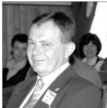
Dr. Mihály Szabolcs FÖMI főigazgató, az MFTTT IB tagja

központja, Tasnád volt, ahol a termálstrand közelében lévő Biamin vendéglőben fogyasztottuk el az, e vidék konyhaművészetére jellemző, ízletes ebédet, majd tovább indultunk, Kőlcsey Ferenc 4 szülőfaluja, Szödemeter felé. Ott szembesültünk kisebbségi sorsunk egyik szomorú, de jellemző valóságával. A „Hymnus a magyar nép zivataros századaiból” szerzőjének szülőháza ma ortodox parókia, ahová a kegyeletüket