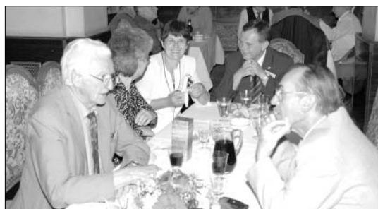
A budapestiek asztaltársasága