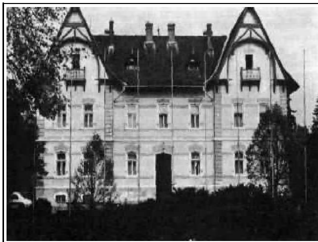
1. kép. A Temesvár–Vadászerdei M. Kir. Erdőőri Szakiskola főépülete