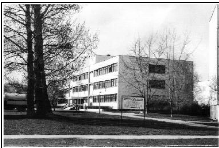
4. kép. Az Erkel Ferenc iskola, ma a Fáy András Közgazdasági Szakközépiskola a Teleki Pál úton