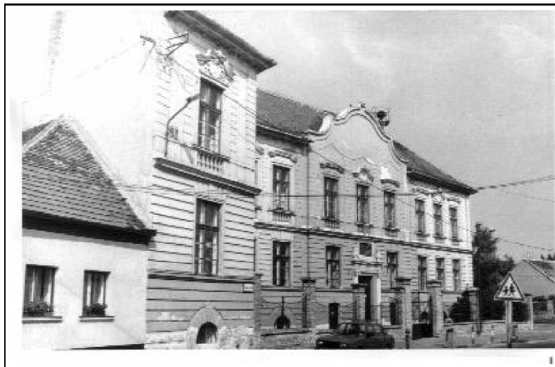
1. kép. Az egykori polgári, ma Petőfi Sándor iskola a Halász utcában.

Az 1910-re felépült Tóth Antal utcai siketnémák tanintézet e tervei az első magyar olimpiai bajnokként ismert Hajós (Gutmann) Alfréd építész munkájaként készültek Budapesten, a Hajós és Villányi építész irodában. Az 1908-ban kelt első tervek még több szecessziós ornamens mutattak, mint a két évvel később elkészült épület, de a helyiség-diszpozíció és a tömegkompozíció érdemben nem változott. A kosárféves záradékú ablakok ugyancsak újításnak tekinthetők a historizmus tradícióival szemben. Az épület a funkcionak megfelelően aszimmetrikussá tagolt, ennek különös hangsúlyt ad, hogy az aszimmetria éppen a város felől közelítőt fogadja. A tanterem földszint + 3 emeletes tömbjét a tornateremtől és az igazgatói lakástól – amelyeket kétszintes tömbbe foglaltak –, félszint-eltolódással a lépcsőház választja el. Hangsúlyos az összetett tetőidom is. Az épület egész elrendezése a funkcionista építészetet vetíti előre. A mai napig érdemben változatlan maradt, ma a „Tóth Antal Óvoda, Általános Iskola és Speciális Szakközépiskola” működik benne.