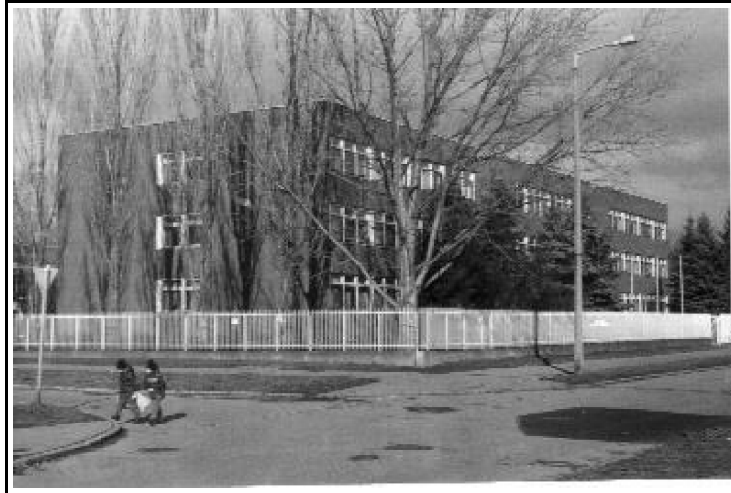
5. kép. A Lackner Kristóf Általános Iskola a Révai utcában.

A két világháború közötti soproni iskola-építkezéseknél meg kell végül jegyezni, hogy a Katolikus Konvent 1930 decemberében jelígs tervpályázat ot írt ki egy a Nándor-fasoron 380épülő templom és iskola épületére. Az iskolaépületet 1:100 léptékben kellett megtervezni, a templomnak csak a helyét kellett kijelölni, tehát elsősorban az iskolát kívánták megvalósítani. A beérkezett tervek alacsony színvonala miatt a pályázat csak a városépítés-történet tekintetében érdekes. 1931 áprilisában Schármár Károly a pályázat tanulságainak összesítéseként kidolgozott egy javaslatot költségbecsléssel együtt. Sem az iskola, sem a templom nem épült fel, ehelyett 12 évvel később itt – a mai Ady Endre út elején – fogtak neki az Egyetem kollégiumi épületének építéséhez. 2(250)