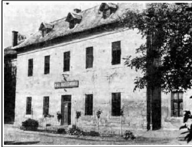
3. kép. A M. Kir. Erdőgazdasági Szakiskola esztergomi épülete

1923-ban megszavazott 1923: XIX. tc. az Alföld-fásításról, amelyet a magánbirtokosok a végrehajtásban megakadályoztak, így sok munkalehetőség veszett kárba. Továbbá a munkaerőpiacon az állás nélkül maradt erdőtiszték (mérnökök) is ott voltak, hiszen a nagy gazdasági világválság minden szakmát sújtóan diplomások tömegét lökte az utcára. 38(229)