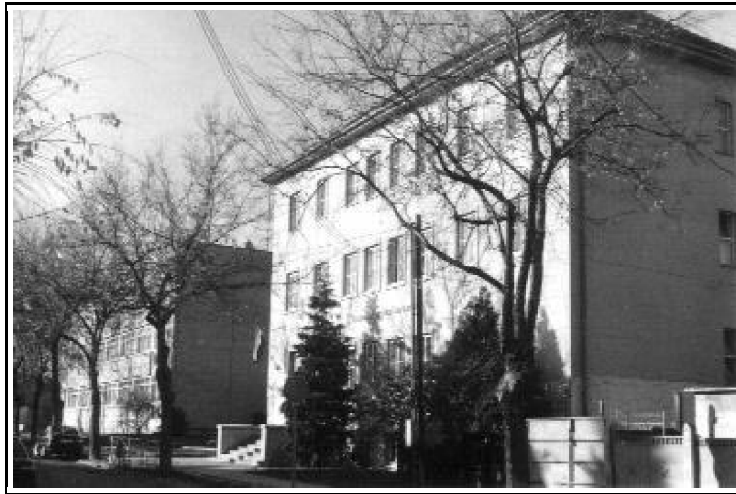
2. kép. A Hunyadi János Evangélikus Iskola.