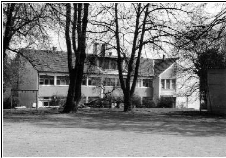
3. kép. A Nevelőotthon iskolája a Fülesei úton, ma az Egyetem Idegen Nyelvi Központja.