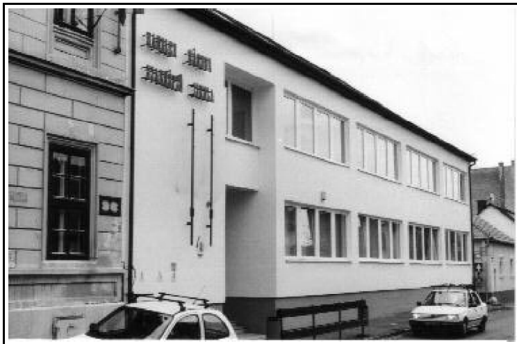
6. kép. A Halász utcai Handler Nándor Szakképző Iskola.