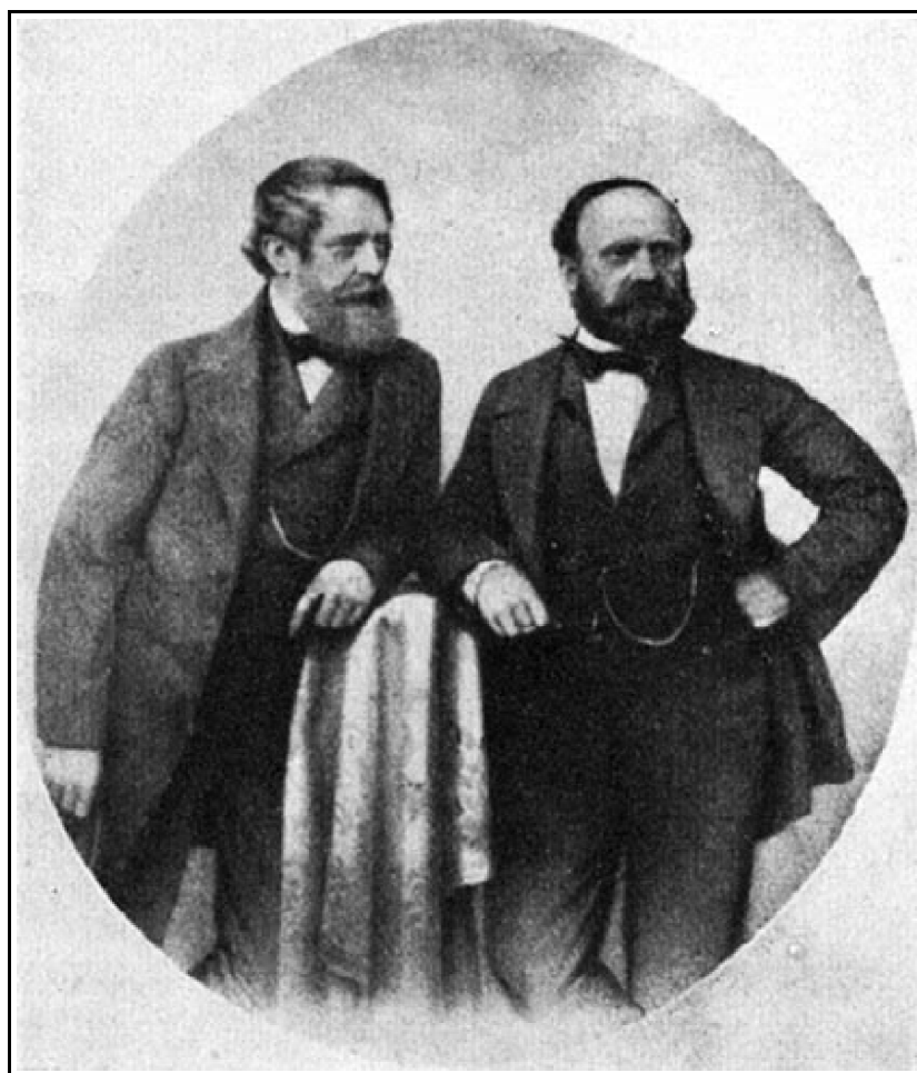
Kossuth Lajos és Ihász Dániel.

De vannak vidám sorok is a levelekben. Mert Ihász Dániel lényé alapján derűs, s ezért hálás a szeretetnek és ragaszkodásnak minden megnyilatkozásáért. Örömmel újságolja, hogy milyen szép ajándékot kapott Veszprémből: „A veszprémi iparosok 256 a mult hó 25-én, amint a magyar lapokból olvashattad, egy igen szép remekmű csutorával leptek meg (mintha biz én a Bacchus testvér volnék). Nem tagadhattam meg szíves ajánlatokat s köszönettel elfogadtam tőlök; a munka rajta oly szép, hogy bármely világkiállításban szerepelhetne.” 64(64) Majd arról ad hírt, hogy milyen sikert ért el egy fényképész róla készített arcképével: „Egy (arcképem) természeti nagyságban levéve van kitéve az itteni legelső fényképésznél, ablakja előtt, ahol ki van téve, folyvást tömeg áll bámulására, s én meg azt bámulom, hogy mi van rajta bámulni való, hisz se nem torzkép, sem nem éppen csúnya kép. De egyáltalában a művész ügyességét mondják, hogy bámulatos. Egy példányt már eladott csupán a finom munka végett, 150 frank. Magam sem érek annyit.” 65(65)