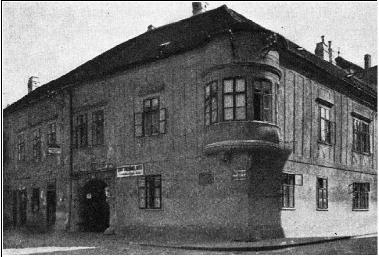
Az Ihász-féle ú. n. zöld ház Sopronban.