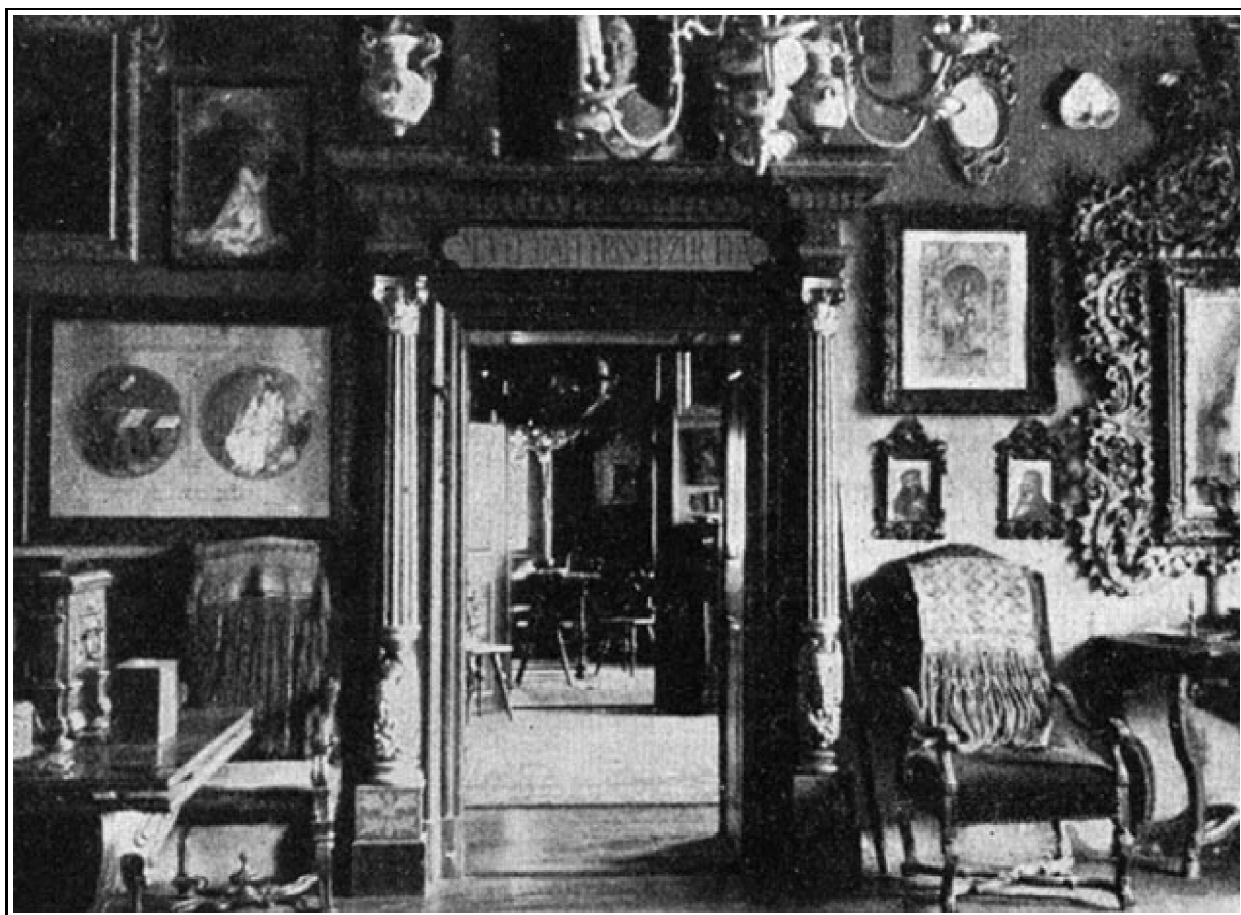
6. kép. Fogadószoba.

Storno Ferenc Kálmán önarcképe, olaj- és szénrajz, 1901, anyja arcképe, ceruzarajz 1901-ből.