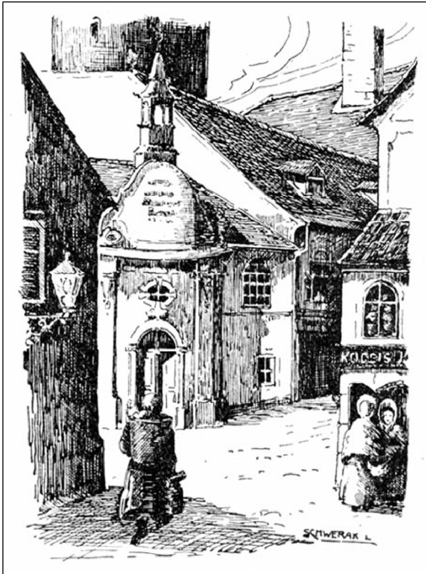
Szent János-kápolna az Előkapunál. Lebontották 1899-ben. Schwerák-Rossrucker rajza.

1942. VI. ÉVFOLYAM 3. SZÁM / Storno Miksa: A Storno-család magángyűjteménye.