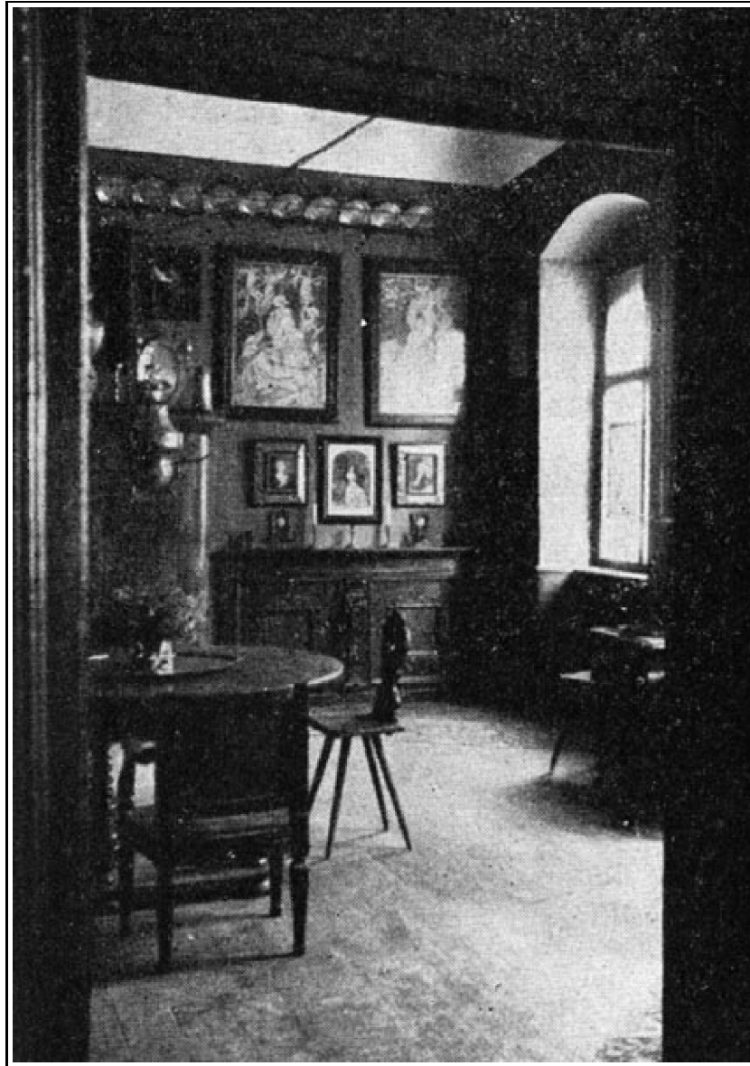
2. kép. Ebédő részlet.

tárgyszerinti csoportosításban kiállítva nincsenek, hisz a családnak nem volt szándéka múzeumot létesíteni. Az idők folyamán hatalmasan fellendült idegenforgalom, valamint a régi iparművészet iránt mindjobban fokozódó érdeklődés a gyűjteményt szélesebb körökben tette ismertté, úgyhogy ma alig fordul meg idegen a városban, aki a gyűjteményt meg nem tekintené. Ez a körülmény készítette a családot arra, hogy a gyűjteményt, melyet immár a harmadik nemzedék tart fenn és ma is gyarapít, a közönség számára hozzáférhetővé tegye. 14(19)