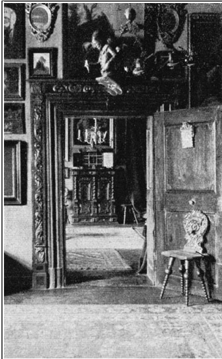
4 kép. Szobarészlet.

4. Elsőemeleti előtér. Kétszárnyú kovácsolt vasrácsajtó 1773. évszámmal és F. S. monogrammal. Kétajtós szekrény puhafából (18. sz.). Rajta fából faragott gyertyatartók (18. sz.). Zöldmázás nagy céhkorsó 1838. évszámmal. Asztal diófából, esztergályozott erős lábakkal, soproni gazdapolgár házából (17. sz.). Ugyanonnan diófából készült székek, kivágott támlákkal. A falon Krisztus-monogramm kovácsolt vasból, a Szt. János-templom lebontott régi tornyáról. A két ajtó fölött félköríves vasrács (új, nyilakkal) a Müller P.-utca 3. számú házról (19. sz. eleje). A falakon illusztrációk Kisfaludy Sándor „Csobánc” című regéjéhez. 17(22) 189A mennyezet a Háromházsér 2. számú házban volt vendégfogadó cégére (18. sz. vége). 18(23)