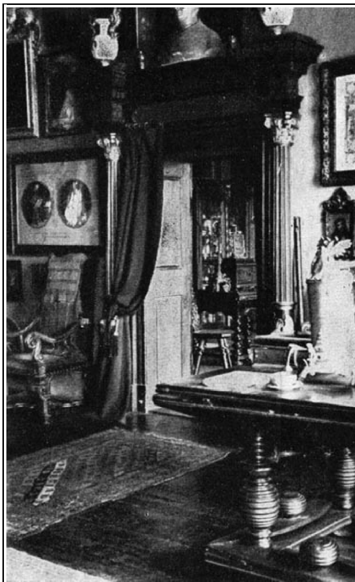
5. kép. A fogadószoba egyik bejárata.

Kerek asztal esztergályozott lábakkal, diófából (17. sz.).