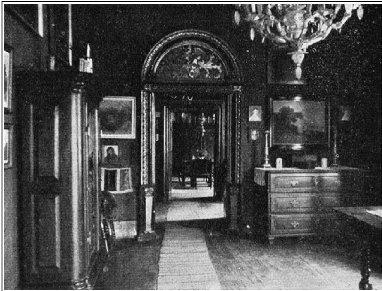
3. kép. Erkélyszoba.

így még bekapcsolódnak a biedermeier-kor művészetébe, újabb munkái viszont már a korszerűbb felfogásnak szellemében készültek. Ez különösen nagyszámú vázlatkönyveiben jut kifejezésre, amelyek azzal, hogy sok hazai műemléket rögzítenek meg, művészettörténeti értéket jelentenek. Egyházművészeti beállítottságánál fogva képei főleg e tárgykörből valók, bár nagy számmal vannak világi tárgyú alkotásai is, s külön teret foglalnak el illusztrációs rajzai. Ezek között különös figyelmet érdemel Kisfaludy Sándor „Csobánc” című regéjéhez, alig ismert, 7 lapból álló képsorozata, mely magyar- és németnyelvű magyarázó szöveggel könyvformában is megjelent. 15(20)