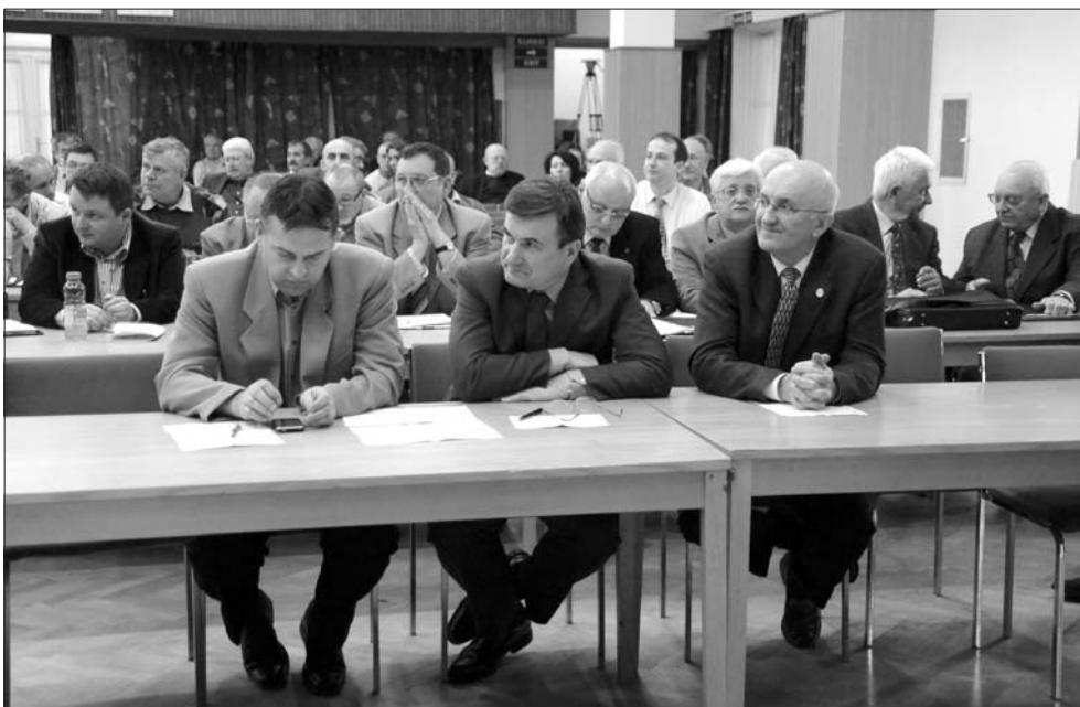
Küldöttgyűlés, 2010. március 29.