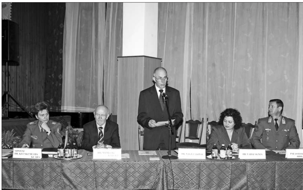
A hazai katonai felsőoktatás helyzete, perspektívái és a tisztképzés sajátosságai konferencia, 2007. október 10.