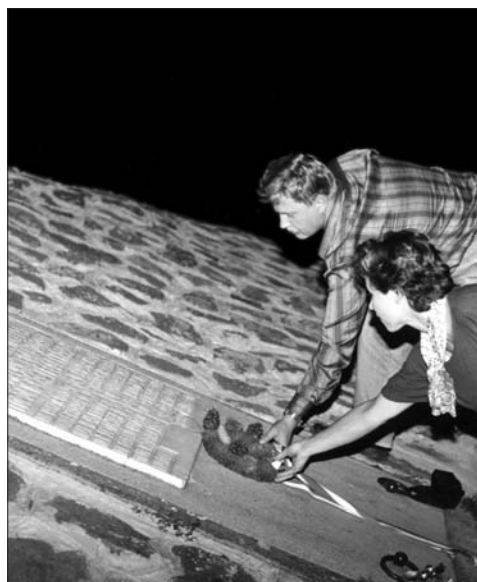
1997-ben a klub tagjai lerótták kegyeletüket Aradon, a vértanúk emléktáblájánál