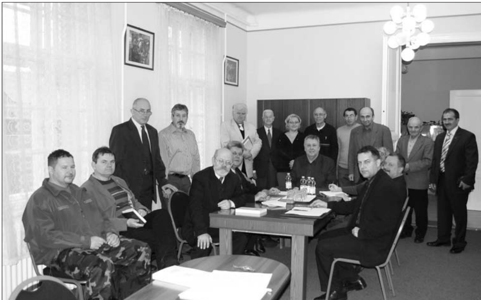
A jubileumi év feladataival kapcsolatos kérdésekről tárgyalt az MHTT elnöksége 2009. december 11-én