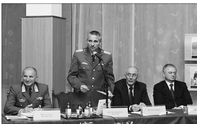
A katonai erő újszerű alkalmazása a 21. század elején című konferencia, 2005. november 3.