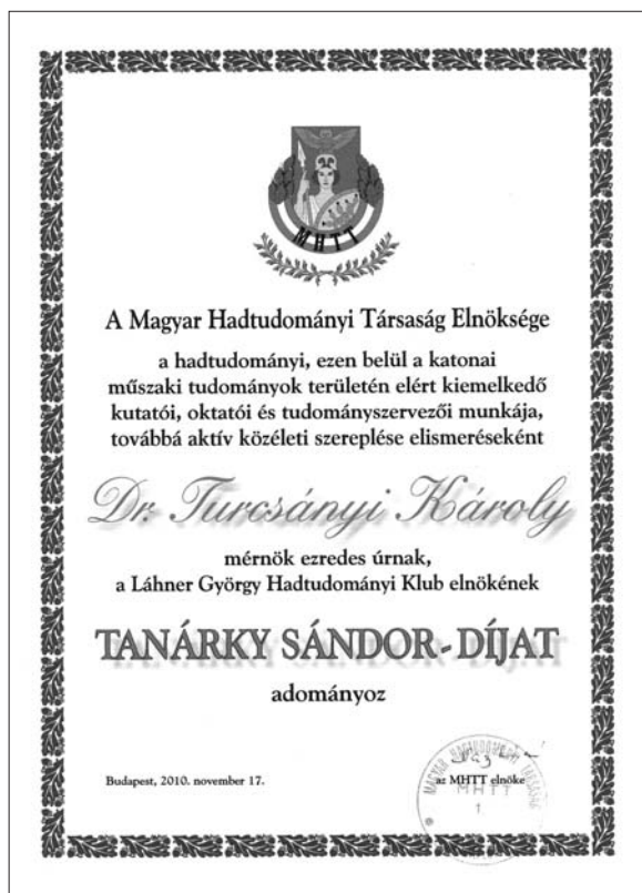
A Tanárky-díj oklevele és plakettje