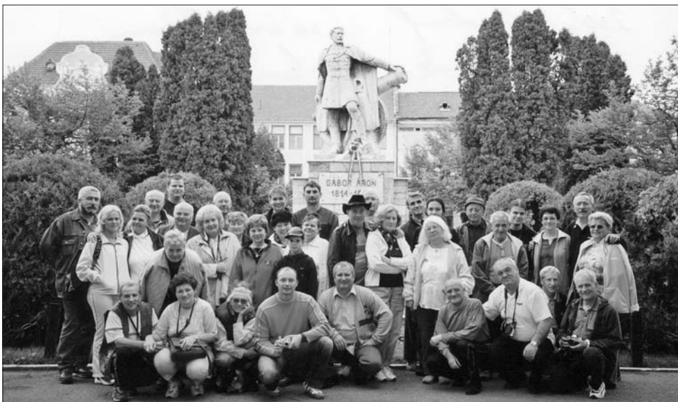
A csoportkép 2005-ben készült Erdélyben, Gábor Áron szobrának koszorúzása alkalmából