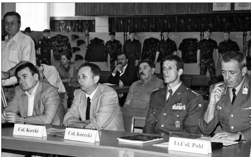
Missziós feladatok védelemgazdasági nézőpontból című konferenciánkat megtisztelték a hazánkba akkreditált katonai attasék is, 2008. május 29–30-án