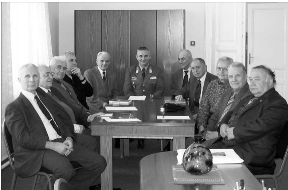
A Hadtudomány folyóirat szerkesztőbizottságának ülése, 2010. február 9.