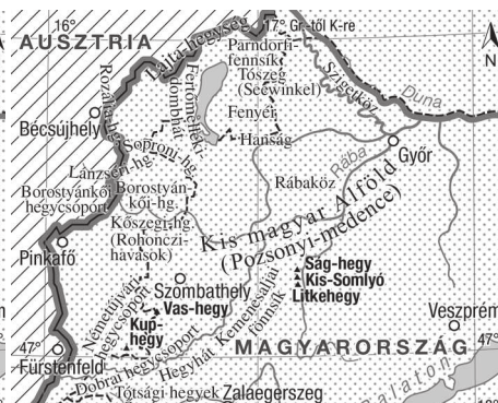
2. térkép Nyugat-Magyarország táji tagolása a „Kronprinzenwerk”-ben és a „Borovszky”-ban

Tervezte: Jankó Ferenc; kartográfia: Bottlik Zsolt