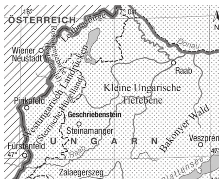
1. térkép Nyugat-Magyarország táji tagolása az osztrák monográfiákban

Tervezte: Jankó Ferenc; kartográfia: Bottlik Zsolt