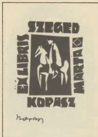
KOPASZ Márta fametszete X2

Szegeden két kisgrafikai kiállítás követte egymást december és január hónapban. 1973. december 13-án nyitották Béla Művelődési Otthonban Kass János grafikáit és kisgrafikáit bemutató kiállítást, amelyet Réthy István művészeti titkára nyitott meg.