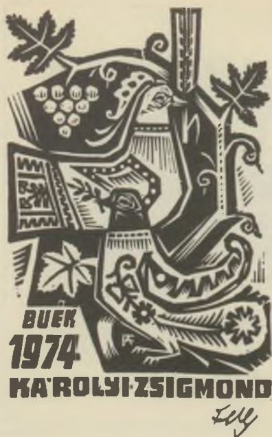
FERY Antal fametszete X2