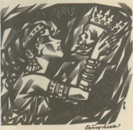
INYBULK fametszete X2