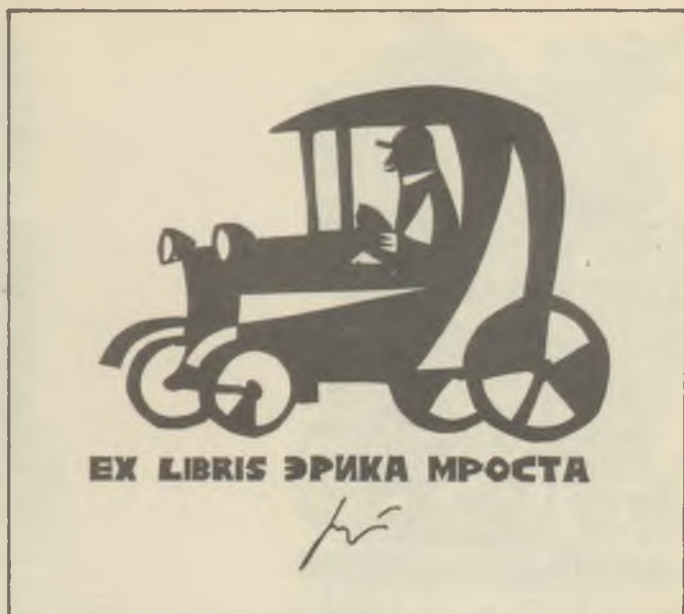
G. RATNER műanyagmetszete X6

A Typographia 1973. évi 2. számában Nagy Zoltán Munkácsy-díjas művészünköt mutatja be "A szavak művésze. Aranykéz - alkotás" címmel, három fénykép kíséretében.