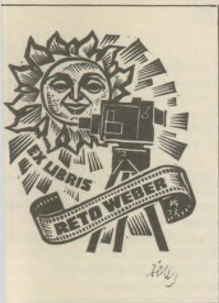
Antal fametszete X2