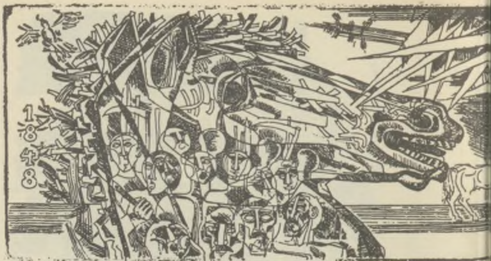
JÓZSA János rézkarca C3

A kitűzött díjakon Deák Ferenc (I. díj), Perei Zoltán (II. díj) és Papp György (III. díj) osztozkodnak. Deák Ferencben egy, a műfajban később kiteljesedett alkotót köszönhetünk, akiben a jó ex libris művész minden adottsága fellelhető; egyéni képszerűségével, technikai bravurjaival, szimbolikájának filozófikus mélységével joggal magasodik a többi alkotó fölé; biztosak vagyunk benne, hogy nem kis szerepe lesz a magyar ex libris művészet megújításában. Perei Zoltán tehetségéről eddig kevesen vettek tudomást, a megismerés magányába zárva alkotta egyéni metszőtechnikával kivitelezett, egyszerűségükben is erőteljes, duzzadó, konvenciómentes lapjait; reméljük, hogy a ceglédi díj nyomán a művészek után a gyűjtőknek is ráirányul a figyelmük és lapjai ott lesznek minden ex libris gyűjteményben. Papp György harmadik díja arra figyelmeztet, hogy Szeged értékes kisgrafikai hagyományai ma is élnek és számíthatunk rájuk.